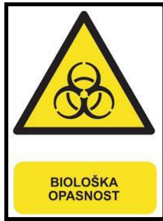
Sl. 3. Biološka opasnost [4]

otklonila mogućnost zaraze. Najveći rizik obolijevanja postoji od: virusnog hepatitisa, tuberkuloze i AIDS-a (Slika 3.) [4].