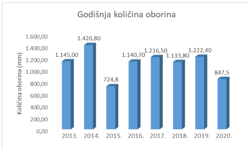
Tablica 1. – Godišnja količina oborina u razdoblju od 7 godina

Snijeg je rijetka pojava na području Grada i ta je meteorološka pojava uglavnom povezana s jakim istočnim i sjevernim vjetrovima kada snježne oborine budu nanijete na otok. Taj fenomen je pojava karakteristična za sjeverni dio otoka Lošinja i južni dio otoka Cresa. [2]