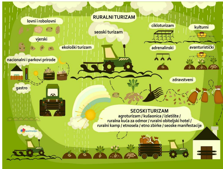
Slika 1 Ruralni i seoski turizam