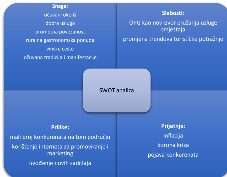
Slika 3 SWOT analiza

Kao prodajni rizik valja spomenuti sezonalnost koja kod nas zastupljena kako u ovoj vrsti turizma tako i u drugima. Planirana sezona uključuje mjesec lipanj pa sve do kraja rujna, s time da su srpanj i kolovoz udarni mjeseci. Klimatske promijene mogu nepovoljno utjecati na prodaju, no treba spomenuti da u ovakvoj vrsti turizma ima mnogo načina kako se sezona može produžiti. Slijedi SWOT analiza koja će nam prikazati snage, slabosti, prilike i prijetnje kojih treba biti svjestan.