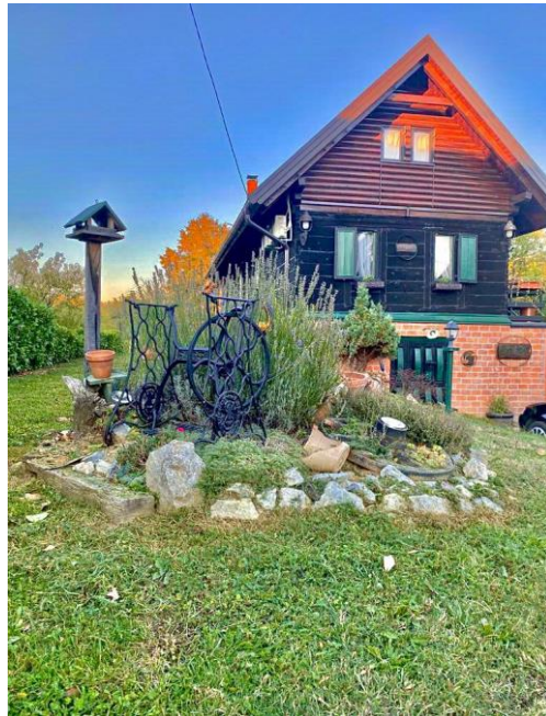
Slika 2 M&M kuća za odmor (OPG Ksenija Barišić)

još 4 osobe, kupaonice te dodatnog zahoda. Svi sadržaji opremljeni su propisanom opremom te ispunjava minimalne uvjete za ruralnu kuću za odmor sa „4 sunca“. Poslovanje joj se proteže tokom cijele godine. Od dodatnih sadržaja mogu se pronaći bazen tokom ljetnih mjeseci te jacuzzi tokom hladnijeg razdoblja u godini. Također nudi se i biljar te fire pit, mreža za odbojku, igralište za mali nogomet i oprema za ostale zabavne aktivnosti.