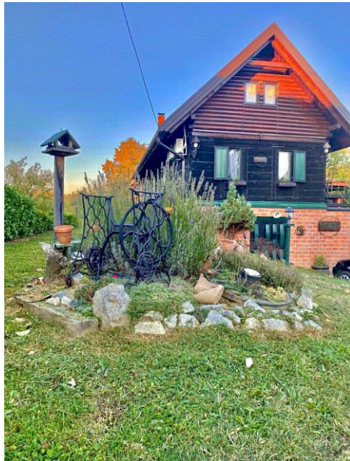
Slika 2 M&M kuća za odmor (OPG Ksenija Barišić)

još 4 osobe, kupaonice te dodatnog zahoda. Svi sadržaji opremljeni su propisanom opremom te ispunjava minimalne uvjete za ruralnu kuću za odmor sa „4 sunca“. Poslovanje joj se proteže tokom cijele godine. Od dodatnih sadržaja mogu se pronaći bazen tokom ljetnih mjeseci te jacuzzi tokom hladnijeg razdoblja u godini. Također nudi se i biljar te fire pit, mreža za odbojku, igralište za mali nogomet i oprema za ostale zabavne aktivnosti.