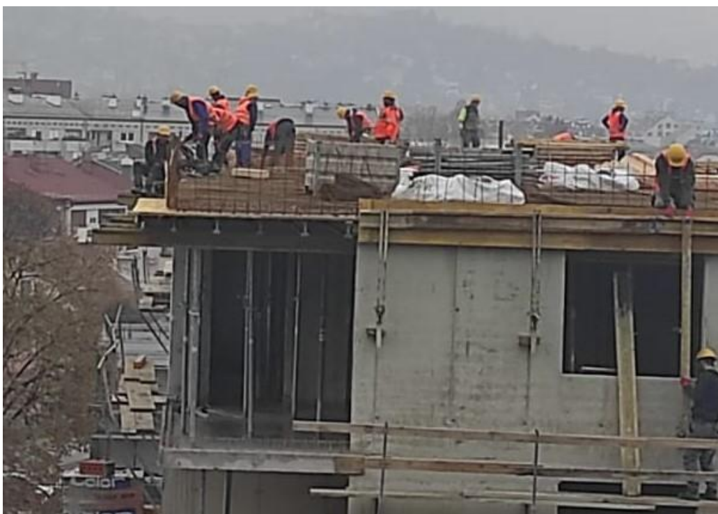
Slika 25. Radnik bez zaštitnog pojasa se naginje preko armature

Nakon pregleda na gradilištu često sam imala priliku vidjeti kao radnici ne koriste niti najosnovnija osobna zaštitna sredstva. Tijekom rada jednom prilikom sam pogledala na gradilište i vidjela radnike kako bez zaštitnog pojasa ili ograde naginju se na armaturu. Takvi potezi tijekom rada su vrlo opasni po život radnika. Izvođač radova ili koordinator II koji dolazi u nadzor na gradilište primorani su na takve izvedbe radova reagirati. Sami izvođači da bi što prije završili posao ne reaguju na takve propuste. Prilikom rada na velikim visinama potrebno je postaviti odgovarajuću skelu i ogradu, čega nije bilo niti jednog niti drugog na gradilištu. Npropisno postavljene manje skele za velike visine i radnici bez zaštitne opreme određene za rad na visinama ukoliko ne postoji zaštitna ograda još su jedan propust. Tijekom izvođenja radova na visini preko balkona su radnici si dodavali velike grede i prilikom dodavanja drugi radnik je pridržavao prvoga za reflektirajući prsluk bez zaštitne ograde kako ne bi pao. Nažalost nisam uspjela uhvatiti tu sliku, no oni su obavljali posao bez ikakvog upozorenja. Glavni inženjer gradilišta bio je prisutan i nije reagirao na takvu situaciju. Najveća tragedija dolazi kada radnik neopreznošću izgubi život i nažalost tek tada se traže krivci (slika 25).