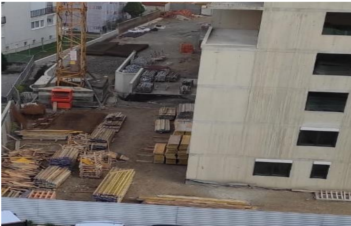
Slika 5. Neprohodni okolni put

Privremena prometna cesta na gradilištu se gradi u fazi pripremnih radova. Time je osiguran unutarnji horizontalni transport. Osim strojevima, unutarnji horizontalni transport se izvodi i ručno, odnosno uporabom ručnih kolica. Deponije materijala se nalaze unutar dometa mjesta ugradnje materijala, stoga će se takvi materijali najčešće dostavljati ručno. Zbog transporta materijala na mjesta gradilišta na koja je potrebno sve prometne površine moraju biti prohodne. Ukoliko je materijale potrebno dostaviti na određenu visinu na objektu u izgradnji, korištenje vertikalnog transporta dizalicama (kran) je neophodno.