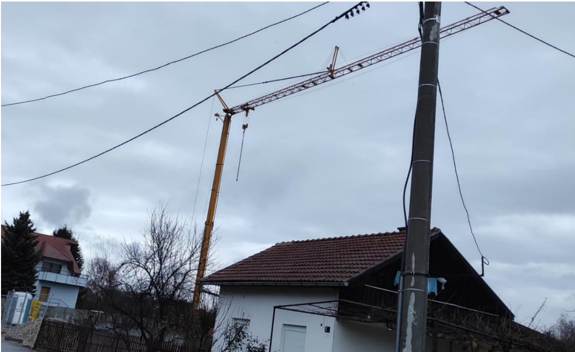
Slika 13. Dohvat kрана izlazi van granica gradilišta na okolni prostor

Najveći problem današnjice su mala gradilišta koja nemaju dovoljan prostor za velike dizalice te time ugrožavaju život ljudi izvan granica gradilišta. Brzim građenjem velikih zgrada na malim parcelama postavljaju toranjske dizalice (kranove) tako da njegov doseg seže izvan granica gradilišta. Ukoliko se u trenutku prenošenja tereta izvan granica nalaze prolaznici ne postoji nikakva sigurnost da u jednom trenutku neće doći do popuštanja dizalice i nesreće prolaznika (slika 13). Ovakva gradilišta su postala sve učestalija po gradovima koji se velikom brzinom šire [4].