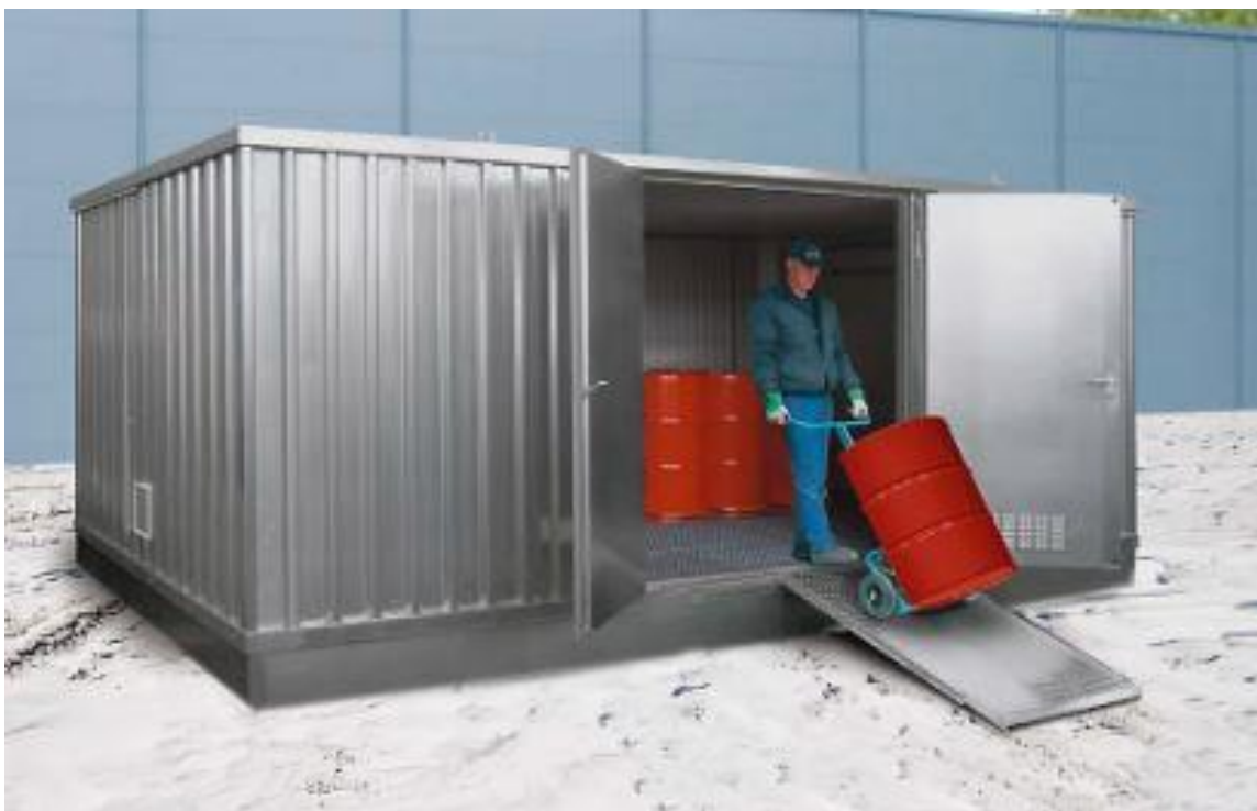
Slika 6. Limeni kontejner za čuvanje opasnih materijala na gradilištu

Smještaj opasnih materijala mora biti ograđen i natkriven prostor kojemu je omogućeno zaključavanje [3]. Od zapaljivih materijala, na gradilištu, će se većinom skladištiti strojna ulja, boje, lakovi i pripadajuća otapala. Zapaljive tekućine drže se u originalnoj i neoštećenoj ambalaži u limenom kontejneru smještenom tako da je udaljen minimalno 10 metara od ostalih objekata (slika 6). Kontejner mora imati prirodnu ventilaciju i ne preporučuje se dovod električne energije do kontejnera. Kod kontejnera obavezno je postaviti znakove požarne opasnosti, zabrane pušenja i uporabe otvorenog plamena [1].