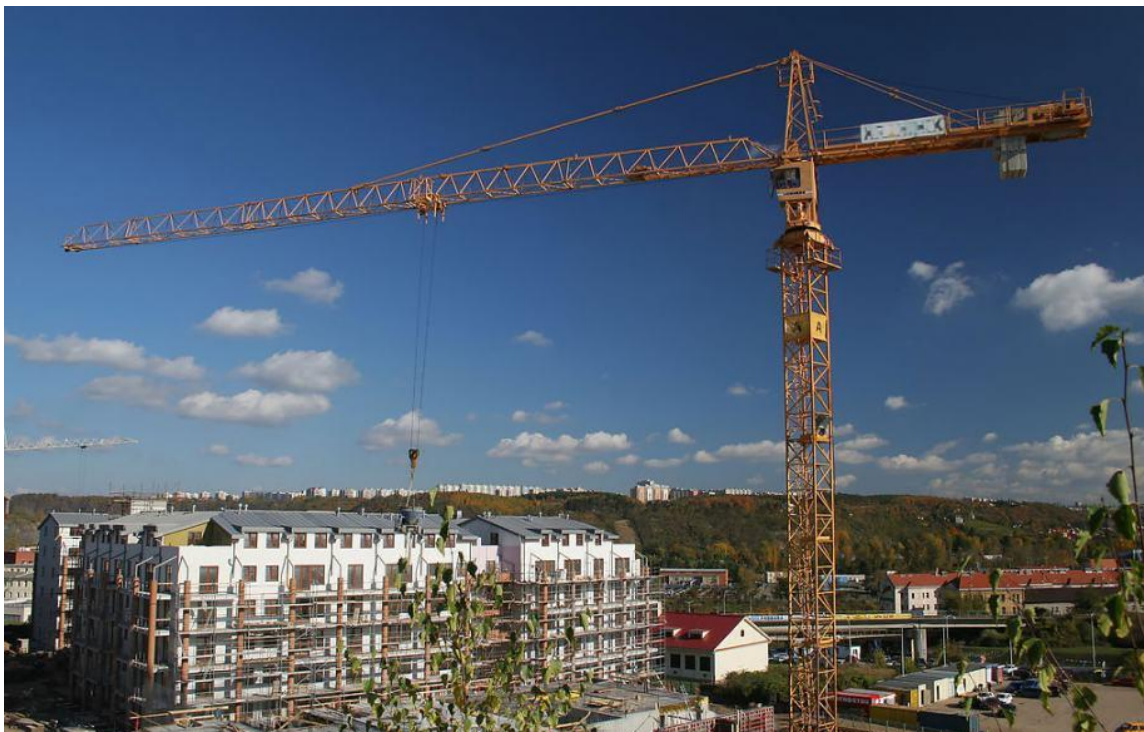
Slika 12. Kran koji svojom veličinom pokriva cijelo gradilište

Toranjska dizalica na nepomičnoj osnovi mora moći pokriti od svoje fiksne pozicije sve točke na koje moramo prenositi terete (slika 12).