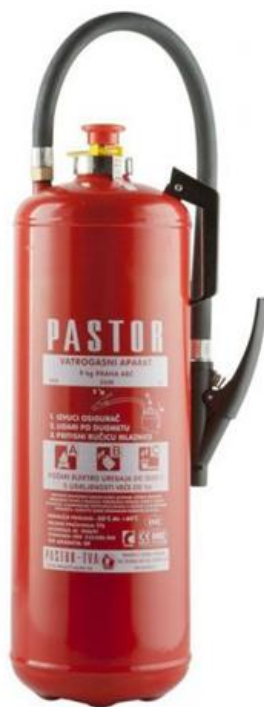
Slika 15. Protupožarni aparat S9 (9kg praha)

Na gradilištu trebaju biti postavljena sredstva za početno gašenje požara, moraju se nalaziti minimalno 2 komada S9 aparata (slika 15).