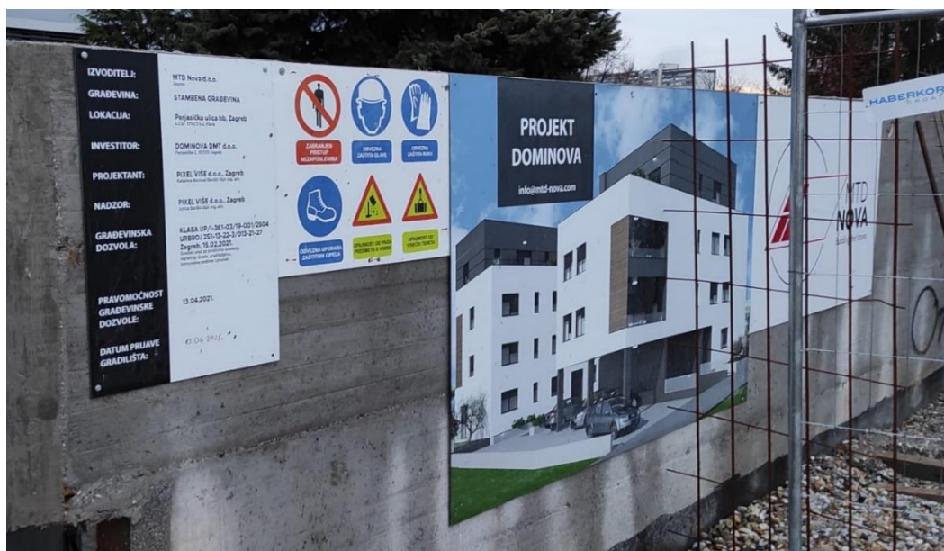
Slika 1. Gradilišna ploča s osnovnim pravilima sigurnosti