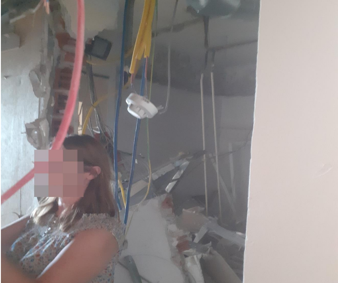
Slika 23. Vanjski suradnik na gradilištu bez zaštitne opreme