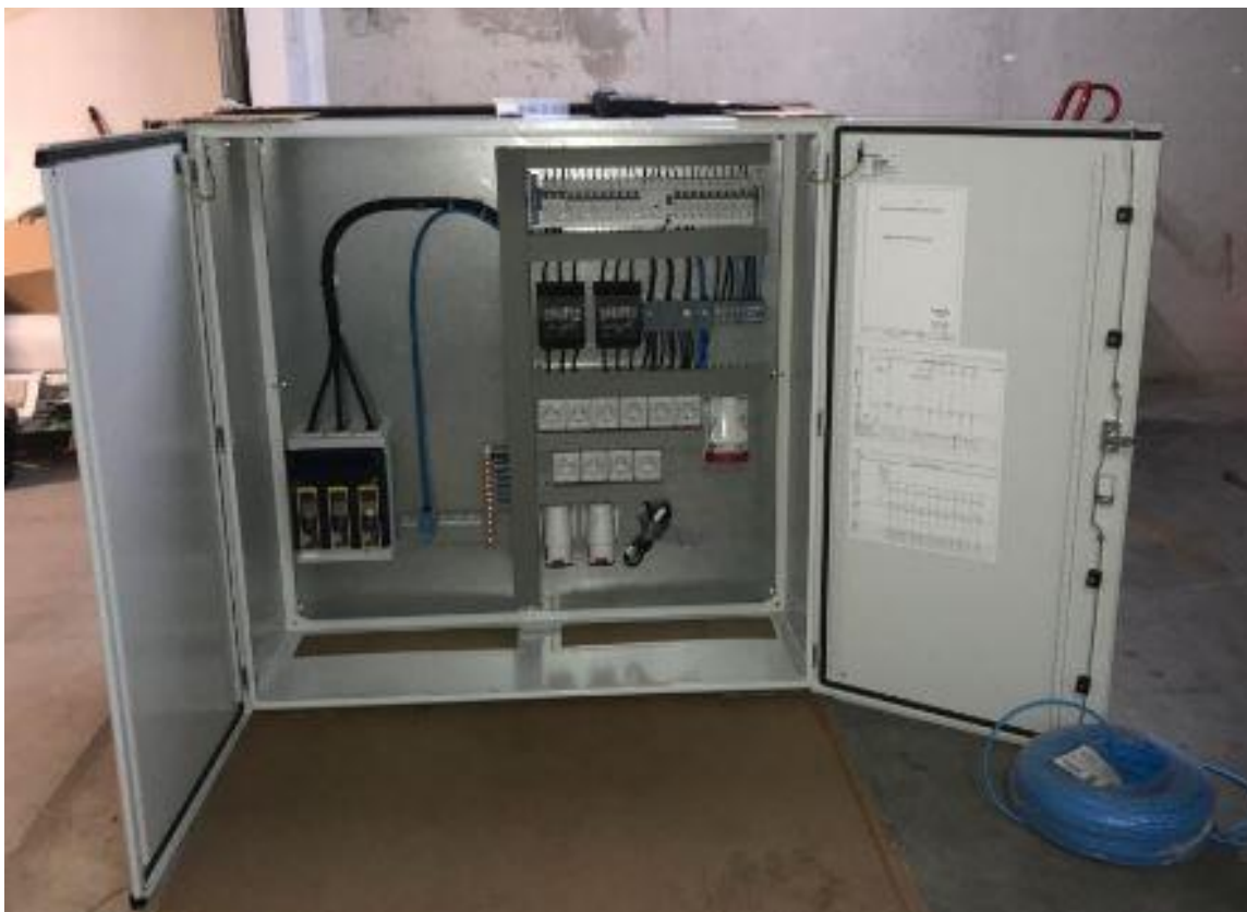
Slika 9. Glavni razvodni ormar za gradilište

Električna instalacija na gradilištu, prije puštanja u rad, mora biti ispitana od strane ovlaštene tvrtke i imati isprave o ispitivanju te se periodički treba ispitivati svakih 6 mjeseci. Strojevi i uređaji za rad koji koriste električnu energiju, moraju biti priključeni standardnim napravama (kablovi i utičnice) u skladu s tehničkim propisima na priključne ormariće. Fiksno postavljena električna trošila na gradilištima moraju imati najmanje zaštitu IP44. Električni kablovi i priključci moraju biti tako postavljeni ili zaštićeni da ne može doći do mehaničkih oštećenja. Trebaju biti podignuti u zrak 6 m ili ukopani u zemlju i zaštićeni od mehaničkih oštećenja. Ukoliko vozila moraju proći ispod električnih vodova, moraju se postaviti odgovarajuće upozoravajuće oznake i viseće zaštite. Slobodni električni vodovi ili kabeli na gradilištu moraju biti položeni tako da ne postoji opasnost od njihovog mehaničkog oštećenja ako su položeni iznad tla. Visina mora biti označena i dovoljna da zadovolji gabarite prolaza vozila koji dolaze ili se kreću gradilištom [8]. Električni uređaji (sklopke, elektromotori i drugo) smješteni na slobodnom prostoru, moraju biti zaštićeni od atmosferskih nepogoda [2].