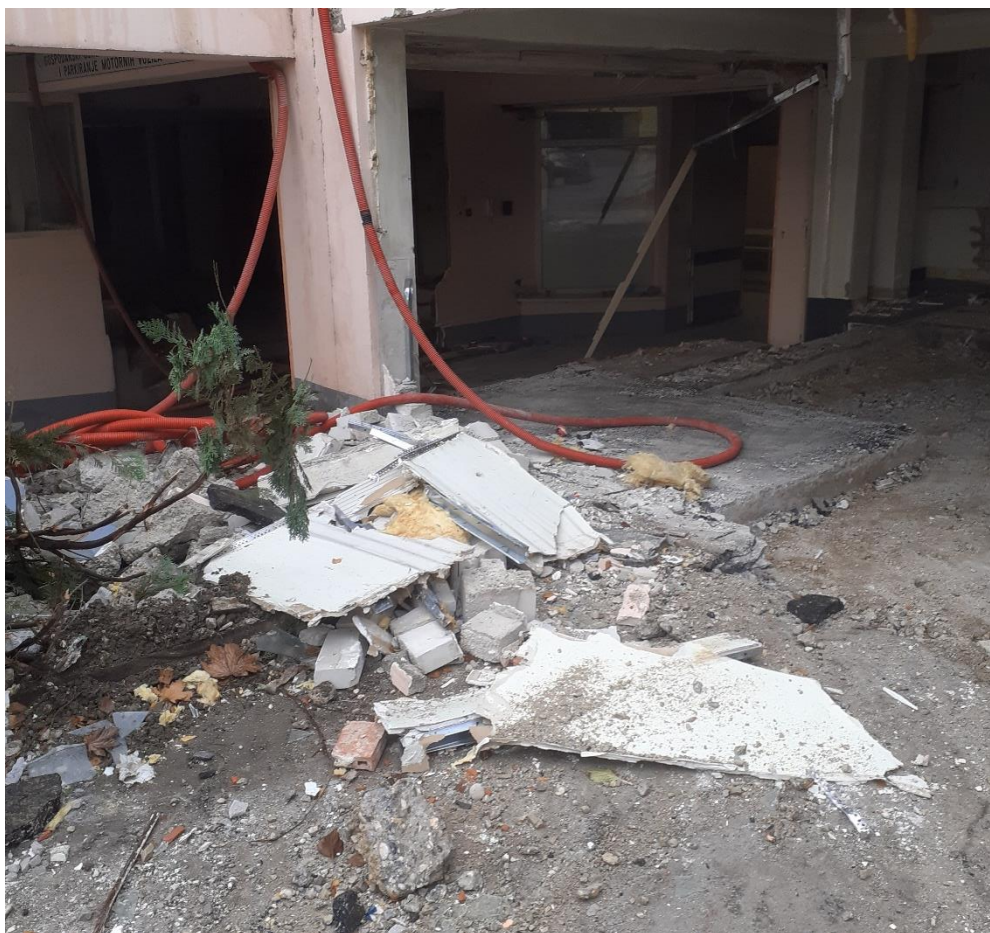
Slika 17. Šuta oko zgrade

Prilikom izvođenja radova na gradilištu potrebno je uvažavati i primjenjivati opća načela prevencije propisane Zakonom o radu. Prilikom posjete gradilištu uvidjela sam niz nedostataka koji ne zadovoljavaju niti opća načela prevencije. Održavanje primjerenog reda i zadovoljavajuće čistoće na gradilištu nisu zadovoljili (slika 17).