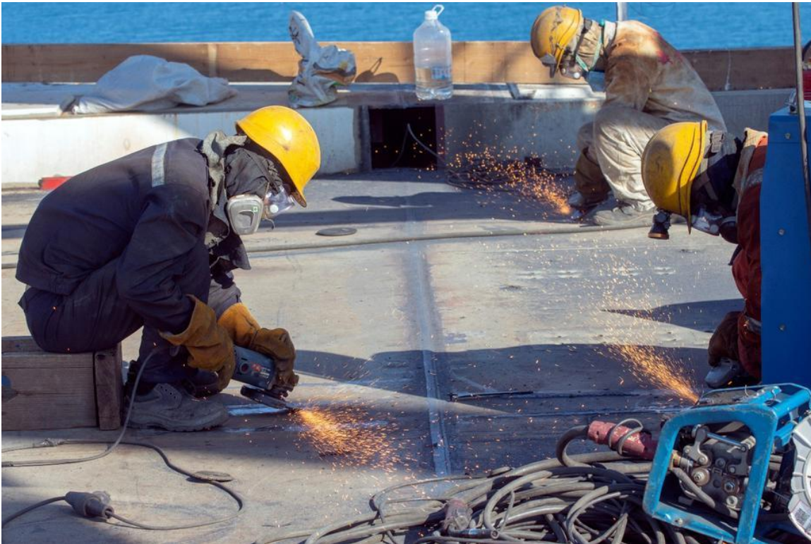
Slika 7. Zavarivanje na gradilištu

Spaljivanje otpadnog materijala (ambalaže, krpe, drveta i sl.) na gradilištima je najstrože zabranjeno i potrebno je materijale odlagati za to predviđena mjesta [1].