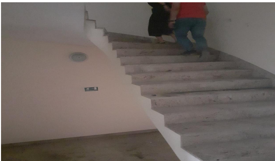
Slika 21. Stepenice bez ograde

Vidljivi problem, koji je također lako mogao završiti tragično za radnike koji su nosili terete na sedamnaesti i viši kat, bio je taj što stepenice nisu imale nikakvu ogradu (slika 21).