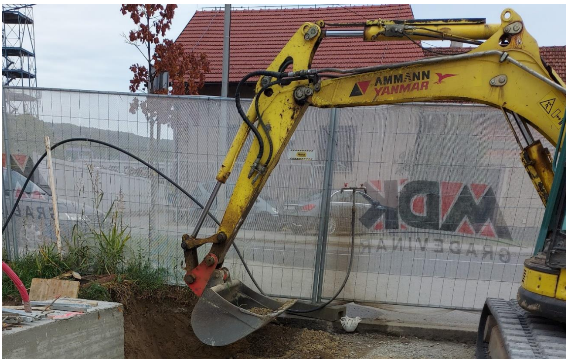
Slika 10. Privremeni priključak za vodu izveden za potrebe gradilišta