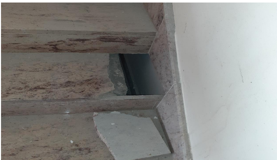
Slika 19. Rupa na stepenicama