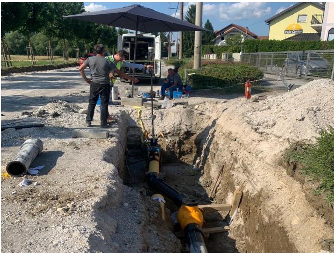
Slika 11. Izvođenje priključka plina na gradilište

Postupak se nešto razlikuje za veće objekte. Za priključak kod građenja većih objekata potrebno je pribaviti lokacijsku dozvolu. Zahtjev za priključenje podnosi Investitor priključka ili njegov ovlaštenik. Građenje priključka izvode ovlašteni izvođači plinskih priključaka i instalacija ili operator distribucijskog sustava, ovisno o odluci Investitora priključka ili njegova ovlaštenika. Iznimno pri višestrukim priključenjima pri čemu sve priključke izvodi operator distribucijskog sustava ili ovlašteni izvođač odabran od strane operatora distribucijskog sustava. Prije početka svih aktivnosti priključenja Investitor priključka ili njegov ovlaštenik dužan je operatoru distribucijskog sustava dati na korištenje zemljište ili dijelove građevine potrebne za izvedbu priključka te dostaviti suglasnost vlasnika drugih zemljišta u slučaju da je priključak moguće izvesti samo korištenjem istih. Izvođenje bilo kakvih radova vezanih za plin od strane radnika strogo je zabranjeno. Korištenje plina pri radu smatra se opasnim poslom i rukovanje treba obavljati stručna osoba koja je prošla osposobljavanja za radove s posebnim uvjetima te pritom koristiti posebnu zaštitnu opremu.