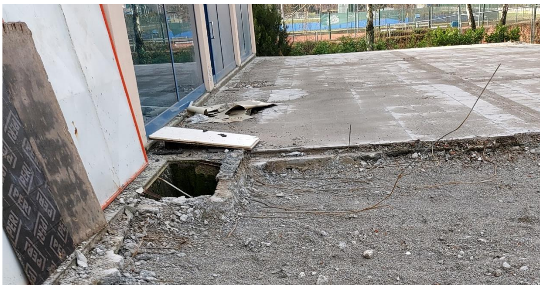
Slika 18. Rupa koja nije uočljivo označena

Putevi oko zgrade gdje radnici prolaze su zakrčeni šutom koja je bacana posvuda te tek nakon nekoliko dana očišćena. Nažalost, u ne tako malom broju gradilišta prilikom pregleda vidljivo je da se ne održava čistoća i urednost na gradilištu. Zbog neurednosti radnih površina, ostavljanja alata na prolaznim putevima, loših uvjeta za rukovanje opasnim materijalima i dr. često dolazi do manjih ozljeda na radu. Jedan od nedostataka također je bio što rupa na okolnom putu gdje su svakodnevno prolazili nije bila obilježena niti PVC trakom niti zastavicom da bude lako uočljiva (slika 18,19).