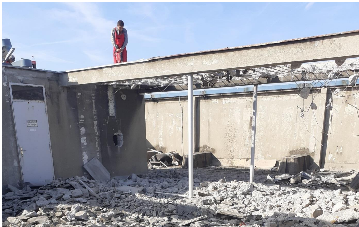
Slika 22. Radnik stoji na napola napukloj armaturi tijekom rušenja

Jedan od problema pri radu je bio i taj da radnici nisu imali nikakve zaštitne ograde, dizalice niti pojaseve koji bi ih zaštitili pri radu na visini tijekom razbijanja betona (slika 22).