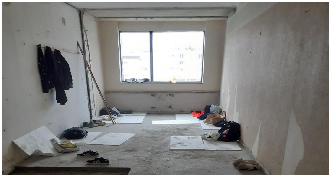
Slika 20. Stvari od radnika na podu

Pripremno uređenje gradilišta treba biti od velike važnosti jer time osiguravamo minimalne uvjete rada kao što je npr i prostorija za radnike. Doći na gradilište i vidjeti kako radnici svoje stvari ostave u praznoj prostoriji na podu dovodi do pitanja da li onda i ručak obavljaju tako (slika 20). Izgradnja i uređenje prostorija za radnike treba biti među prvim aktivnostima nakon dolaska na gradilište.