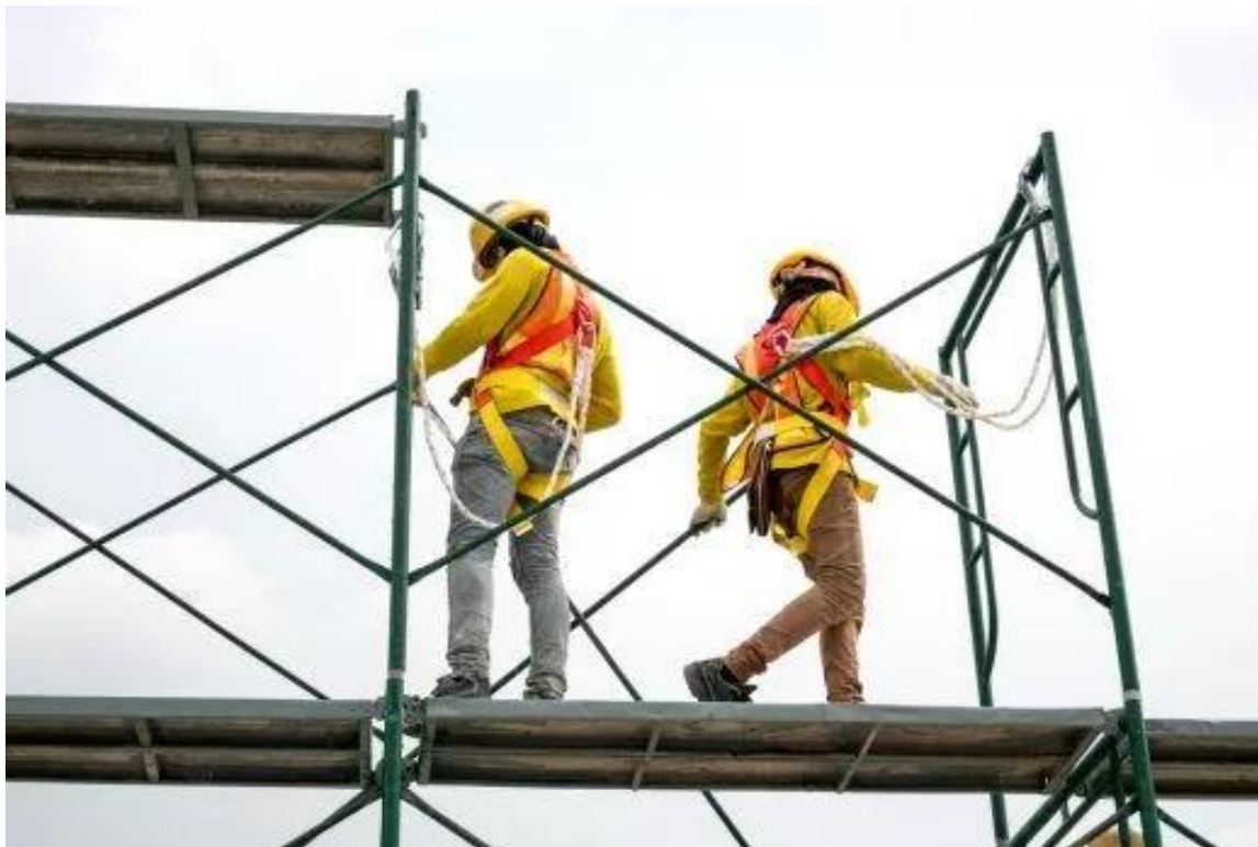
Slika 14. Radnici na skeli sa zaštitnim pojasom

Ovisno o objektu i vrsti radova izvođač određuje koji način se skela izvodi prema složenosti konstrukcije koje se dijele u tri klase složenosti [5].