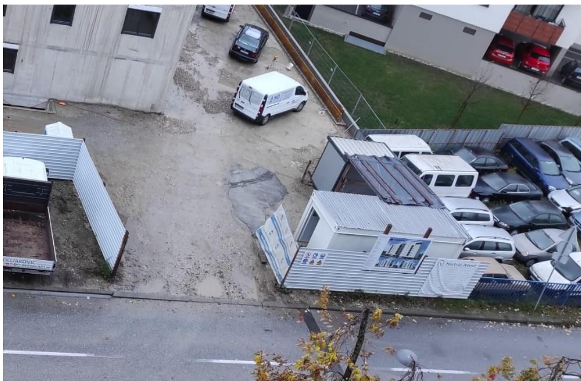
Slika 16. Gradilišni kontejneri s uredom i prostorijom za odmor radnika

prostori za smještaj, ako je to potrebno, moraju biti odvojeni za muškarce i žene. U prostorijama za odmor i/ili prostorijama za smještaj moraju se poduzeti prikladne mjere za zaštitu nepušača od duhanskog dima. Većina poslodavaca radnicima ne osiguravaju mjesta za odmor tijekom rada te sam tako i sama imala mogućnost vidjeti kako radnici za vrijeme pauze sjede na otvorenom prostoru, pod time podrazumijevam pod, te ručaju. Ovakvi uvjeti nisu niti malo humani i zbog takvih stvari inspekcije trebaju biti strože i češće kako bi se radnicima osigurali osnovni uvjeti [5].