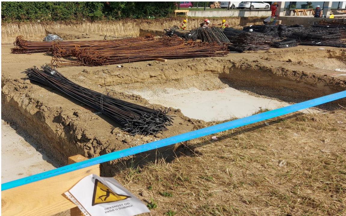
Slika 4. Materijal pripremljen za ugradnju

Raspoznavanjem vrste materijala na gradilištu uvelike olakšava razvrstavanje i smještaj kako bi bili pristupačni i razvrstani radnicima za korištenje. Kada se materijal ugrađuje on se razvrsta za automatsko korištenje kako bi se radnicima približio te time i smanjila udaljenost od materijala do ugradnje (slika 4).