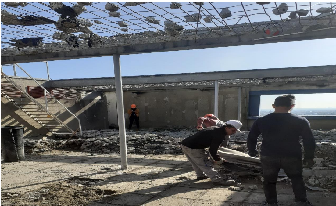
Slika 24. Radnik bez šljema na glavi

Materijal koji visi na armaturi, a viđeno je da otpada s vremena na vrijeme, nije osiguran niti otklonjen do kraja, no veća pogreška je što radnici po gradilištu hodaju bez šljema na glavi (slika 24).