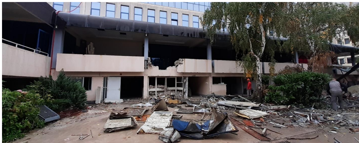
Slika 8. Neoznačeni radni prostor gdje se spušta otpadni materijal

Mjesta s povećanim opasnostima nastaju prilikom izvođenja radova na više nivoa te kod radova na visini ili dubini kao i kod uporabe strojeva na motorni pogon. Na mjestima gdje se podiže teret na veći nivo treba postaviti ploču upozorenja “Opasnost od visećeg tereta”. Iskop na gradilištu mora biti ograđen sa strane s koje se pored njih prolazi. Sva opasna mjesta na gradilištu moraju biti obilježena postavljanjem žice ili špage na kolčiće i vješanjem zastavica uočljivih boja. Svaki rad unutar opasne zone zabranjen je bez posebnog naloga sve dok se ne provedu posebne mjere sigurnosti [3]. Radne zone gdje se obavlja spuštanje otpadnog materijala treba označiti sigurnosnim znakovima opasnosti od pada predmeta s visine i zabrane pristupa (slika 8). Na iste načine moraju se obilježiti radne zone pri montaži i demontaži opreme. Voditelj gradilišta mora voditi i nadgledati da su sigurnosne oznake postavljene u dovoljnim količinama te izdati nalog za nabavu svih potrebnih dodatnih oznaka. Na samom ulazu na gradilište potrebno je postaviti odgovarajuću prometnu signalizaciju te ploču skupnih obveznih znakova za privremena gradilišta.