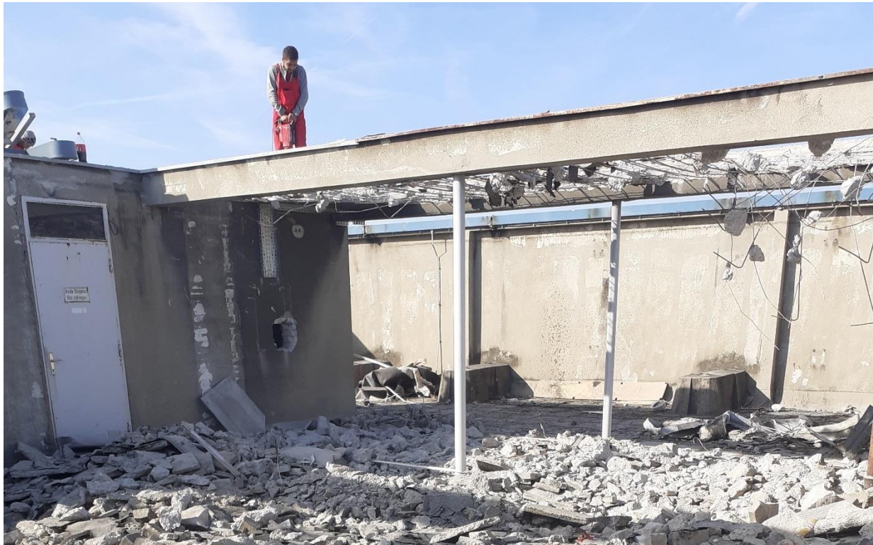
Slika 22. Radnik stoji na napola napukloj armaturi tijekom rušenja

Jedan od problema pri radu je bio i taj da radnici nisu imali nikakve zaštitne ograde, dizalice niti pojaseve koji bi ih zaštitili pri radu na visini tijekom razbijanja betona (slika 22).