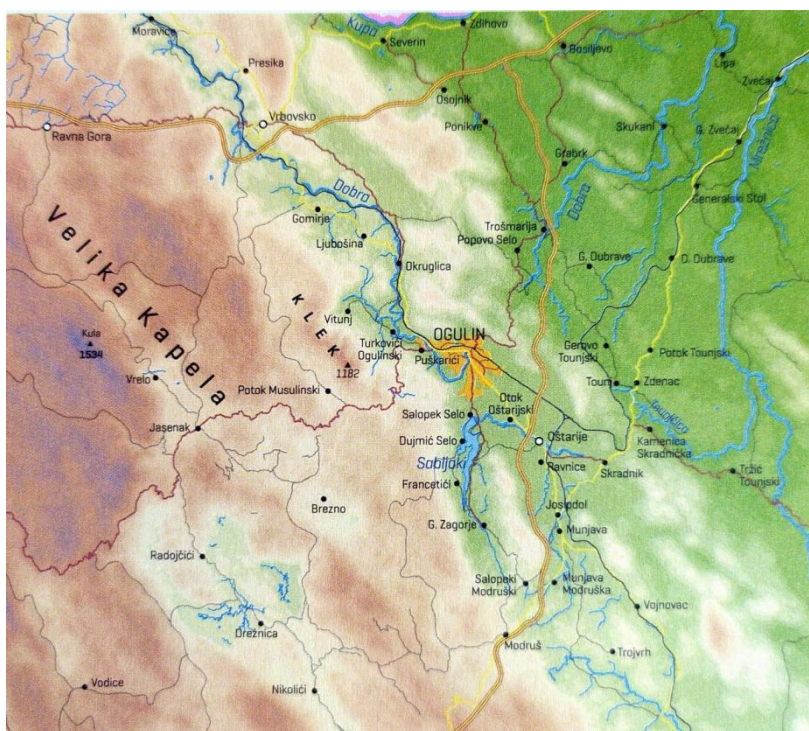
Slika 7: Dobransko-ogulinski prostor