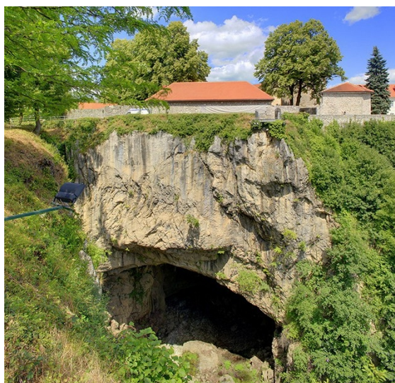
Slika 8: Đulin ponor