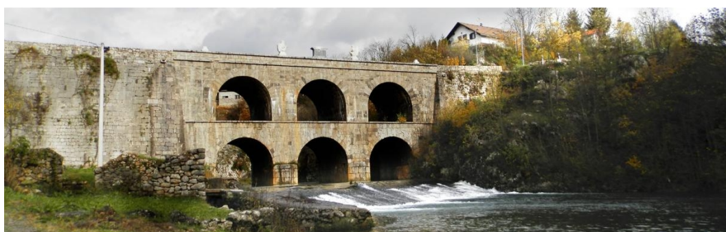
Slika 10: Jozefinski most