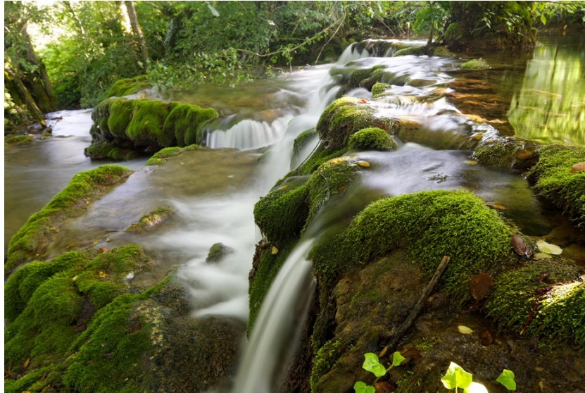
Slika 6: Sedreni slapovi rijeke Mrežnice