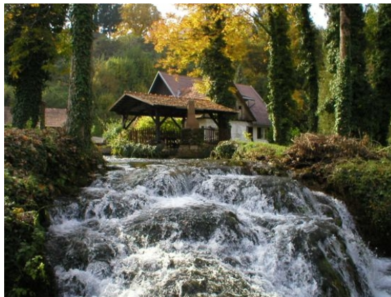
Slika 9: Rastoke