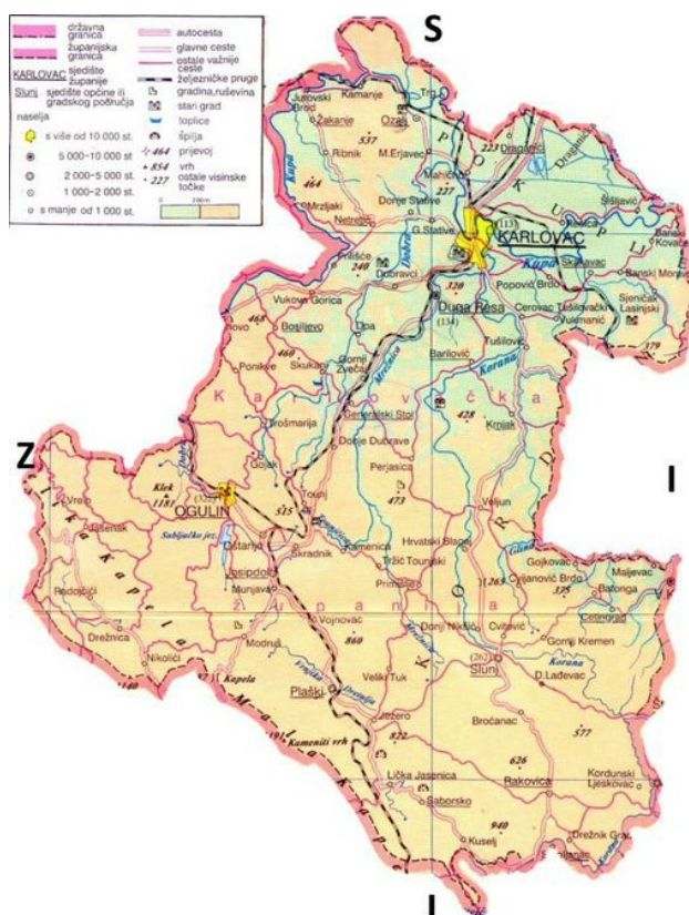
Slika 1: Prikaz reljefa Karlovačke županije