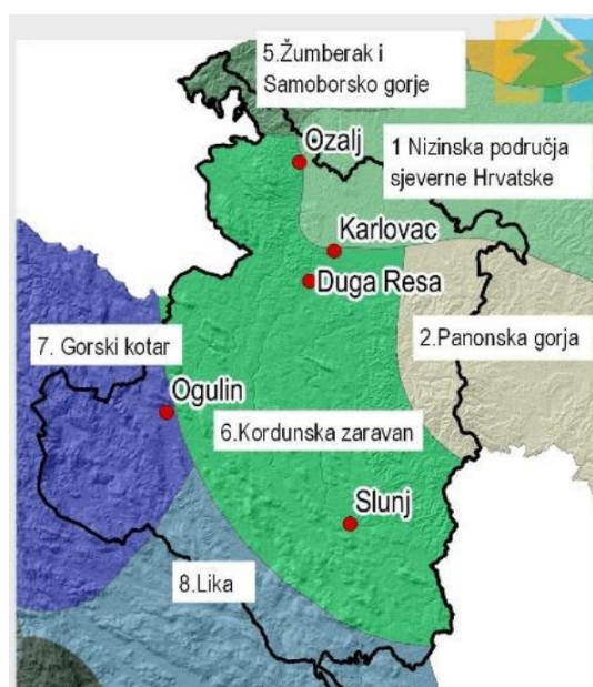
Slika 3: Krajobrazne jedinice Karlovačke županije