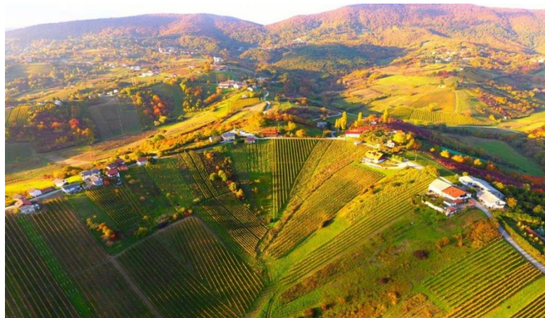
Slika 4: Vinogradi na Plješivici