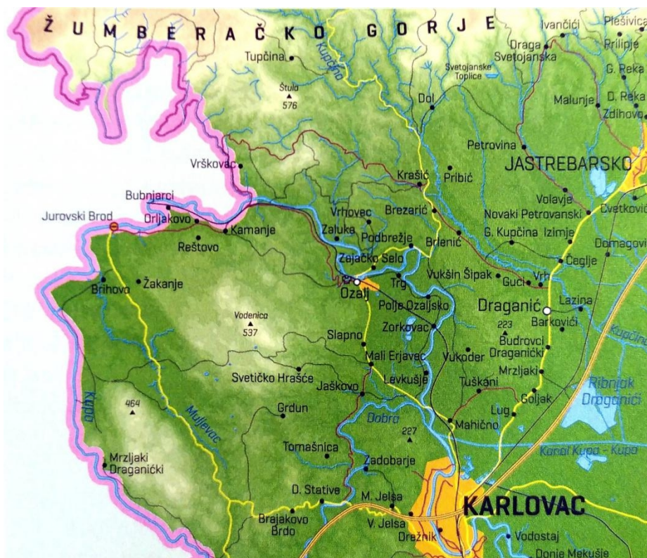
Slika 5: Sjeverno krško Pokuplje