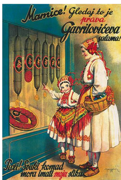
Slika 4. Lik Jelice koji se nalazi na svim proizvodima [4]

1926. rad u tvornici i dalje cvjeta, a godišnje se proizvodilo 60 vagona salame, 20 vagona masti i 5 vagona konzervi. Prema liku trogodišnje Jelice Cekuš, sestrične Đure Gavrilovića starijeg, u Beču je izrađen zaštitni znak tvornice Gavrilović. Jelica je odrastala s tvornicom i od malih nogu grickala čvarke i salame. Grafičko rješenje Jelice, koja u ruci drži Zimsku salamu, 1931. godine osmislio je Andrija Maurović, jedan od najvećih hrvatskih crtača stripova. Lik Jelice se od tada pa do danas nalazi na svim Gavrilovićevim proizvodima.