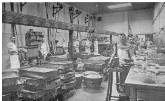
Slika 8. nekadašnji pogon u Tvornici Gavrilović