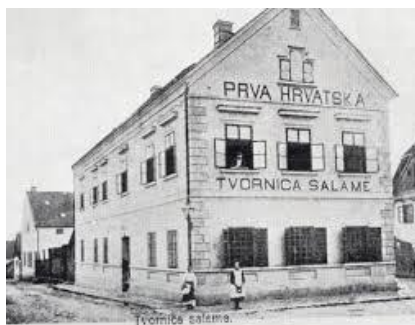
Slika 2. Prva hrvatska tvornica salame [2]

Prva hrvatska tvornica salame, sušena mesa i masti potiskuje stranu konkurenciju svojim vrsnim proizvodima koje prodaje u Ugarskoj, Njemačkoj, Bosni, Švicarskoj, Maloj Aziji, Palestini i Egiptu.