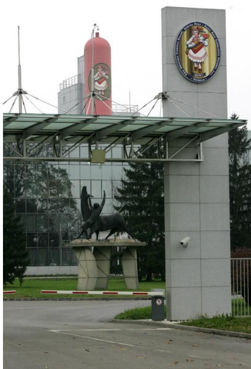
Slika 5. Tvornica Gavrilović [5]

Među Gavrilović specijalitetima nalazi se Gavrilovićeva salama La vrste , Planinska salama , Milanska salama , Mortadela La vrste i nova Jetrena pašteta . 1945. godine kada je Drugi svjetski rat završio tvornicu su oduzeli i ona je postala društvenim vlasništvom. Obitelj Gavrilović odlazi u emigraciju. 1952. godine Gavrilović ponovo izvozi u Njemačku, Austriju, Italiju, Čehoslovačku i Veliku Britaniju. 1956. godine otvorena je nova, moderna tvornica te se 1968. godine na poziv uprave tvornice koja je ponovo preuzela ime „Gavrilović“, Đuro II Gavrilović vraća kao tehnički savjetnik. Iste godine na Zagrebačkom velesajmu, zlatnom medaljom nagrađene su Gavrilović salama, buđola, Petrinjske kobasice, frankfurtske kobasice, Gavrilovićeva pašteta i goveđi gulaš. 1991. Đuro III. Gavrilović kupuje „Gavrilović“ iz stečaja, a 1995. godine ponovo je uspostavljena proizvodnja u pogonu u Petrinji.