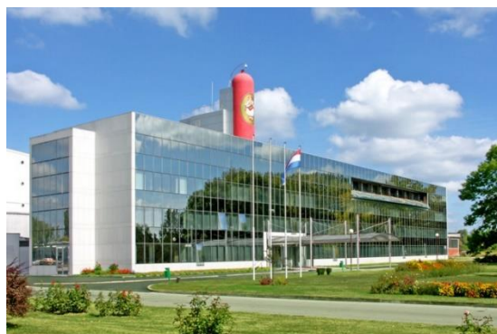
Slika 6. Tvornica Gavrilović danas [6]