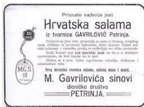
Slika 3. Dio članka iz novina [3]

1926. rad u tvornici i dalje cvjeta, a godišnje se proizvodilo 60 vagona salame, 20 vagona masti i 5 vagona konzervi. Prema liku trogodišnje Jelice Cekuš, sestrične Đure Gavrilovića starijeg, u Beču je izrađen zaštitni znak tvornice Gavrilović. Jelica je odrastala s tvornicom i od malih nogu grickala čvarke i salame. Grafičko rješenje Jelice, koja u ruci drži Zimsku salamu, 1931. godine osmislio je Andrija Maurović, jedan od najvećih hrvatskih crtača stripova. Lik Jelice se od tada pa do danas nalazi na svim Gavrilovićevim proizvodima.