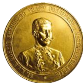
Slika 1 . Zlatna kolajna s likom nadvojvode Franza Ferdinanda [1]