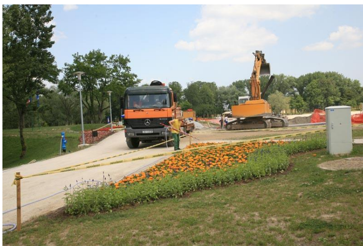
Slika 3. Uređivanje zelenih površina

Izgradnja i rekonstrukcija zelenih površina i dječjih igrališta u nadležnosti je Sektora uređenja zelenih površina podružnice Zrinjevac. Sektor je opremljen i osposobljen za izvođenje najsloženijih radova u hortikulturi i niskogradnji. Uz radove na krajobraznom uređenju novih i rekonstrukciji postojećih zelenih površina, izvode se cjelokupni radovi izgradnje dječjih igrališta, sportsko-rekreacijskih terena i njihova sanacija.