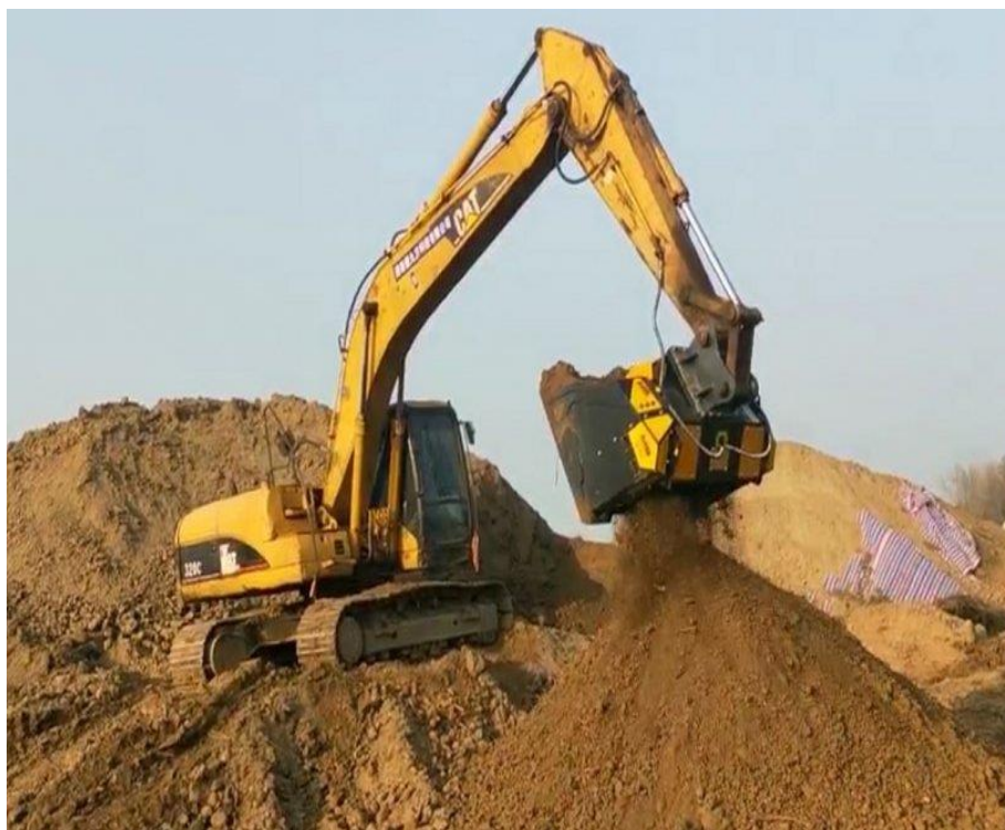
Slika 8. Rad s buldožerom

Buldožerom mogu rukovati osobe starije od 18 godina koje su kvalificirane i upućene u rukovanje i održavanje stroja. U pogon se smije staviti tek kad se provjeri jesu li zaštitne naprave na mjestu i ispravno postavljene i je li prostor oko buldožera slobodan.