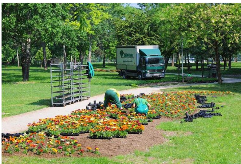
Slika 6. Rad s kamionom

Radno mjesto vozač kamiona mora imati KV stupanj stručne spreme, radno iskustvo u vožnji kamiona, te biti osposobljen za rad na siguran način na temelju utvrđenih vrsta i opsega opasnosti koje proizlaze iz vrste tereta i namjene motornog vozila. U povremene poslove ubrajaju se popravci kamiona i kamionske kompozicije s hidrauličnom dizalicom. Prije utovara i istovara tereta moraju se prethodno pregledati mjesta rada i otkloniti eventualni nedostaci koji bi mogli ugroziti sigurnost radnika na radu. Prije početka utovara tereta u prijevozno sredstvo i istovara tereta iz prijevoznog sredstva, moraju se poduzeti sve potrebne radnje kojima se sprečava da se prijevozno sredstvo pomiče s mjesta na kome je zaustavljeno odnosno privezano. [10]