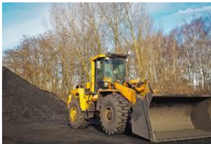
Slika 12. Rad s buldožerom

Procjena rizika rada i opasnosti postoje u radu s buldožerima jer njihovo radno mjesto se nalazi na nepristupačnim površinama. Buldožer se ne smije približavati rubu kosine s podignutim nožem kako ne bi nastalo prevrtanje i pad buldožera. Pri guranju materijala do ruba nasipa treba unaprijed odrediti udaljenost noža od ruba nasipa na koju se buldožer smije približiti. Udaljenost ovisi o vrsti materijala, visini i nagibu kosine, težini te ostalim tehničkim obilježjima buldožera. [13]