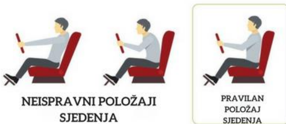
Slika 10. Neispravan/pravilan sjedenja za volanom

Budući da vozači svoje radno vrijeme provode većinom u sjedećem položaju, pa to uzrokuje čestu opterećenost kralježnice a samim tim uzrokuje zdravstvene probleme kralježnice. Zbog dugotrajnog sjedenja i problema s kralježnicom u konstrukciji kamiona pridaje se velika važnost ergonomski oblikovanim sjedalima što znatno smanjuje tjelesno opterećenje i umor.