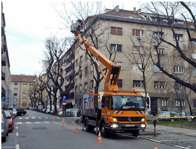
Slika 7. Rad s hidrauličnom dizalicom

Prije nego se počne raditi treba provjeriti sve dijelovi hidrauličke dizalice kao što su uređaji za upravljanje dizalicom, stabilizatori za podupiranje vozila, odgovarajući sigurnosni ventili, pribor za dizanje tereta te jesu li sigurni. Vozilo s dizalicom mora biti postavljeno na stabilno i ravno tlo, a kotači osigurani od pomicanja.