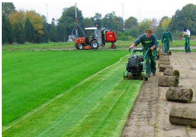
Slika 4. Proizvodnja travnog busena

Sektor mehanizacije i transporta raspolaže velikim voznim parkom i to s kamionima kiperima, tegljačima, bagerima, rovokopačima, utovarivačima, grajferima, vibrovaljcima i dr. U sklopu podružnice nalazi se mehanička radionica koja samostalno održava vozni i strojni park.