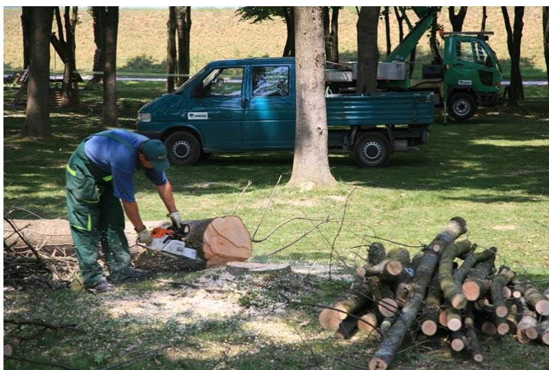
Slika 9. Rad s motornom pilom

Prije uporabe motorne pile za važno je pročitati upute za rad i osigurati područje rada. Pilu treba čvrsto držati dok motor radi te pri rezanju paziti da ne dodirne ogradu, kamen ili neku prepreku. Pri piljenju treba paziti da pilu ne bude previše naprijed ili iznad visine prsiju. Ukoliko su potrebne ljestve ili skele za orezivanje, potrebno ih je dobro učvrstiti i paziti da ne budu nestabilne i na površini koja se može pomjerati. Lanci i vodilice moraju biti specificirani od ovlaštenih proizvođača. Kod punjenja pile gorivom treba odabrati čisto tlo, zaustaviti motor i pustiti ga da se ohladi tek tada se može točiti gorivo. Nakon ulijevanja goriva, radi sigurnosti, dobro pritegnuti čep. Servisiranje motorne pile treba biti redovito i obavljati ga kod ovlaštenih servisera.[14]