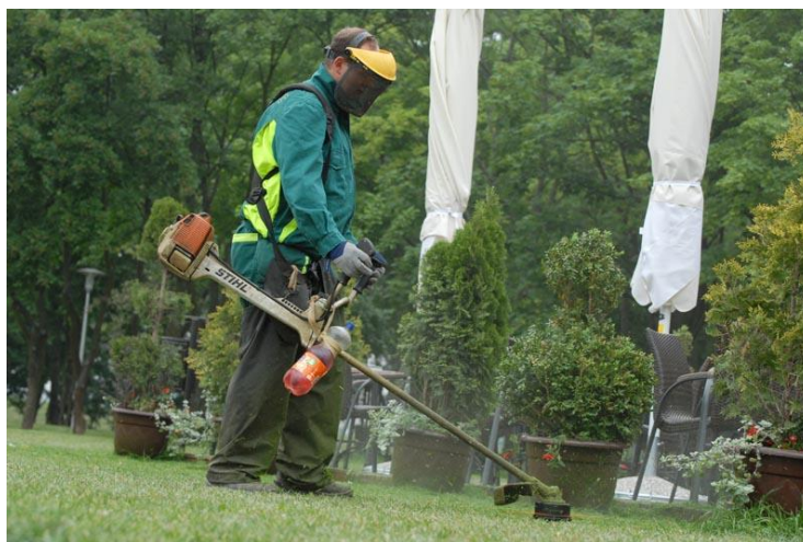
Slika 1. Održavanje zelenih površina - košnja trave

Alati i strojevi koji se koriste za te poslove su: škare s produženim ručkama, motorna kosilica, leđna kosilica, traktor kosilica i drugo.