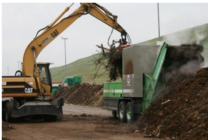
Slika 5. Proizvodnja komposta

Tablica 10. Popis radnih mjesta ili poslova s posebnim uvjetima rada u Sektoru mehanizacije i transporta