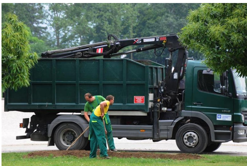
Slika 2. Održavanje javnih površina

Na gradskim površinama Zrinjevac je posadio gotovo pola milijuna komada različitog grmlja i drveća koje je potrebno održavati, što iziskuje korištenje različitih strojeva. Orezivanje drveća koji su visine do 5 m vrši se uz upotrebu običnih ljestvi i motorne pile sa sakupljanjem na hrpe pogodne za utovar i orezivanje stabala se vrši na visini dometa pile na štapu. Orezivanje drveća koje je visine od 5 m do 30 m vrši se uz upotrebu autoplatforme, kрана, dizalice, motorne pile, rezači panjeva.