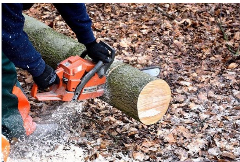
Slika 13. Rad s motornom pilom

Rad s ručnom motornom pilom može procjenom rizika biti utvrđen kao posao s posebnim uvjetima rada. Okolnosti koji utječu na procjenu rizika su buka, vibracije, teško fizičko naprezanje, rad na visini i dr.[17]