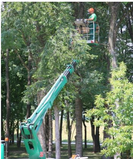
Slika 11. Rad s hidrauličnom dizalicom