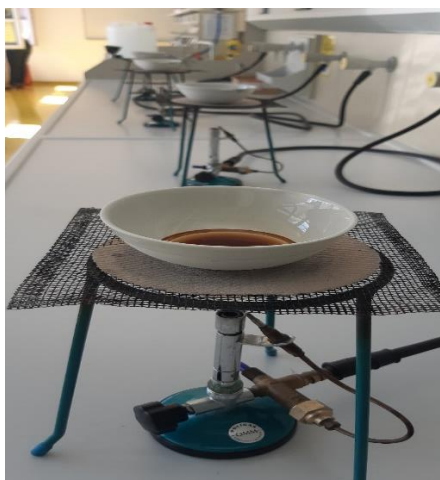
Slika 16 Uparavanje uzoraka na plameniku.

U Erlenmayerovu tikvicu od 250mL staviti 5g mljevene kave, zatim dodati 100 mL destilirane vode, te sve skupa odvagnuti. Sadržaj u tikvici dovesti do vrenja na Bunsenovom plameniku i nastaviti vrenje dodatnih 5minuta. Tikvicu ohladiti, staviti na vagu i dodati destilirane vode do originalne težine. Sadržaj profiltrirati, te upariti 12,5mL filtrata u tariranoj porculanskoj zdjelici. Zdjelicu s uparenim filtratom staviti u sušionik do konstantne mase na 105°C. Odvagom odrediti masu ostatka filtrata u zdjelici.