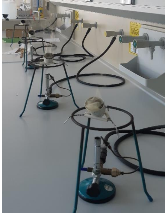
Slika 17 Prikaz karbonizacije u porculanskim lončićima na plameniku.

Karbonizirati 5g mljevene kave u porculanskom lončiću na plameniku. Nakon karbonizacije odnosno dobitka pepela koji ne dimi uzorak staviti u muflonsku peć na 550°C dok se uzorak ne stvori u bijeli pepeo i ne dobije konstantnu masu.