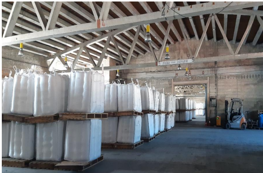
Slika 7 Skladištenje kave u big bag-ovima u luci Rijeka