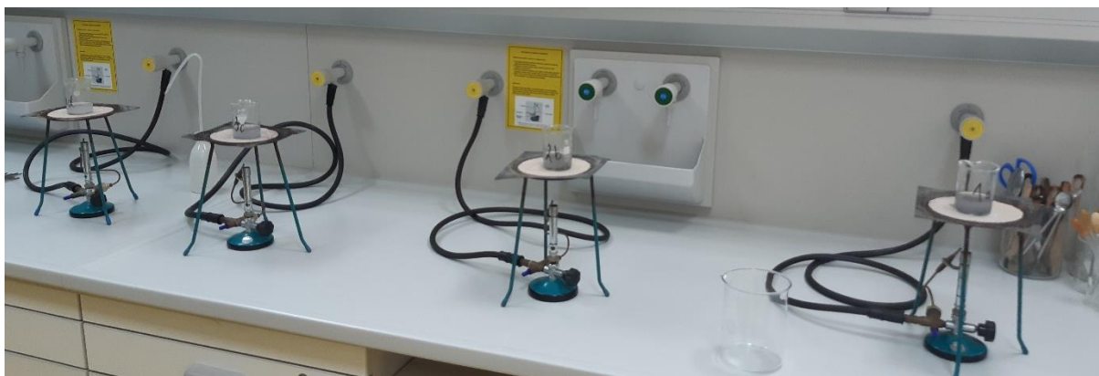
Slika 18 Zagrijavanje dobivenog pepela u vodi do vrenja.