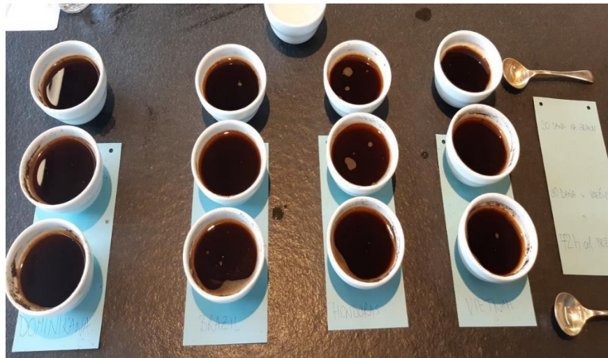
Slika 20 Pripremljeni uzorci za provedbu cupping-a.

Poredaju se iste vrste kave vodoravno jedna do druge, netom prije mljevenja i kuhanja. Bitno je što prije samljeveni uzorak prelići vrućom vodom temperature od 90° do 96°C. Na jednu šalicu stavi se 10g uzorka na 2dcl vode. Samljevena kava prelijeva se prokuhanom vodom kružnim pokretima i ostavi 3 minute. Nakon 3 minute otkloni se kora na kavi (pjena) i kuša. Kušanje se provodi srkanjem kave na temperaturi između od 71°C (maksimalna temperatura da ne opeče) i 21°C da se kava ne ohladi. Navedeno hlađenje se odvija u je vremenskom razdoblju od 10 minuta koje je relevantno vrijeme za kušanje. Nakon što se srkne kava zatvore se usta te se proguta količina usrkane kave i izdahne na nos usrkani zrak. To je nazalna i retronazalna analiza u kojoj se dobiva potpuni doživljaj arome.