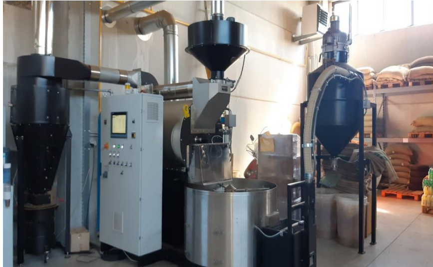
Slika 10 Pržionik u kojem su uzorci prženi.