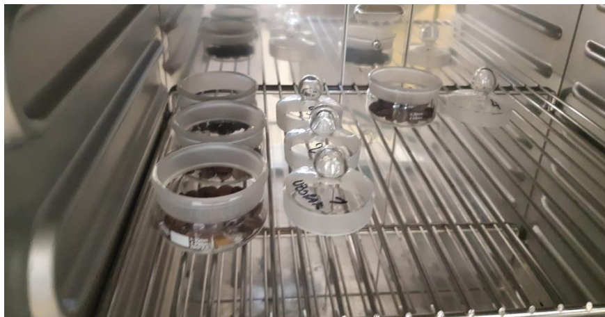
Slika 14 Sušenje posudica s uzorcima kave u sušioniku.

Posušiti posudicu i poklopac posudice kroz 1 sat na 103°C, ohladiti u eksikatoru; a zatim u posudicu sa preciznošću 0,1 mg odvagnuti 5g zrna pržene kave. Sušiti u sušionici na 103°C kroz vrijeme od 4+/- 0,1 sat, ohladiti posudicu sa sadržajem i izvaži posudicu poklopljenu s poklopcem. Za odrediti rezultate potrebno je odrediti dva paralelna mjerenja, te kao konačni rezultat uzeti vrijednost aritmetičke sredine dva provedena određivanja.