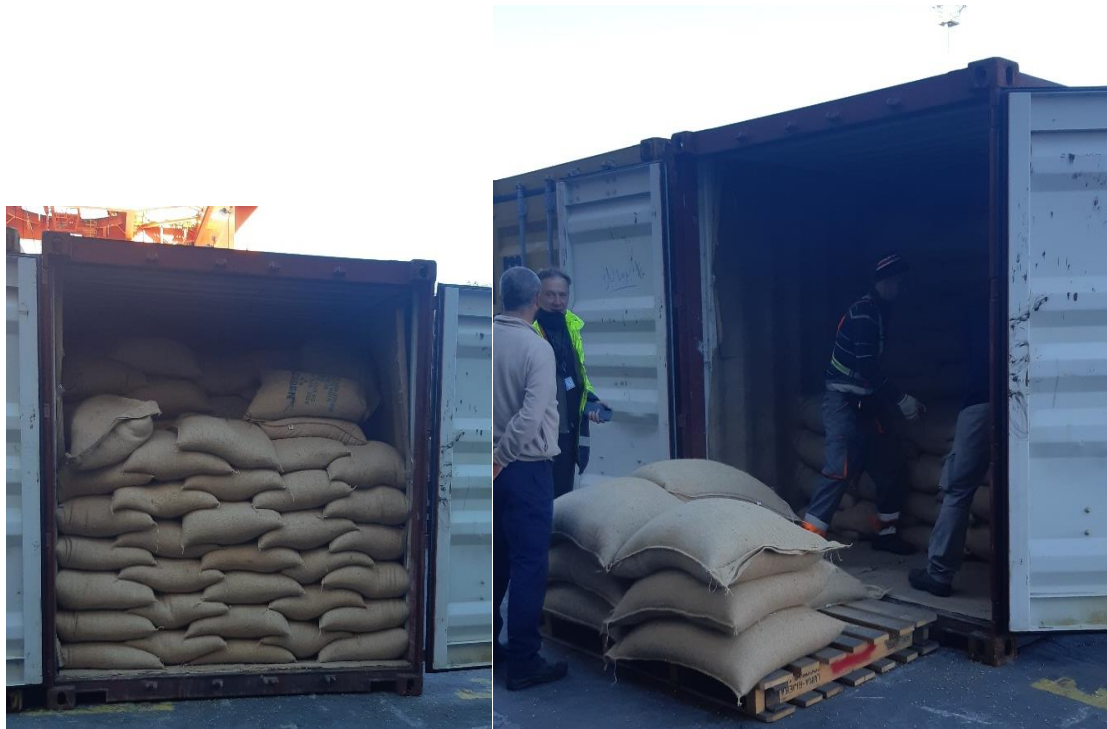
Slika 2 i 3 Prikaz kave u jutanim vrećama tijekom transporta u kontejneru i iskrcaj iste.

Prije svih daljnjih radnji, kava se carini. Prva inspekcija prije otvaranja kontejnera sastoji se od provjeravanja kontejnerskog broja i sadržaja na dokumentima pošiljke.