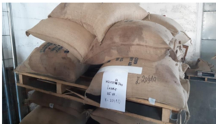
Slika 5 Prikaz uništenih vreća vodom tijekom transporta.

Nakon papirnatih pregleda pošiljke kava se vizualno pregledava zbog toga što se već izgledom preko vreća u kojima dolazi može utvrditi oštećenje; može biti mokra, vreće mogu biti uništene, probušene ili pljesnive. Pri otvaranju kontejnera provjerava se miris zbog mogućnosti da je na putu došlo do kondenzacije zraka i kvarenja kave. Jedan od najčešćih uzroka oštećenja kave vodom su kondenzacija vlage na unutrašnjim stjenkama kontejnera ili vodom koja se infiltrira kroz rupe na stjenkama kontejnera. Ukoliko kava dođe uništena od raznih klimatskih oborina tijekom putovanja, kava se ili uništava ili vraća pošiljatelju. Na samom istovaru i otvaranju kontejnera kava se važe na velikim teretnim vagama i skladišti u prostorima lučkih skladišta dok dobavljač ne dođe po istu. Nekad dok još Hrvatska nije bila dio Europske unije kava se podvrgavala veterinarskim kontrolama fitopatologije u kojima se ispitala kava na razne mikroorganizme propisane Pravilnicima.