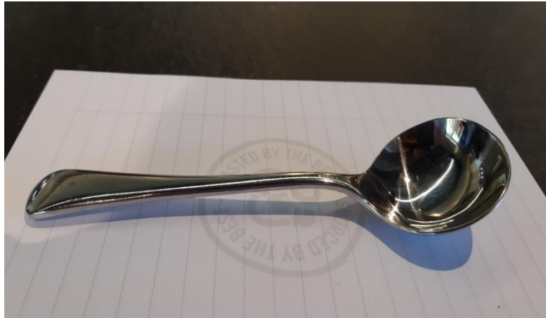
Slika 12 Žlica za senzornu analizu kave

Prilikom ocjenjivanja više uzoraka kave, preporučeno je ispljunuti kavu nakon ocjenjivanja kako bi se spriječilo previsok unos kofeina, te između uzoraka usta isprati vodom.