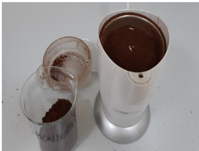
Slika 15 Samljevena kava pomoću kućnog mlinca.

Za određivanje gubitka mase mljevene postupak je isti kao u metodi 1, osim što uzorak treba samljeti. Korišten je kućni mlinac za kavu.