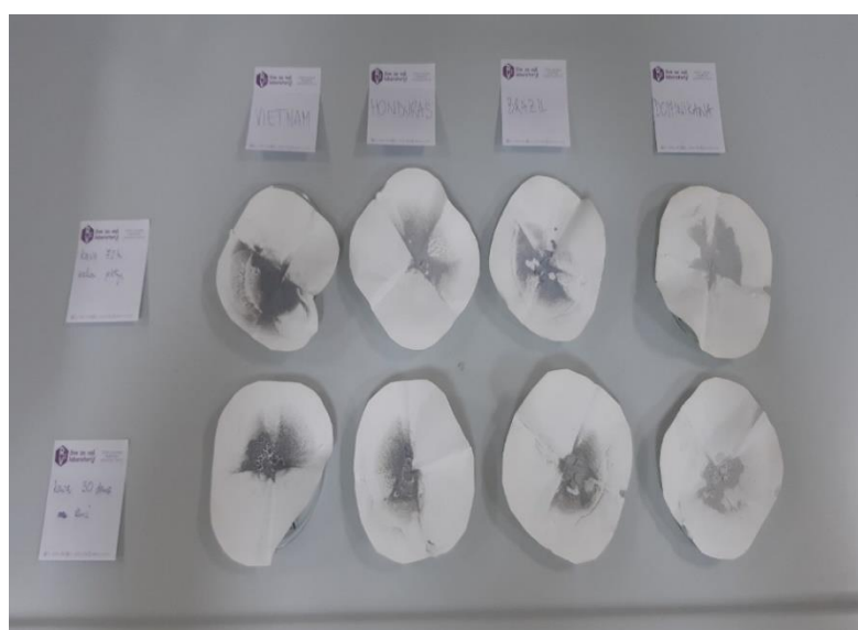
Slika 19 Vodo-netopivi pepeo iz uzoraka.