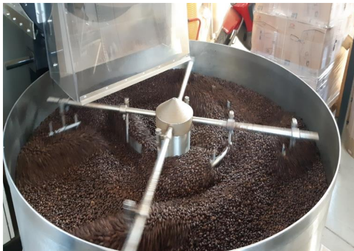
Slika 9 Tamno pržena kava za espresso. Izvor: (fotografija; Katarina Radan)

Na grafu sa slike 8 je vidljivo da udio kiselina raste prženjem dok npr. prirodna gorčina zrna opada i nestaje prženjem. Koncentracija aromatskih spojeva raste, dok se tijelo tek dobiva u procesu prženja.