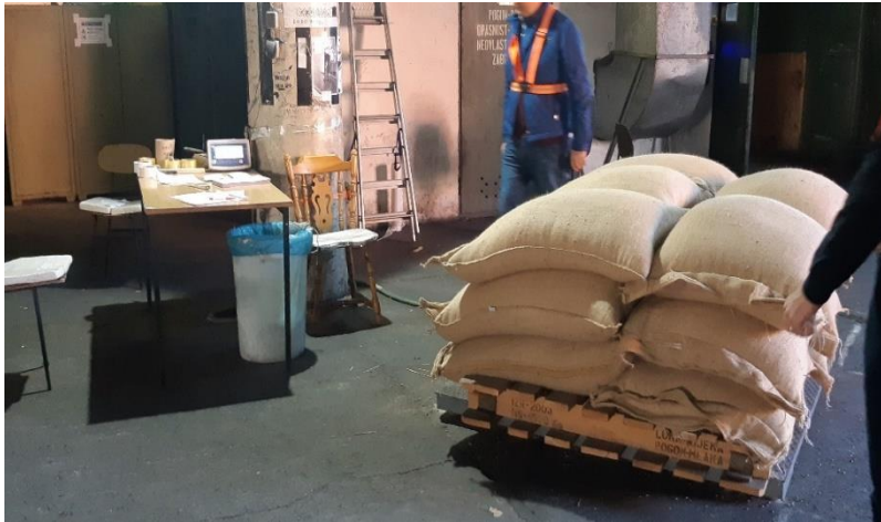
Slika 4 Kontrola mase zaprimljene pošiljke kave.

Nakon toga se provjerava identifikacijski broj vreća koji naravno moraju biti u skladu sa podacima na listi utovara.