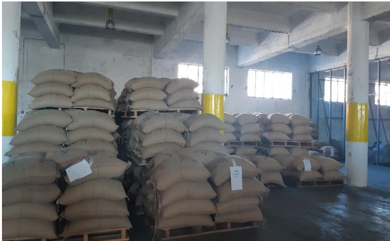
Slika 6 Prikaz skladištenja kave u jutenim vrećama u skladištu luke Rijeka.

Danas nije potreban dodatni pregled fitopatologa pa dobavljač u svom laboratoriju obavlja analize specifičnim metodama kako za sirovu tako i za prženu kavu. Najbitnije provjere dobivene kave su: kontrola mase, kontrola vizualne kvalitete izgleda kavinog zrna, tek poslije kontrola kvalitete okusa te laboratorijske analize pržene kave u svrhu da se utvrdi kvaliteta dobivene kave i one obećane kvalitete u zemlji pošiljatelja. U ovom radu opisane su sve metode laboratorijskih analiza kontrole kvalitete pržene kave.