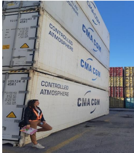
Slika 1 Kontejneri u kojima se doprema kava u Riječku luku.