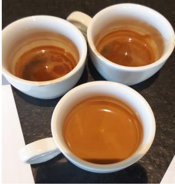
Slika 21 Prikaz espresso uzoraka Vietnam-Robusta.