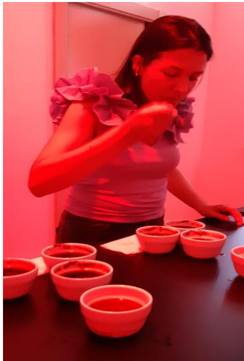
Slika 11 Kušanje kave u prostoriji za senzorsku analizu

Za cupping testiranje potrebna je prostorija u kojoj će se kušati kava. Spomenuta prostorija mora imati osvjetljenje crvenim svjetlom, biti odvojena od buke, imati zidove bijele boje. Temperatura prostorije mora biti oko 22°C, vlaga mora biti ugodna od 50-70% i cijela prostorija mora biti čista, bez ikakvih dodataka na zidovima.