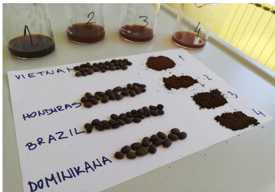
Slika 13 Prženi uzorci u zrnju, meljava i ekstrakt.