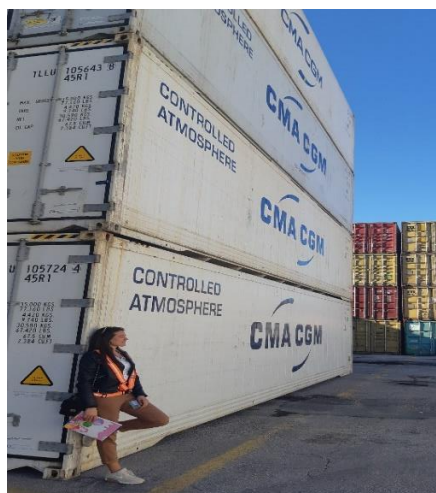
Slika 1 Kontejneri u kojima se doprema kava u Riječku luku.