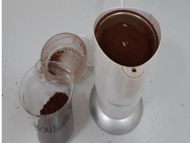
Slika 15 Samljevena kava pomoću kućnog mlinca.

Za određivanje gubitka mase mljevene postupak je isti kao u metodi 1, osim što uzorak treba samljeti. Korišten je kućni mlinac za kavu.