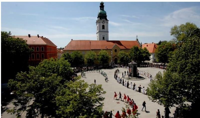
Slika 2. Trg bana Josipa Jelačića, Karlovac