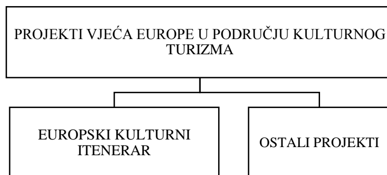
Shema 4. Projekti vijeća Europe u području kulturnog turizma