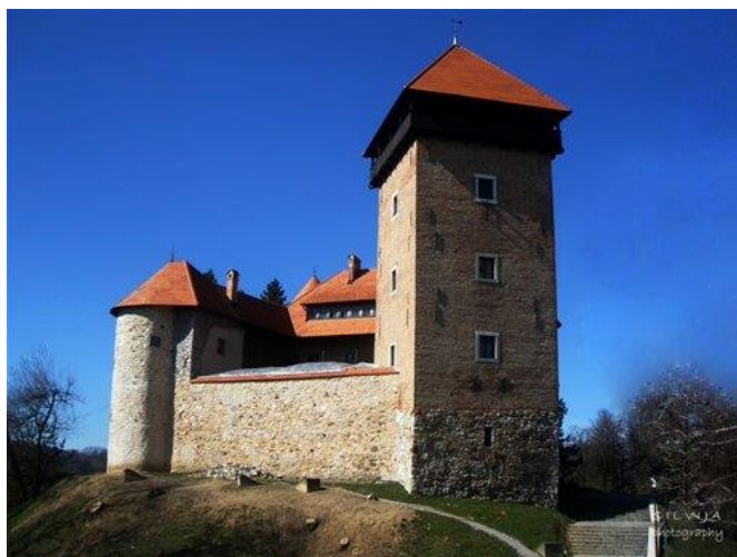
Slika 3. Stari grad Dubovac