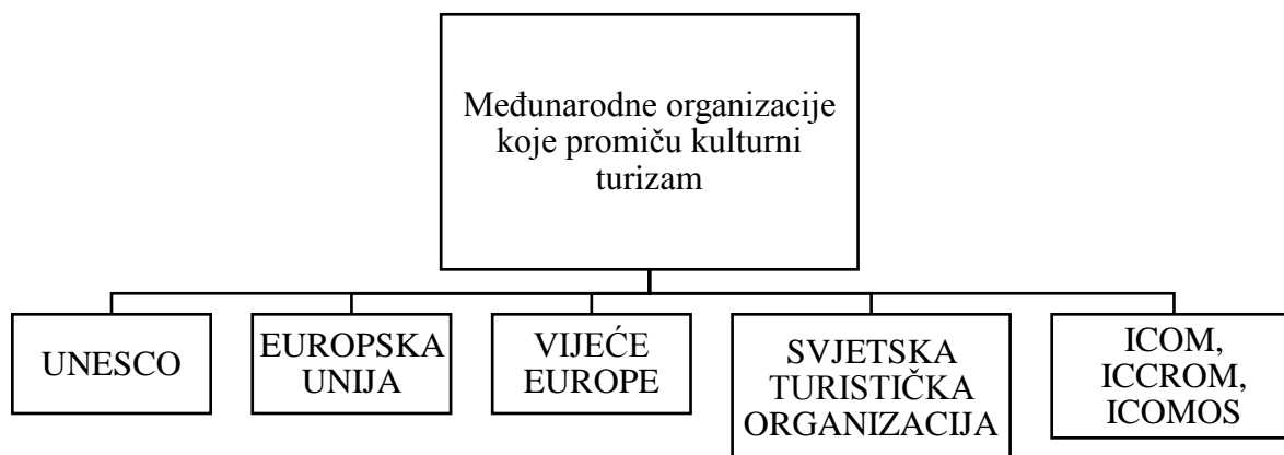
Shema 1. Međunarodne organizacije koje promiču kulturni turizam