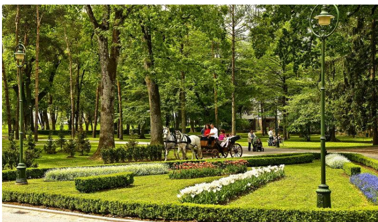
Slika 5. Vrbanićev perivoj