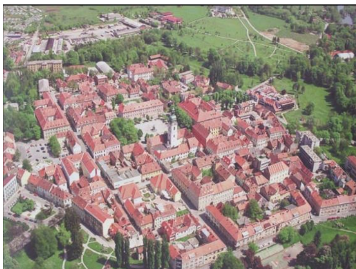
Slika 1. Zvijezda