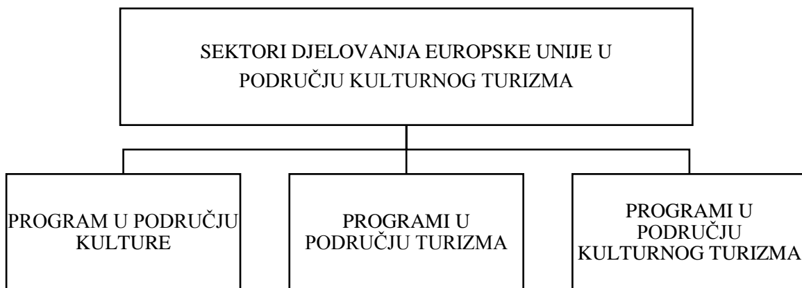
Shema 3. Sektori djelovanja europske unije u području kulturnog turizma