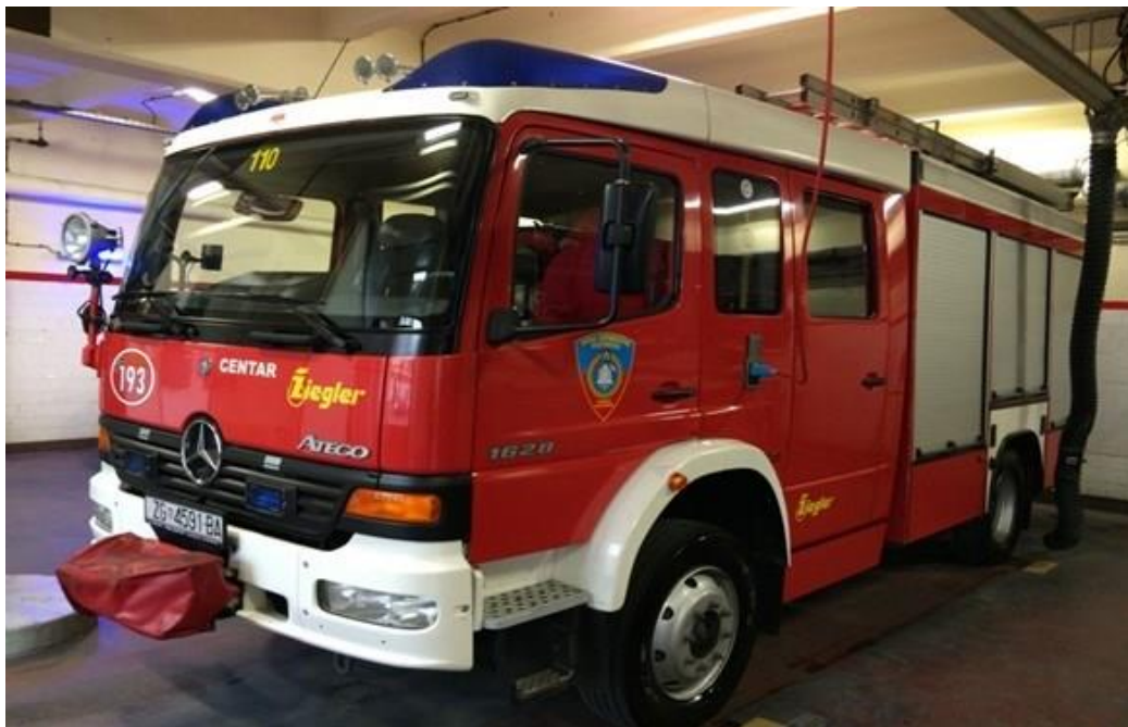
Slika 10. Primjer navalnog vozila -NVT2.[7]

Prema tipizaciji navalno vozilo-tehničko služi za prijevoz vatrogasnog odijeljena od minimalno 6 članova (slika 10). Opremljeno je s vatrogasnim armaturama i opremom za gašenje požara, s ugrađenom vatrogasnom pumpom normalnog tlaka i visokotlačnom pumpom, spremnikom za vodu većim od 2500 l, sa spremnikom/ spremnicima za pjeno, s opremom za tehničke intervencije, s visokotlačnim vitlima za brzu navalu, a može imati i sustav za gašenje pjeno CAFS.[9]