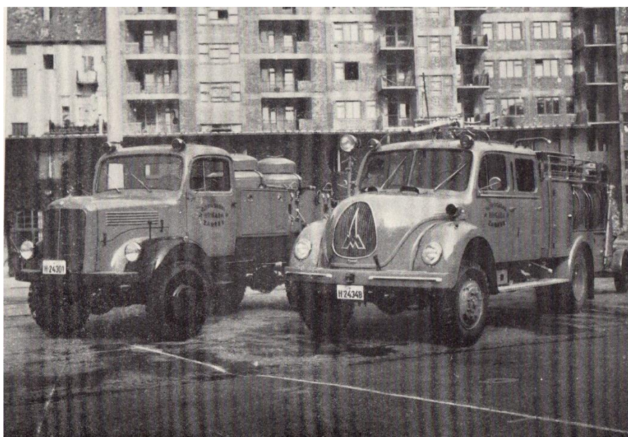
Slika 8. Nova vozila 1960. godine.[3]

Među najuspješnije godine vatrogasne brigade Zagreb mogu se ubrojiti 1957., 1958. i 1960. godina. One znače revolucionarni preporod brigade, a tu se misli na mnoge novosti u poboljšanju i modernizaciji opreme što u konačnici dovodi do veće operativnosti jedinice. Te godine donose daljnji priljev novih suvremenih vatrogasnih vozila poznatih zapadnonjemačkih tvornica (slika 8.). Sva ta vozila o kojima je riječ predstavljala su posljednju riječ vatrogasne tehnike, a neka od njih pojavljuju se kao novost u svijetu. [3]