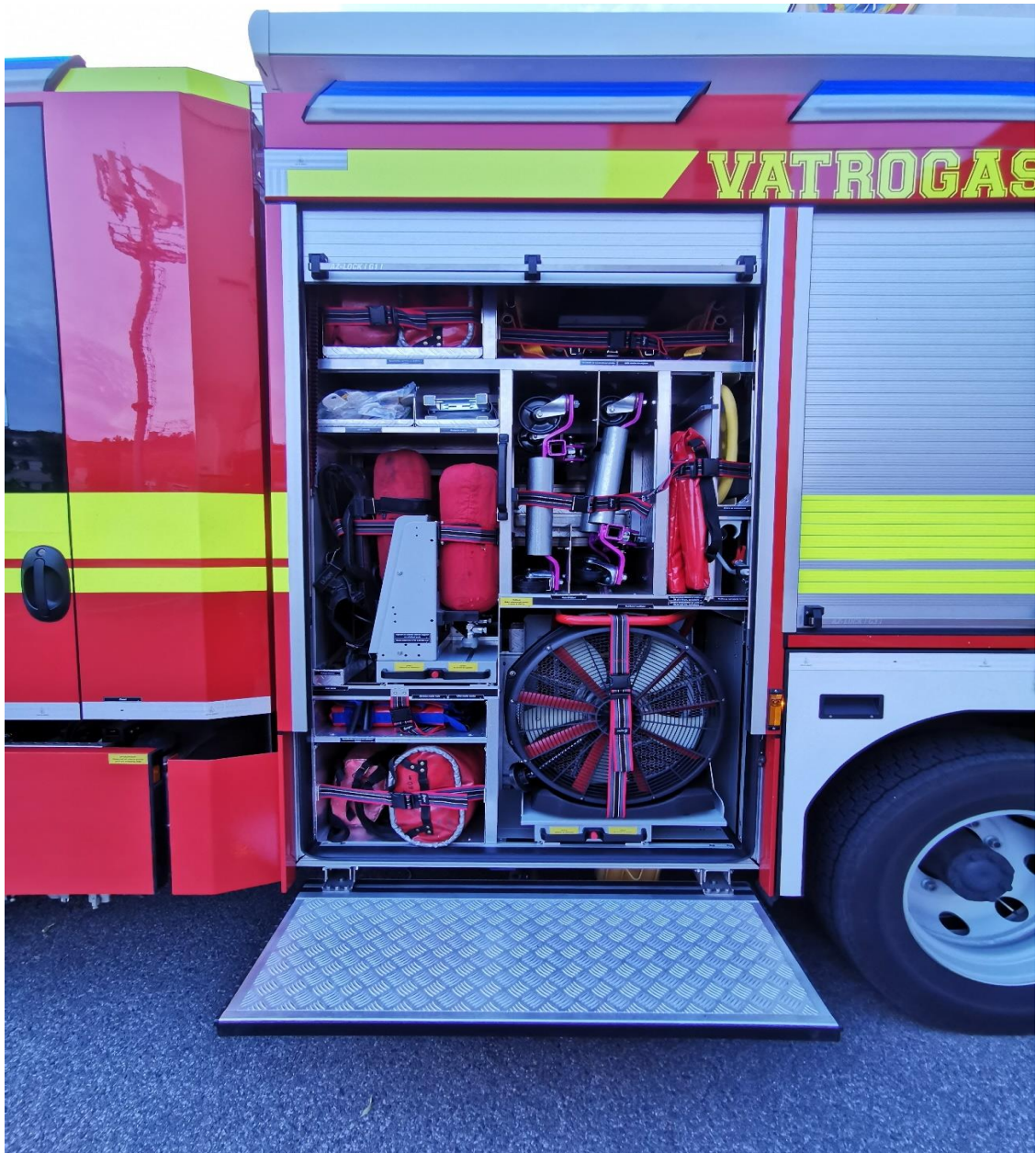
Slika 19. Prostor opreme lijevi broj 1.[7]

Oprema koja se nalazi je: ABS dvodijelna nosila, nosila sklopiva, daska za unesrećene, sjedeća nosila, trake za osiguranje unesrećenih, KED prsluk, autolift, protu - dimne zavjese za vrata, ploča za pisanje, aparat za zaštitu dišnih organa, nad - tlačni ventilator, torba za radove na visini s užadi i spravicama, šanc ovratnik,...(slika 19.)