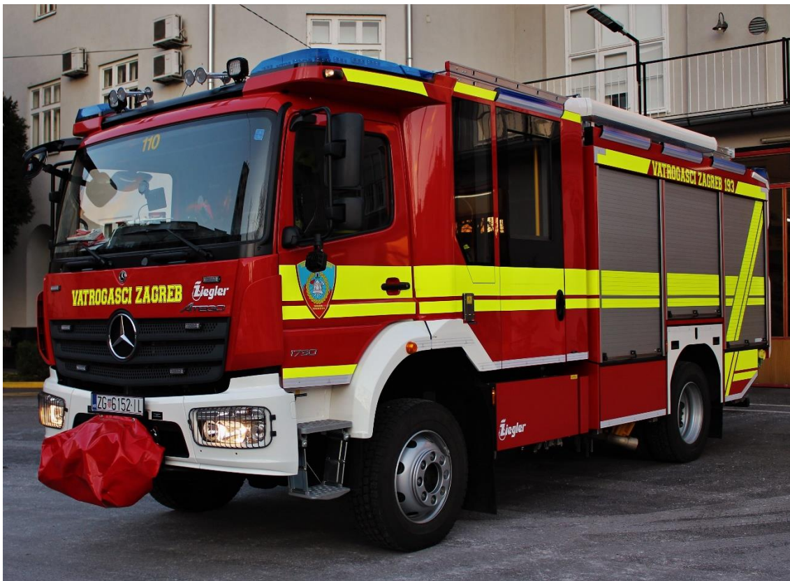
Slika 12. Novo navalno vozilo Vatrogasne postrojbe Zagreb.[7]

Prilikom same konstrukcije vozila znalo se što sve treba biti na vozilu, te je vozilo rađeno po željama kupca odnosno JVP grada Zagreba.