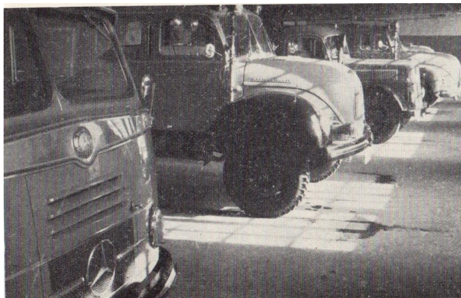
Slika 7. Vozila u garaži 1955. godine.[3]

Među najuspješnije godine vatrogasne brigade Zagreb mogu se ubrojiti 1957., 1958. i 1960. godina. One znače revolucionarni preporod brigade, a tu se misli na mnoge novosti u poboljšanju i modernizaciji opreme što u konačnici dovodi do veće operativnosti jedinice. Te godine donose daljnji priljev novih suvremenih vatrogasnih vozila poznatih zapadnonjemačkih tvornica (slika 8.). Sva ta vozila o kojima je riječ predstavljala su posljednju riječ vatrogasne tehnike, a neka od njih pojavljuju se kao novost u svijetu. [3]