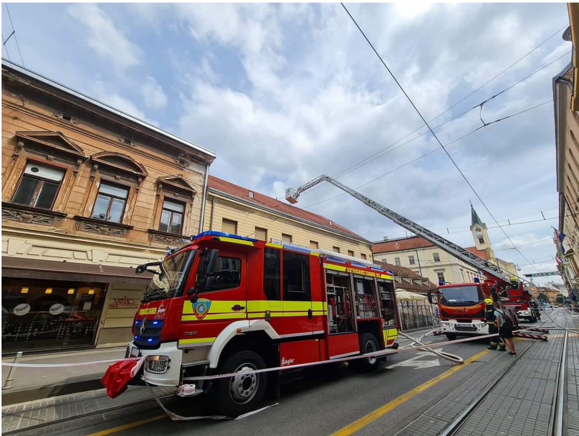
Slika 27. Detalj sa intervencije - Požar Krovišta. [7]

Opis intervencije: Prema dojavi iz centra veze postrojba je upućena na intervenciju požara u kuhinji restorana na adresi Frankopanska 11, Zagreb (slika 27.). Dolaskom na mjesto intervencije utvrđeno je da se radi o požaru nape i dimovodnog kanala u kuhinji restorana koji se proširio na krovište i tavanski prostor. Požar je ugašen vodom unutarnjom navalom s 1 „C“ mlazom u kuhinji restorana i 1“C“ mlazom u tavanskom prostoru objekta položenog s navalnog vozila te vanjskom navalom s 1 „C“ mlazom preko visinskog vozila na krov objekta. Raskriveno je cca 15m 2 krovišta i uklonjeno 8m dimovodnog kanala koji je spušten u tavanski prostor zbog gašenja i saniranja požara. Uzrok intervencije je neredovito čišćenje dimovodnog kanala. Šteta je neutvrđena, a odnosi se na prostor restorana veličine cca 15m x 5m, dimovodne kanale, drvene grede u tavanskom prostoru i dio krovišta cca 15m 2 . [4]