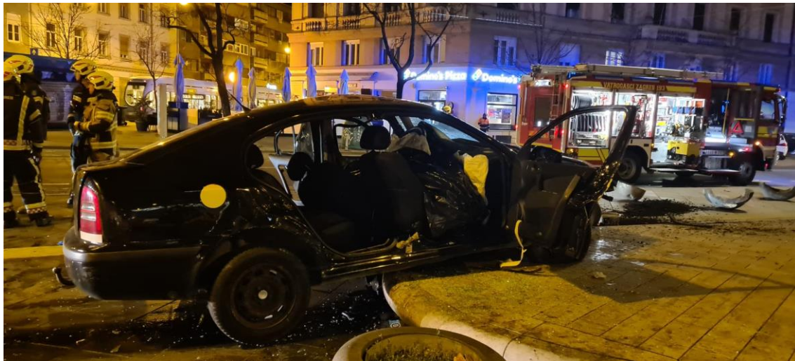
Slika 24. Detalj sa intervencije – prometna nezgoda.[7]