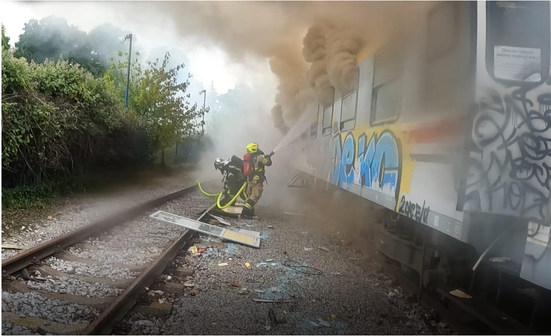
Slika 25. Detalj sa intervencije - Požar Vagona.[7]