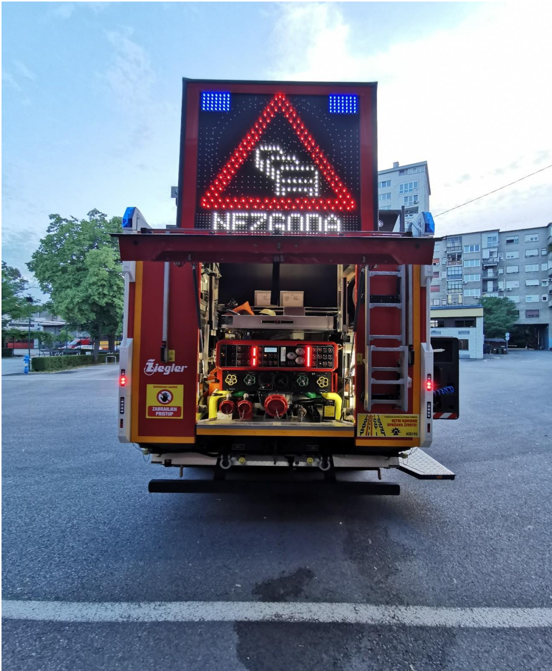
Slika 22. Prostor opreme zadnji.[7]

Oprema u njemu je: centrifugalna pumpa, ABC ključ za cijevi, upravljačka konzola za rasvjetni stup, trake za teret sa zatezačima, sabirnice, prijelaznice, uže za usisni vod,... (slika 22.)