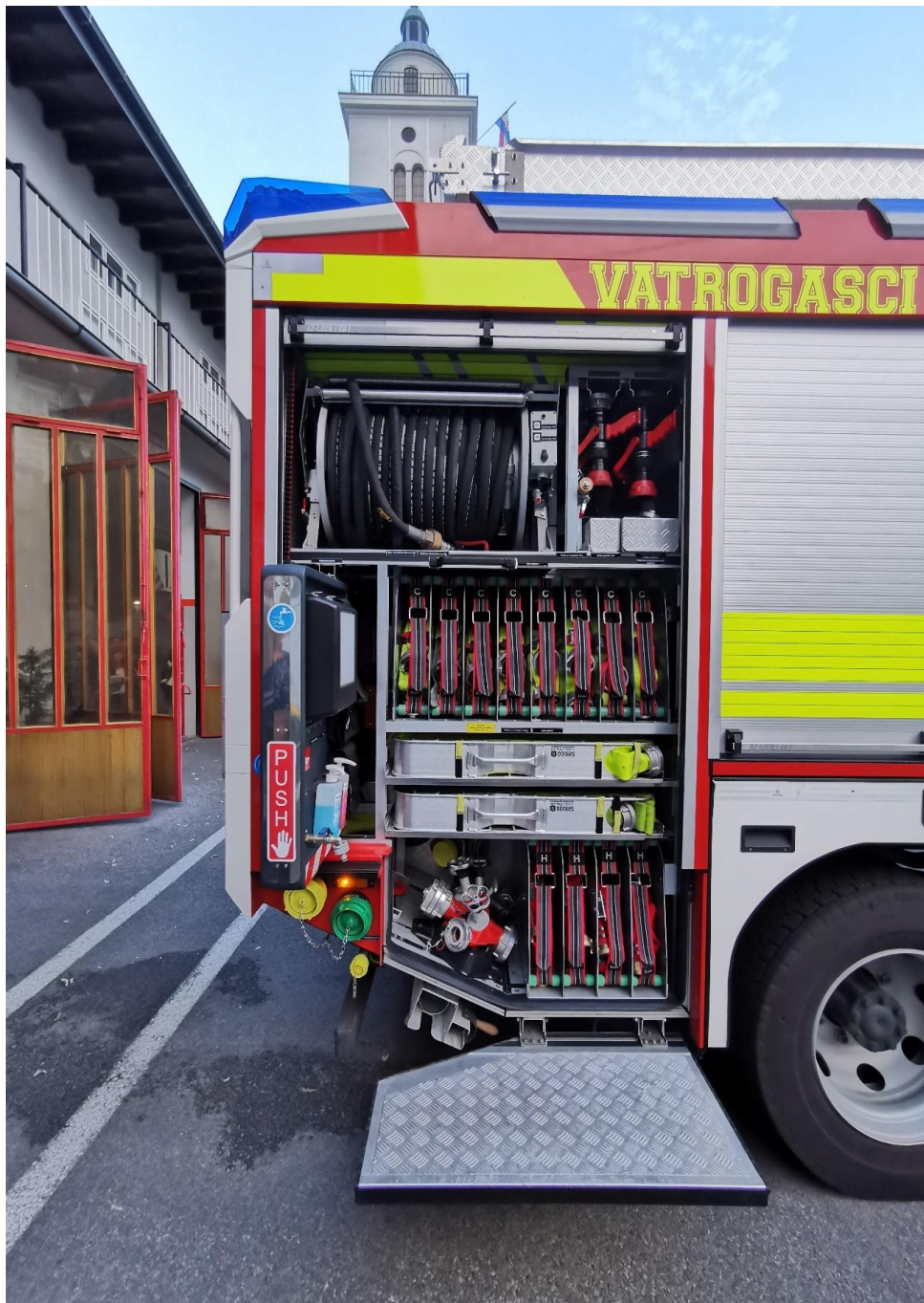
Slika 18. Prostor opreme desni broj 3.[7]

Oprema koja se nalazi je: visokotlačno vitlo 60 m, pištolj mlaznica, turbo mlaznice, koplje mlaznica, kofer s cijevima za brzo postavljanje, visokotlačne cijevi, srednjetačne cijevi, ograničivač tlaka, higijenska stijena, trodjelna razdjelnica, ... (slika 18.)