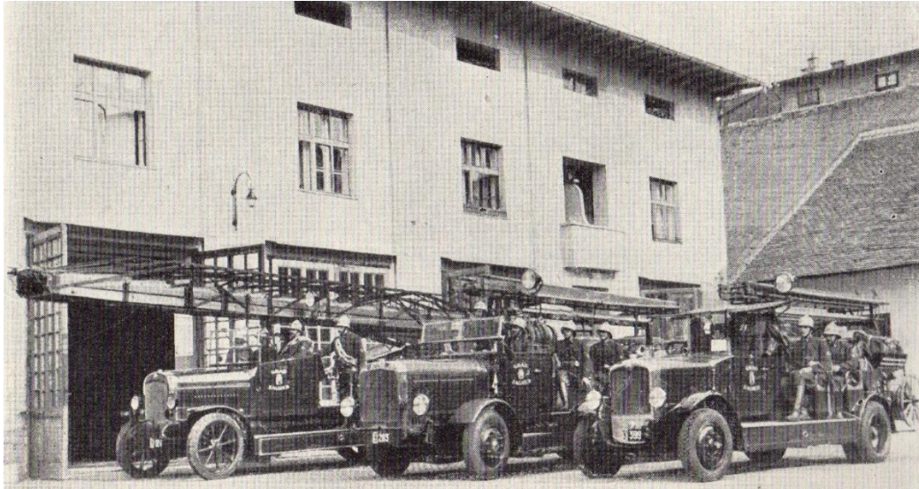
Slika 6. Novi vatrogasni strojevi 1929. godine.[3]

1929. godine prilike u vatrogasnoj službi u Zagrebu donekle se popravljaju, te je izvršena nabavka novih strojeva, pribora i opreme. Gotovo sva vozila do tada bila su otvorene građe, a to se pokazalo prilično nezgodno obzirom na zaštitu ljudi prilikom odlaska na intervenciju (slika 6.).