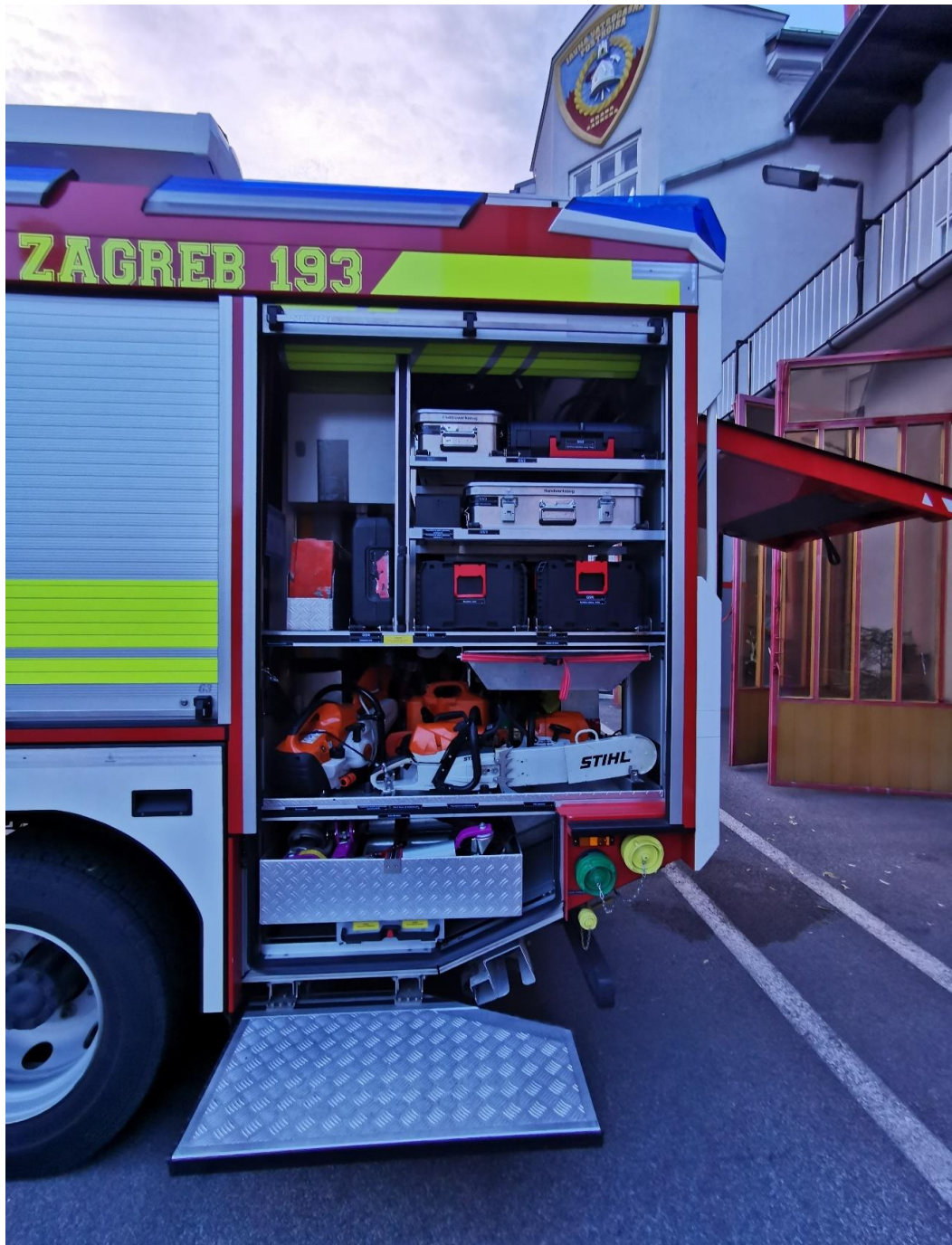
Slika 21. Prostor opreme lijevi broj 3.[7]

Oprema koja se u njemu nalazi: električarski alat u koferu, mehaničarski alat u koferu, baterijska udarna bušilica u koferu, punjač za baterije za baterijski alat, pajsers poluge, baterijska brusilica, baterijska sabljasta pila, motorni parač, motorna pila, karnister za gorivo, autolift, mulde za šutu, hidraulika za otvaranje vrata,.....(slika 21.)