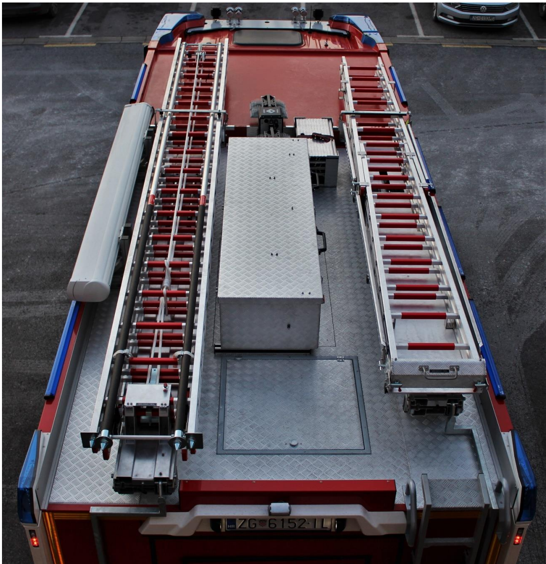
Slika 23. Krov Vozila.[7]