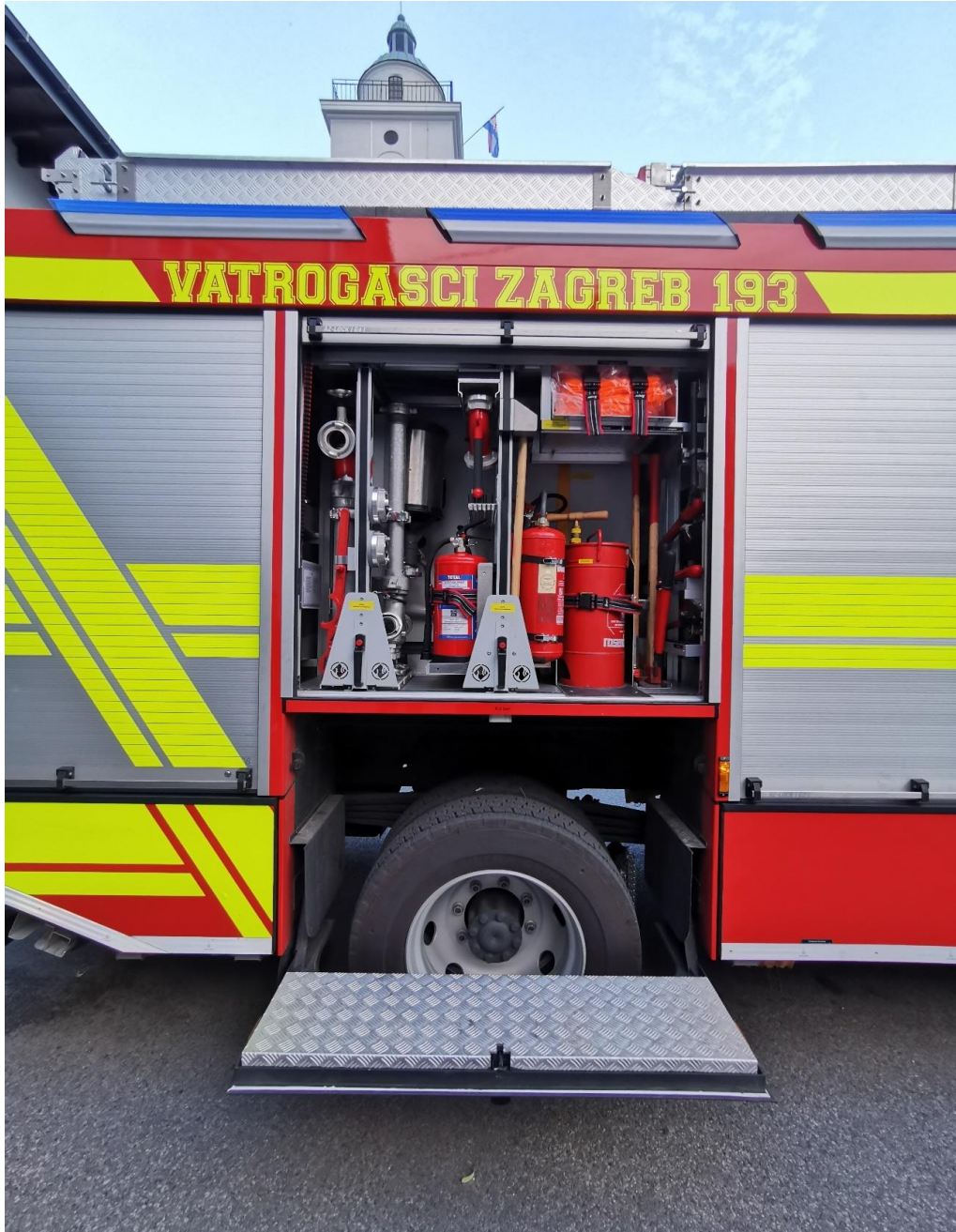
Slika 17. Prostor opreme desni broj 2.[7]

U njemu se od opreme nalazi: mlaznica za tešku pjenu, mlaznica za srednje tešku pjenu, hidrantski nastavci, ključ za podzemni hidrant, ključ za nadzemni hidrant, mlaznica vodeni štit, vatrogasni aparati za gašenje požara prahom (S), vatrogasni aparati za gašenje požara CO 2 , vatrogasni aparati za gašenje požara vodom i pjenom (VP15), vatrogasne sjekire, obična sjekira, ABC ključ za cijevi,... (slika 17.).