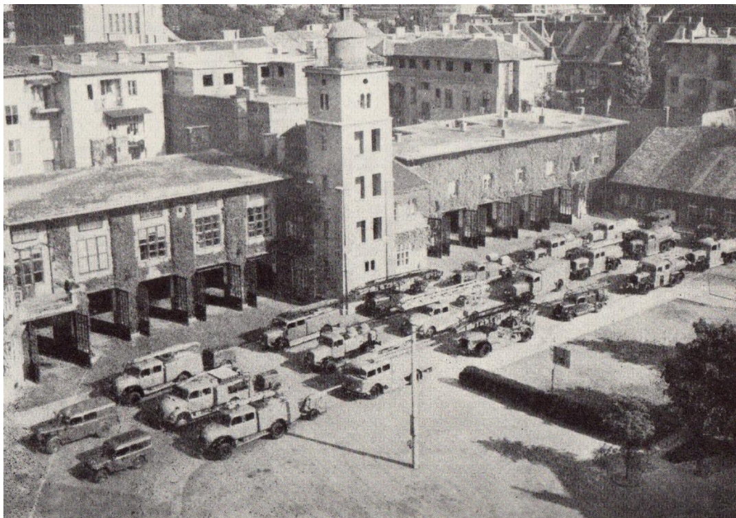
Slika 9. Kompletni vozni park Vatrogasne brigade Zagreb 1960. godine.[3]

Vatrogasna postrojba grada Zagreba i tada je kao i danas prednjačila u opremljenosti vatrogasnim vozilima i tehnikom te se svrstala uz bok europskih vatrogasnih postrojbi (slika 9.).