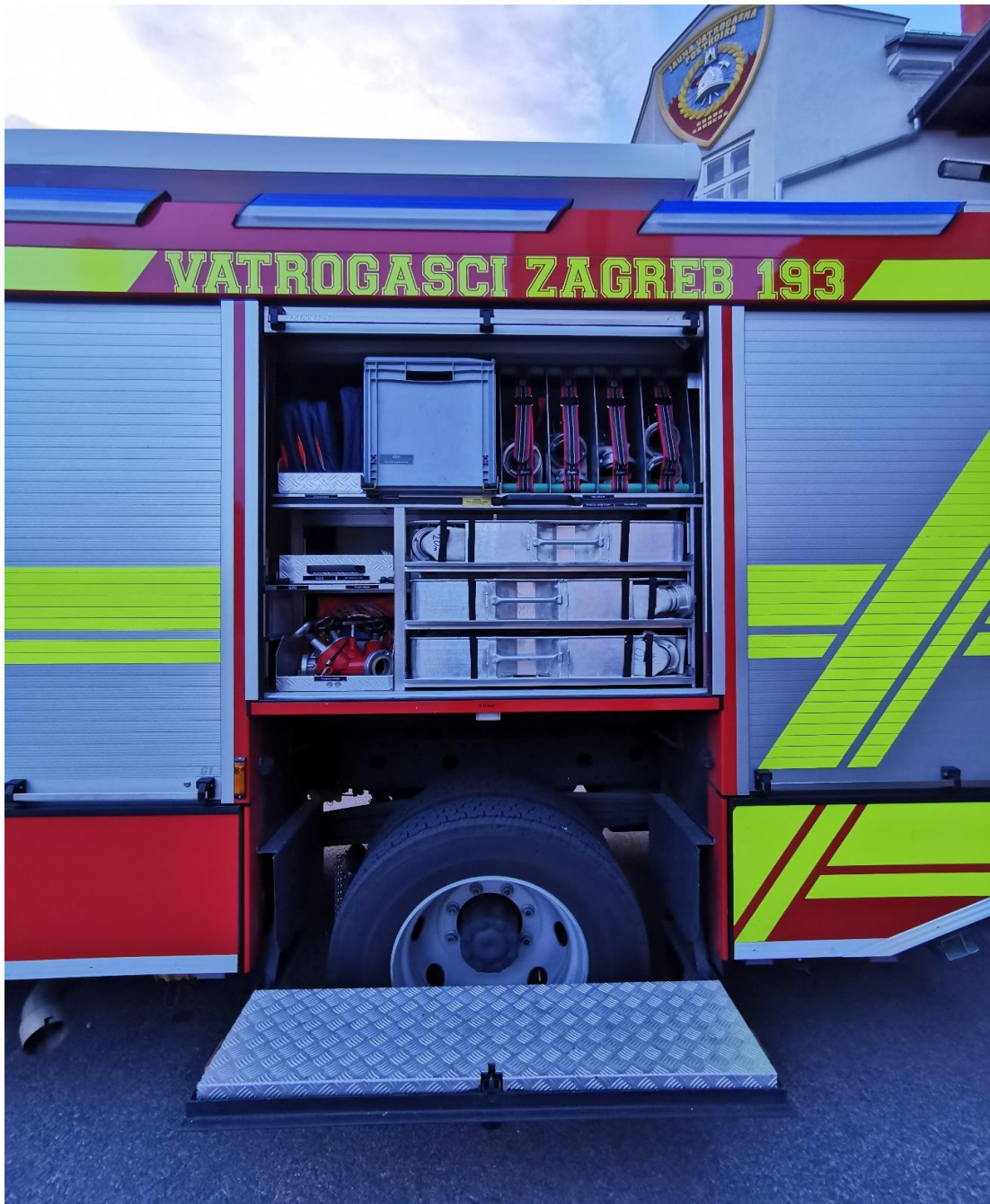
Slika 20. Prostor opreme lijevi broj 2.[7]

Oprema koja se u njemu nalazi: sklopivi čunjevi, pumpa za fino ispušavanje, tlačne cijevi, čelično užo za vuču, kofer s tlačnim cijevima, trodjelna razdjelnica, koloture,... (slika 20.)