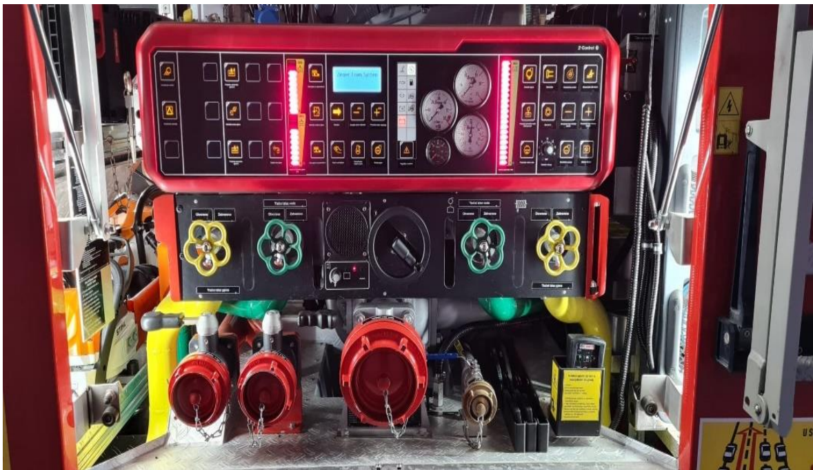
Slika 13. Centrifugalna pumpa NVT G-110.[7]