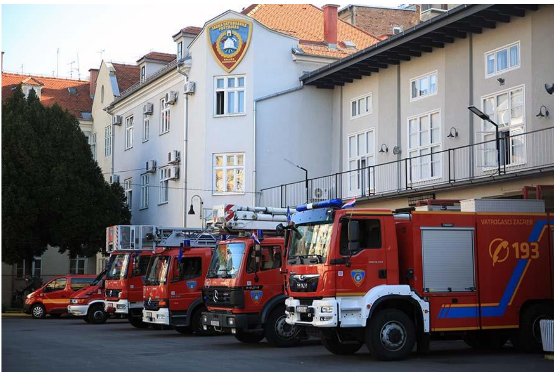
Slika 1. Dio vozila JVP grada Zagreba.[7]

U ostala vatrogasna vozila ubrajamo cijevna vozila, vozila za gašenje šumskih požara, komandno-operativna vozila i druga vozila specijalnih namjena.[2]