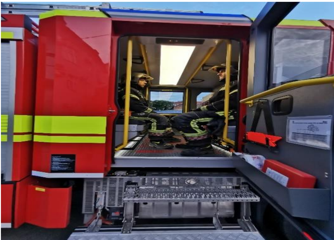
Slika 14. Prikaz posade navalnog vozila G-110.[7]