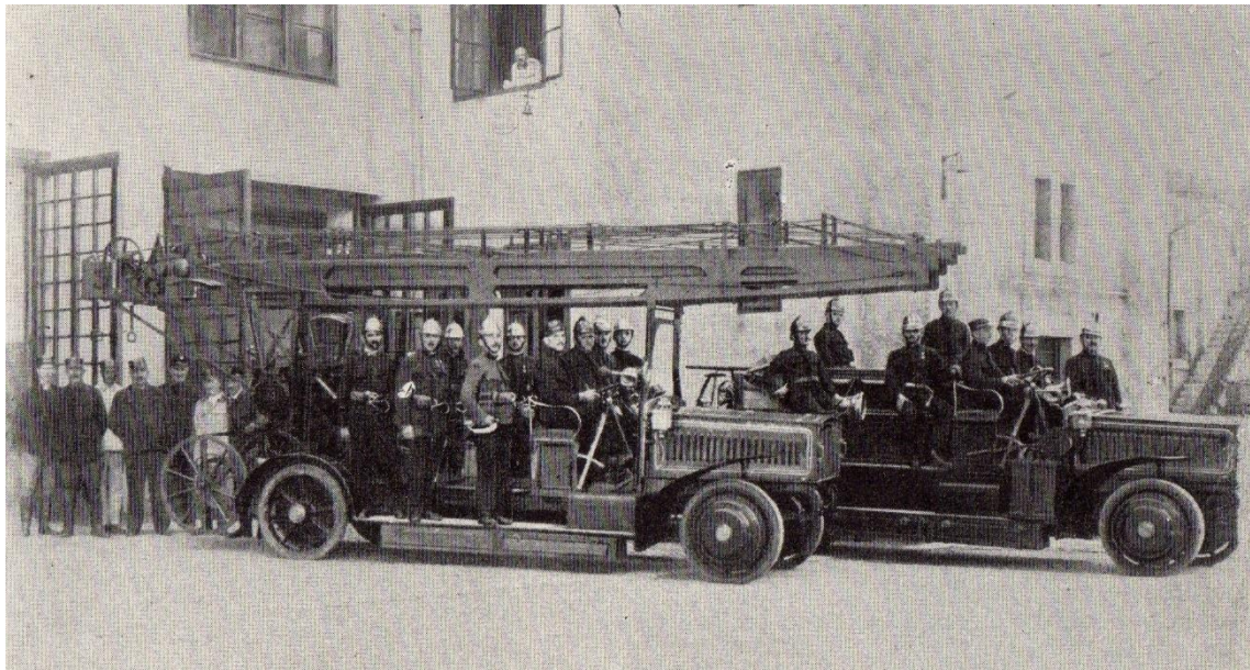
Slika 4. Prva dva zagrebačka elektro vatrogasna vozila.[3]

Uskoro je izbio prvi svjetski rat, te je razvoj vatrogasne službe imao svoj zastoј. Od 1919. god. nadalje vatrogasna služba u Zagrebu bila je na prilično niskoj razini. Nekako je ipak došlo do nabavljanja dvije autoštrcaljke marke „Steyer“ i jednih ljestava tipa „Magirus“. Sada su već automobili bili na benzinski pogon, a konjska sprega padala je u zaborav.[3]