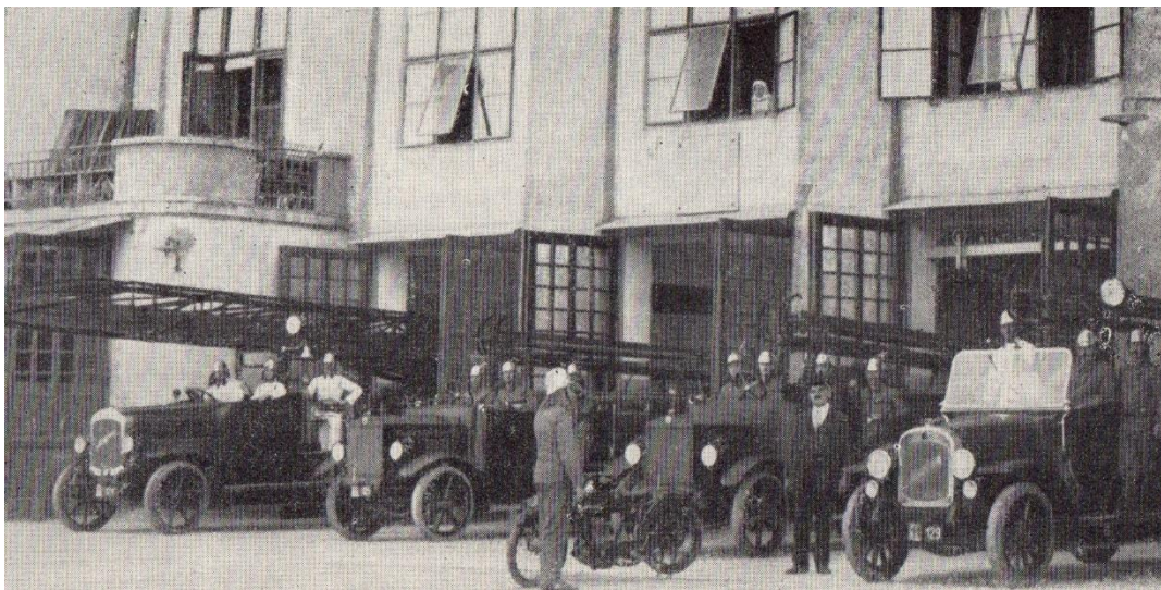
Slika 5. Vozni park zagrebačkih vatrogasaca 1925. godine.[3]

1925. god. postepeno se nabavljaju nova vatrogasna vozila u Zagrebu (slika 5.).