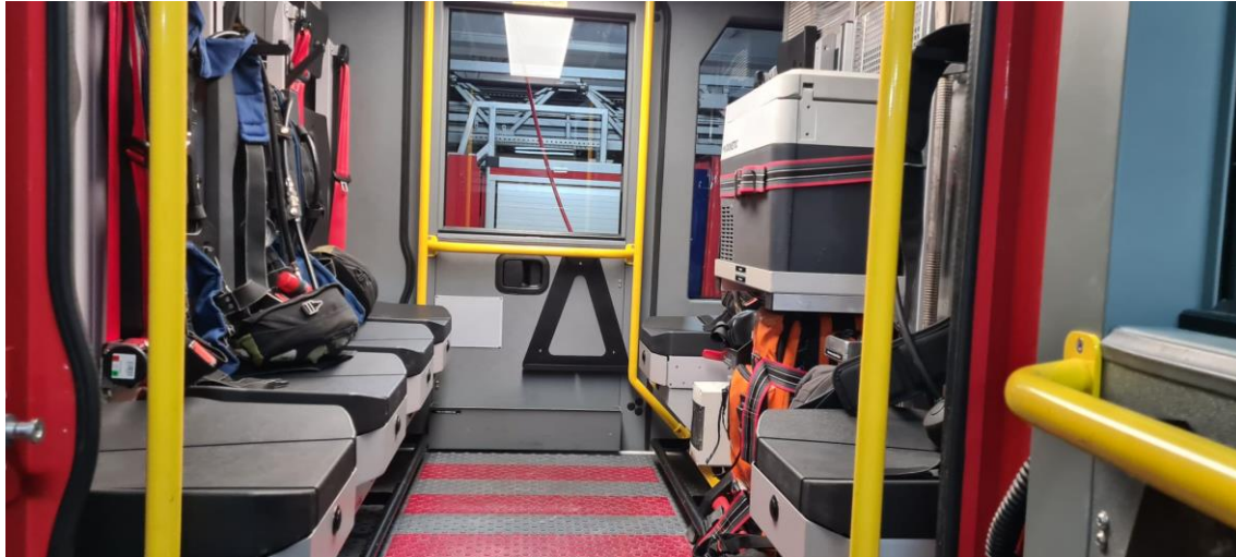
Slika 15. Kabina vozila.[7]