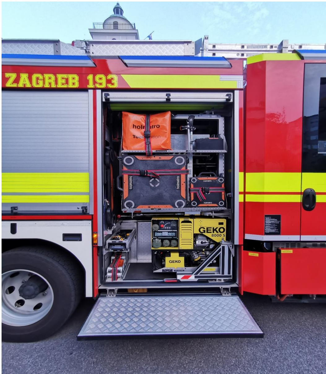
Slika 16. Prostor opreme desni broj 1.[7]

Od bitnije opreme u njemu se nalazi: prijenosni agregat za struju, radni prijenosni reflektori, baterijski alat za tehničke intervencije (škare, razupore, kombinirani alat i cilindri), rezervne baterije za alat, setovi za blokadu zračnih jastuka na vozilima, uređaji za stabilizaciju vozila, zračni jastuci za podizanje vozila ( 2, 11, 38 i 64 tone), razne poluge, lanci sa kukama za razvlačenje vozila u prometnim nesrećama, produžni kabel za struju, uređaj za otvaranje protuprovalnih vrata,... (slika 16.)