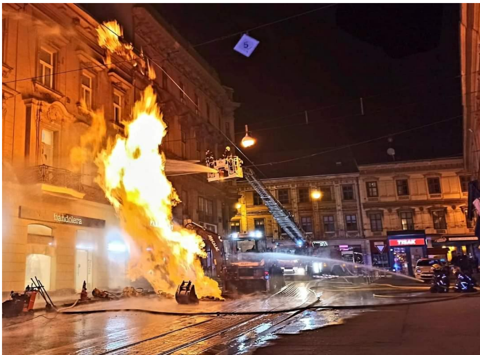
Slika 26. Detalj sa intervencije - Požar plina.[7]

visinskog vozila. Uz objekt je postavljena i specijalna štiti mlaznica. ZET je isključio napajanje za mrežu jer je došlo do pucanja električnih vodova, a djelatnici Plinara su zatvorili plin. Nakon pada tlaka u plinskoj mreži došlo je do smanjenja intenziteta plamena. Nakon gašenja očitane su koncentracije plina u jami zbog oštećenja cijevi te je ista zabrtvljena pneumatskim jastucima s akcidentnog vozila. Uzrok intervencije je neutvrđen, a utvrdit će se očevidom. Šteta je neutvrđena. Na intervenciji su bili nazočni djelatnici policije Centar, Specijalna interventna, hitna pomoć, Vodoopskrba i odvodnja, Zet, Plinara i Civilna zaštita.[4]