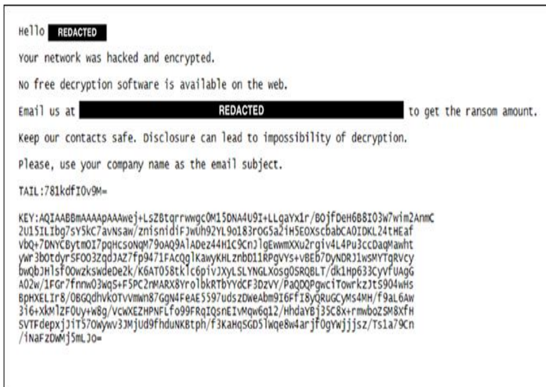
Slika 3. Primjer otkupnine [27]

datotekama također je prilagođena tako da koristi prikaz imena žrtve. Primjer nove otkupnine je prikazan ispod na slici 3.