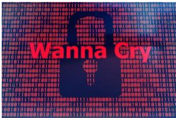
Slika 5. WannaCry ransomware [29]

WannaCry ransomware otkrio je specifičnu ranjivost sustava Microsoft Windows, a ne napad na nepodržani softver. Utvrđeno je da je većina uređaja Nacionalnog zdravstvenog sustava zaraženih ransomware-om radila na podržanom, ali bez zakrpe, operacijskom sustavu Microsoft Windows 7, otuda i kibernetički napad. Ransomware se proširio i putem interneta, uključujući i putem mreže N3 (širokopojasna mreža koja povezuje sva web mjesta NZS u Engleskoj), ali na sreću nije bilo slučajeva širenja ransomware-a putem e-maila NZS.