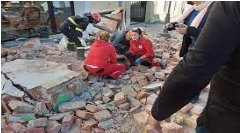
Slika 26. Nošenje zaštitnih maski tijekom spašavanja građana