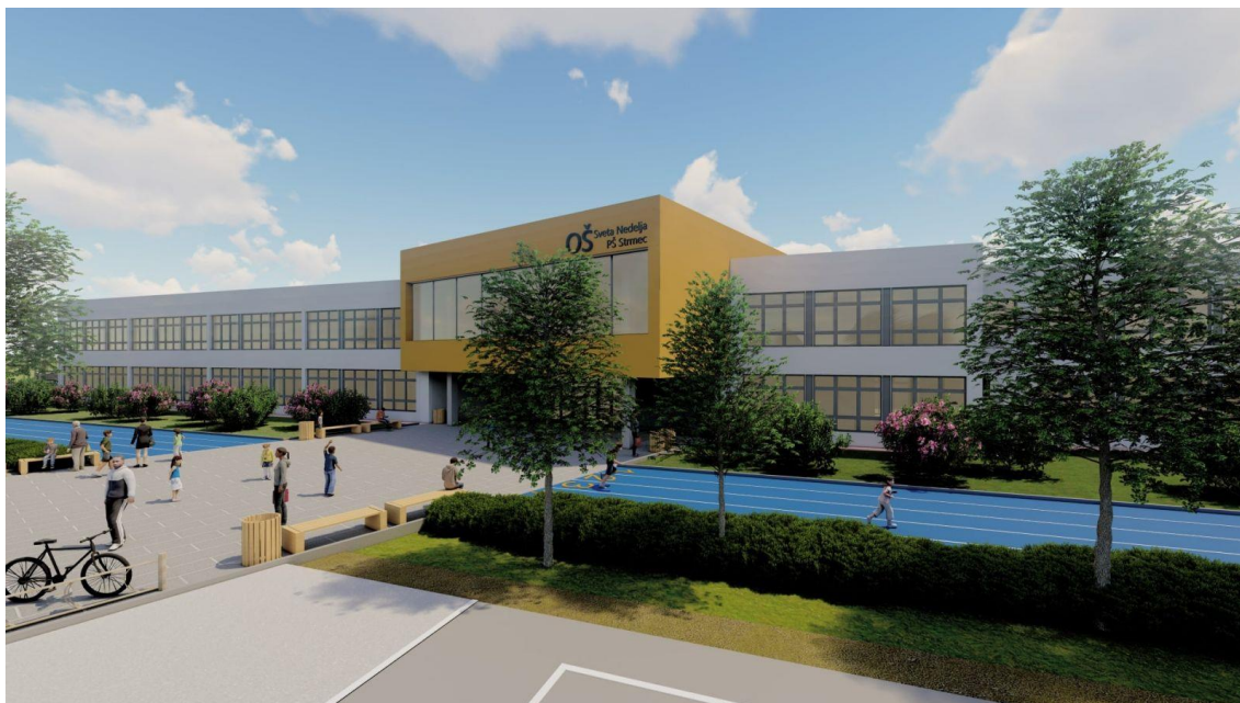
Slika 4: Osnovna škola Strmec, područna škola osnovne škole Sveta Nedelja