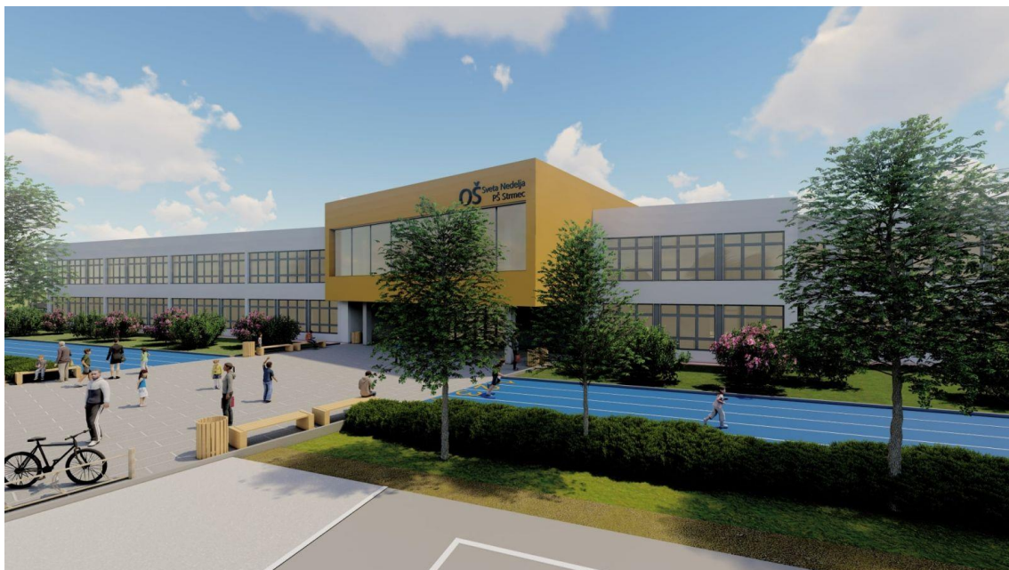
Slika 4: Osnovna škola Strmec, područna škola osnovne škole Sveta Nedelja