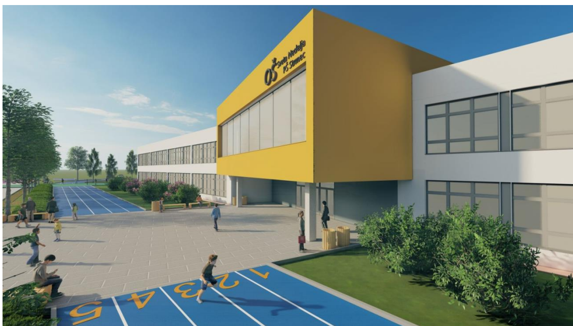
Slika 5: Osnovna škola Strmec, područna škola osnovne škole Sveta Nedelja

Slika 4. i slika 5. pripadaju internoj dokumentaciji Osnovne škole Sveta Nedelja, a prikazuju dizajn i arhitekturu područne škole Osnovne škole Strmec koja je sastavni dio Osnovne škole Sveta Nedelja. Na sljedećoj slici (slika 6) slijedi prikaz arhitekture zgrade “Crkvenjak” u kojoj je škola obnašala funkciju osnovne škole od 1856. godine.