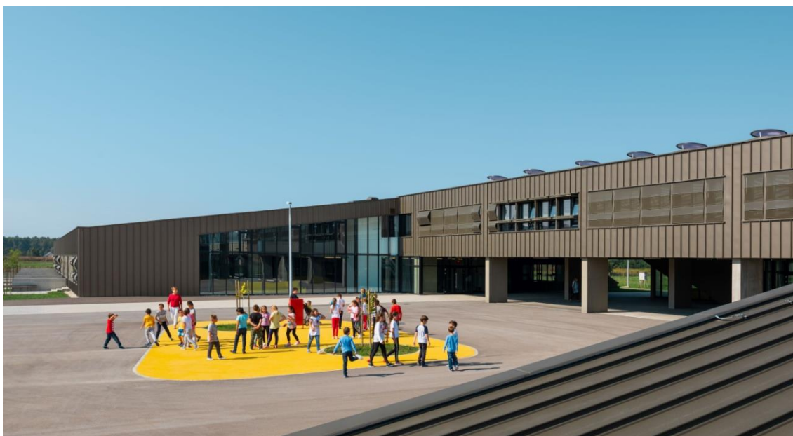
Slika 1. Arhitektura Osnovne škole Zorke Sever u Popovači[17]

U Hrvatskoj postoje jako lijepi primjeri arhitekture osnove škole, a jedan od njih je i Osnovna škola Zorke Sever u Popovači (slika 1.).