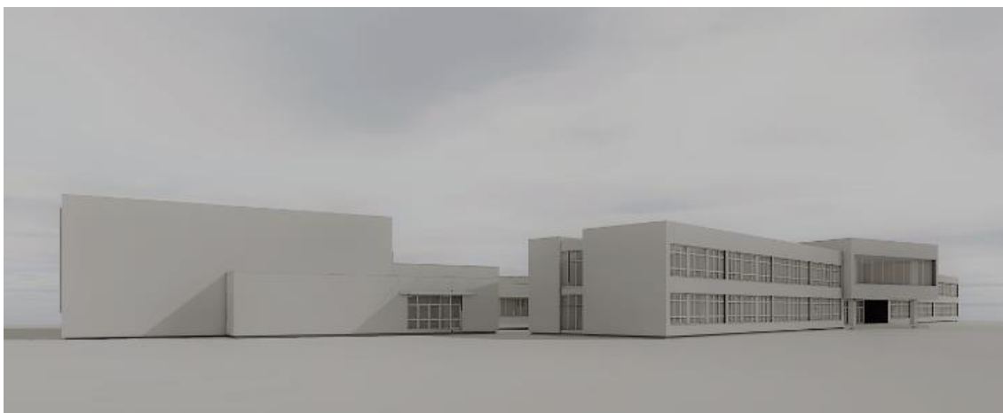
Slika 3: Arhitektura nove Osnovne škole Sveta Nedelja

Osnovna škola Sveta Nedelja se nalazi u Svetoj Nedelji, na adresi Svetonedeljska ulica 21, i primjer je jedne zgradne javne i društvene namjene odnosno osnovne škole. Prema internoj dokumentaciji ove osnovne škole analizirat će se određeni projekti i dizajn kao primjer u praksi. Postoji povijesni podatak da je ova osnovna škola osnovana 1851. godine i poučavanje je počelo u privatnoj kući, ali je prekinula s radom i počela opet raditi 1856. godine u zgradi “Crkvenjak” koja se nalazi i danas pokraj škole. Zatim je 1891. godine izgrađena takozvana “papirnata škola” iza nekadašnjeg Doma umirovljenika, a 1895. godine je dovršena nova zgrada škole na mjestu Vatrogasnog doma, ali je nažalost stradala u požaru. Godine 1948. je dovršena nova školska zgrada i Dom kulture, a to je danas stari dio škole. U 2000. godini je završena gradnja novog dijela osnovne škole sa četiri učionice, a 2019. godine je završena energetska obnova školske zgrade. Dizajn i arhitektura nove Osnovne škole Sveta Nedelja prikazat će se na slici 3. iz interne dokumentacije Osnovne škole Sveta Nedelja.