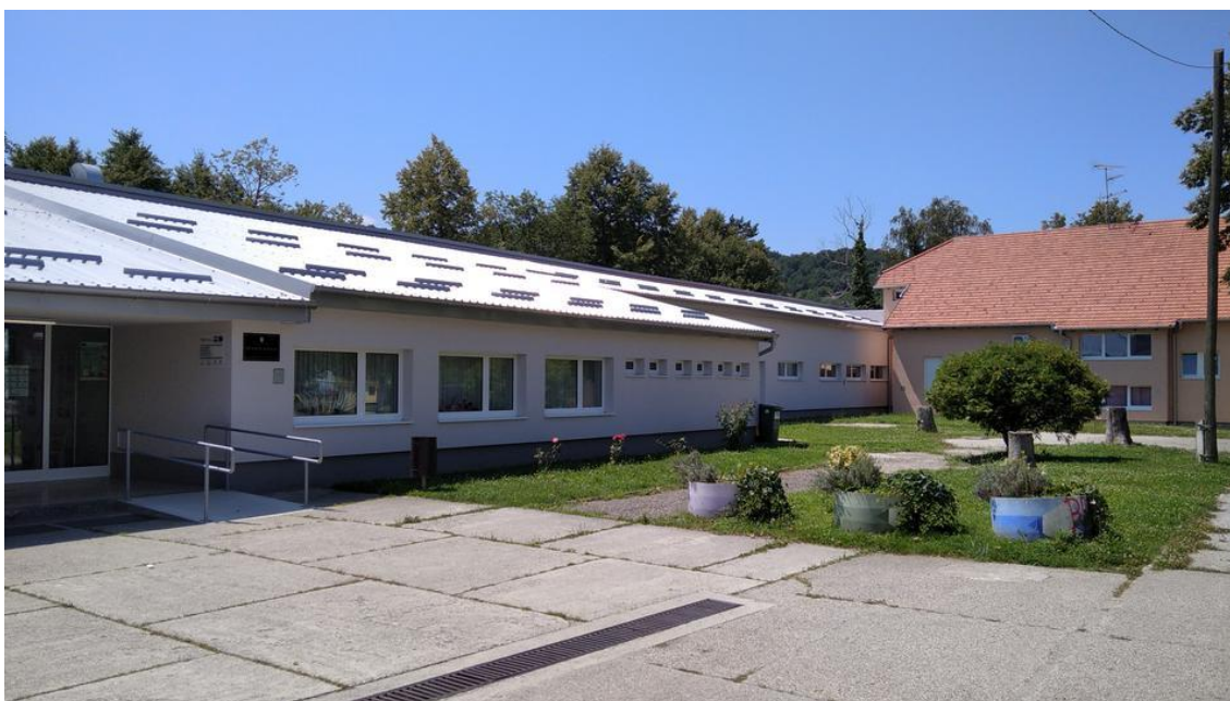
Slika 8: Matična škola OŠ Sveta Nedjelja nakon energetske obnove zgrade

Osnovna škola Sveta Nedjelja, matična škola, je započela projekt energetske obnove školske zgrade u 2018. godini, a završen je u 2019. godini. Investitor je Osnovna škola Sveta Nedjelja, a partner na projektu je bilo Ministarstvo graditeljstva i prostornog uređenja Republike Hrvatske i Fond za zaštitu okoliša i energetska učinkovitost. Projekt energetske obnove zgrade je iznosio ukupno 9.099.711,69 kuna, od čega je odobreno 3,64 milijuna kuna bespovratnih sredstava iz europskih strukturnih i investicijskih fondova, a ostatak troškova je financiran od strane osnivača osnovne škole Zagrebačke županije i Grada Sveta Nedjelja. S ovim građevinskim projektom vezanim uz toplinsku zaštitu i zaštitu od buke, osnovna škola Sveta Nedjelja je obnovila vanjsku ovojnicu zgrade i cjelokupnu fasadu, izolirani su stropovi prema tavanu i kosi krovovi, zamijenjena je stara drvena vanjska stolarija s aluminijskom stolarijom (slika 8).