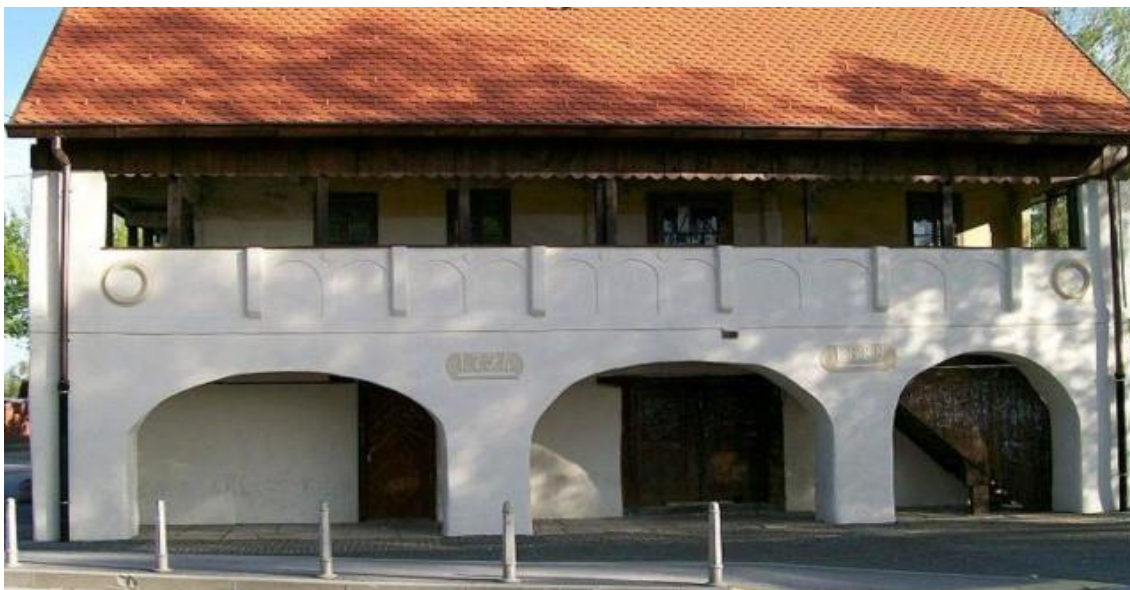
Slika 6: "Crkvenjak" – zgrada Osnovne škole Sveta Nedelja u kojoj je osnovna škola radila od 1856. godine

Zgrada pod nazivom "Crkvenjak" je zgrada koja se i danas nalazi pokraj zgrade Osnovne škole sveta Nedelja, a u njoj je funkcionirala ova osnovna škola od 1856. godine. Na slici 6 vidi se nekadašnji stil gradnje, arhitektura i dizajn Crkvenjaka ili osnovne škole Sveta Nedelja je u 19. stoljeću bio jako masivan, siv, monumentalan, za razliku od danas kada se stil i dizajn gradnje uvelike promijenio i to u korist učenika, ali i učitelja i ostalih djelatnika i posjetitelja škole (slika 7).