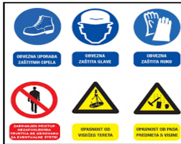
Slika 8. Znakovi zaštite kod rada na strojevima