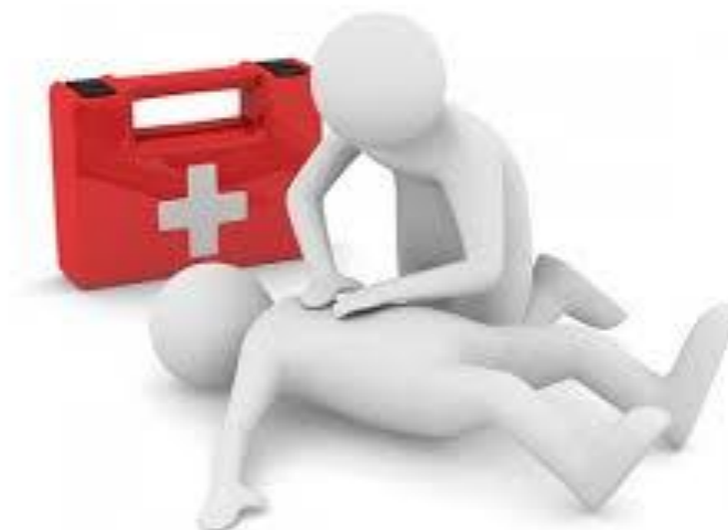
Slika 9. Pružanje prve pomoći