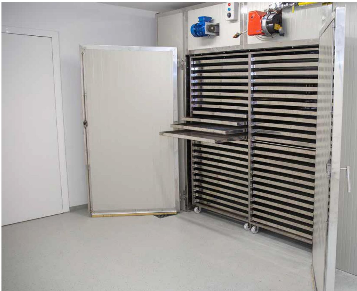
Slika 5: Oprema za preradu voća sušenjem