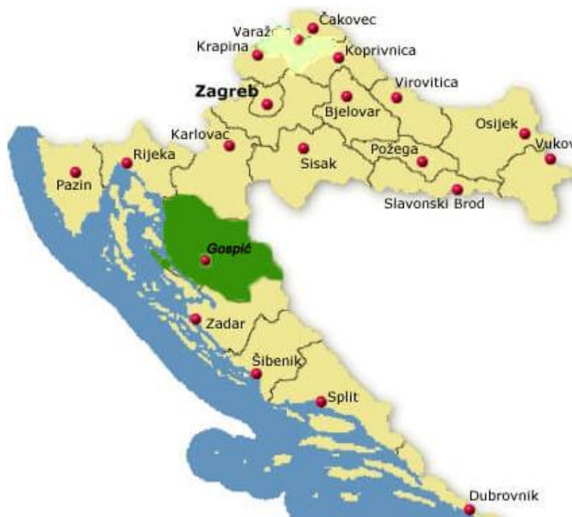
Slika 1: Prikaz položaja Ličko-senjske županije