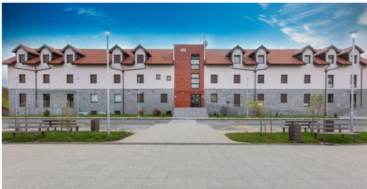
Slika 3: Razvojni centar Ličko-senjske županije