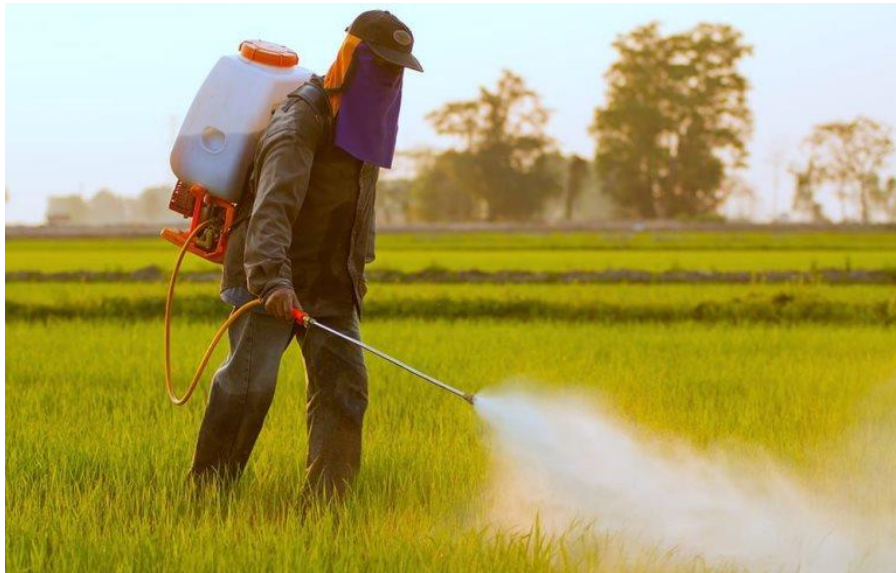
Slika 1. Prikaz tretiranja pesticidima

Izreka da "hrana nije ono što se proizvodi nego ono što se čuva" čini se prihvatljivom. Konzumacija hrane od strane nekih štetnika je zapanjujuća. Dnevne potrebe za hranom štakora su, na primjer, jedna petina njihove tjelesne težine, a bez hrane ne mogu izdržati dulje od 48 sati. Neke ličinke koje tvore lišće duhana i patlidžana pojedu hranu 50 000 puta veću od svoje početne težine u samo nekoliko tjedana razvoja [1].