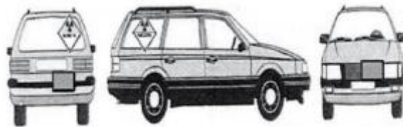
Slika 5. Označeno vozilo za prijevoz radioaktivnih tvari

Pod prijevozom podrazumijevaju se sve radnje i stanja povezana s premještanjem radioaktivnog materijala, npr. izrada, održavanje i popravak ambalaže, proizvodnja, otprema, utovar itd. Također je i bitno označavanje vozila kod prijevoza radioaktivnih tvari (Slika 5).