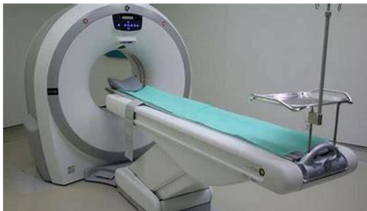
Slika 7. CT uređaj