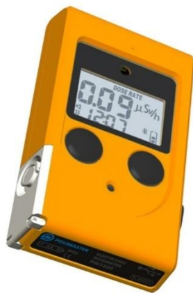
Slika 6. Dozimetar

Svaki radnik koji prevozi radioaktivne tvari mora imati osobni dozimetar te se mora izmjenjivati na mjesečnoj osnovi (Slika 6). Prijavljivanje i odjavljivanje provodi se putem centralne baze podataka koju vodi DZRNS (Državi zavod za radiološku i nuklearnu sigurnost). Radnik je dužan koristiti dozimetar tijekom obavljanja djelatnosti. [4]