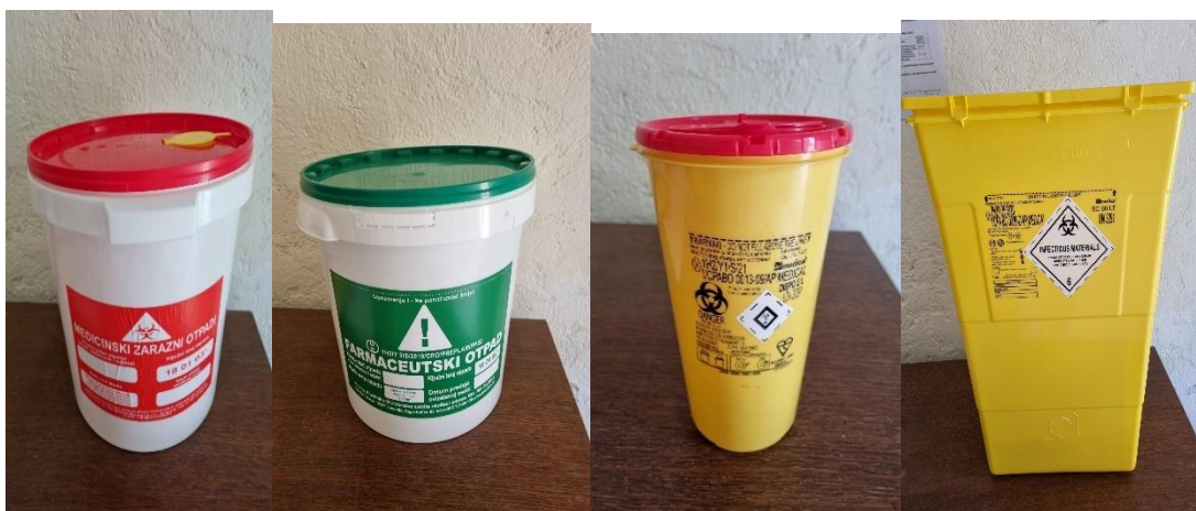
Slika 11. Prikaz spremnika medicinskog, farmaceutskog i infektivnog otpada

Pacijenti su zapravo velik izvor zračenja, a osobito njihove tjelesne izlučevine. Njihov tekući otpad ne ide u kanalizaciju već u spremnike koji se označavaju brojevima i svakodnevno im se provjerava radioaktivnost (Slika 11.). Od ljudskih organa najveću izloženost zračenju ima mokraćni mjehur. Radioaktivnim raspadom u spremištu razina radioaktivnosti pada ispod propisane granice pa je moguće kontrolirano ispuštanje iz nadzora.