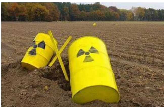
Slika 3. Primjer ambalaže za radioaktivne tvari

Kod ambalaže je nužno da se sastoji od jedne ili više posuda, da je izvedena od upijajućeg materijala i pregrađena kako bi štitila od radijacije te servisne opreme za punjenje, pražnjenje, ventiliranje i smanjenje tlaka.