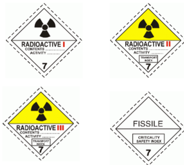
Slika 4. Listice za označavanje opasnih tvari klase 7