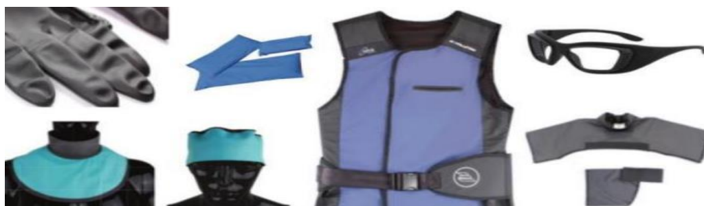
Slika 10. Osobna zaštitna oprema za zaštitu profesionalnog osoblja i bolesnika

Osobna zaštitna sredstva za zaštitu profesionalnog osoblja i bolesnika su: štitnici za ovarije i sjemenike bolesnika, zaštitne pregače za bolesnike, zaštitne naočale za zaštitu očne leće, zaštitne pregače za zaštitu unutarnjih organa, zaštitne rukavice, štitnik za vrat koji štiti štitnu žlijezdu, štitnik za podlaktice i nadlaktice, štit za spolne žlijezde (Slika 10).