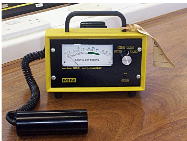
Slika 2. Geiger-Müllerovo brojilo radioaktivnog zračenja

Do danas se otkrilo mnoštvo metoda po kojima se može mjeriti radioaktivnost. Te metode zasnivaju se na pojavama koje su vezane za prolaz zračenja kroz materiju. Za primjer možemo uzeti pojavu kad zračenje ostavlja tragove u fotografskoj emulziji, pa se tako pomoću nje može otkriti. Isto tako zračenje izaziva ionizaciju u plinovima. Na toj se pojavi zasnivaju detektori zračenja i to: Ionizirajuća komora i Geiger-Müllerov brojač (Slika 2). Za precizno određivanje energije zračenja koriste se poluvodički detektori.