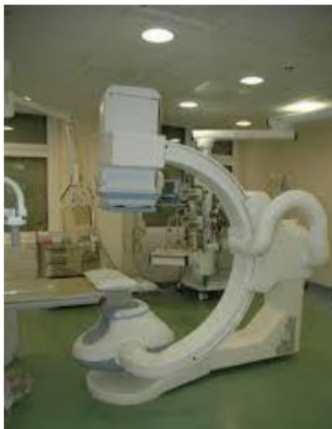
Slika 8. Uređaj za dijaskopiju

Uređaj za dijaskopiju mora imati ugrađenu automatsku kontrolu brzine zračenja i mora moći dati informacije o ukupnom zračenju pacijenta nakon završenog postupka (Slika 8).