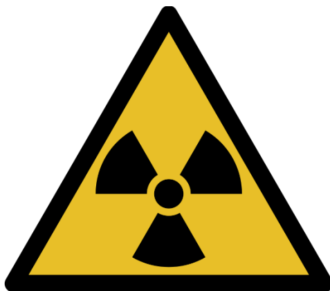
Slika 1. Znak za opasnost od radioaktivnosti

Radioaktivnost predstavlja emitiranje alfa, beta i gama čestica kod spontanog raspada atomske jezgre. Kod spontanog raspada atomske jezgre mijenja se atomski broj Z , odnosno maseni broj A . Promjena koja se dešava kod raspada jezgre atoma naziva se radioaktivnim raspadom. Također radioaktivno zračenje mijenja strukturu izvora radioaktivnog zračenja i svojstva materijala kroz koje prolazi. U tom procesu najznačajniji je efekt ionizacije, odnosno izbijanje elektrona iz elektronskog omotača nekog atoma. U nastavku se slika koja prikazuje oznaku koja može biti korisna i po kojoj možete prepoznati da je riječ o opasnosti od radioaktivnosti (Slika 1). [2]