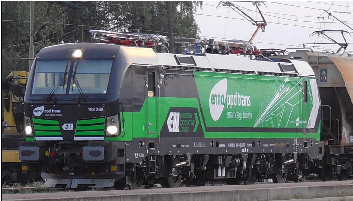
Slika 2. Teretna lokomotiva [3]