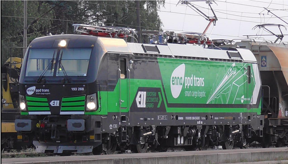
Slika 2. Teretna lokomotiva [3]