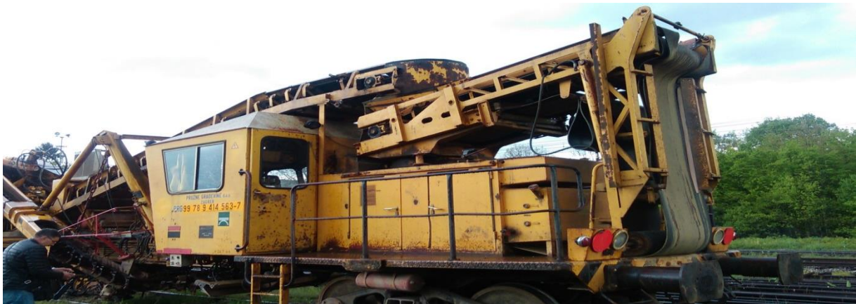
Slika 9. Rešetalice [18]

Rešetalice (slika 9) je stroj koji pomoću lanca kopa kamen ispod pragova, te ga pomoću elevatora dovodi u sita. Prosijavanjem materijala koji zadovoljava veličinom vraća se natrag pod pragove, dok kamen koji je manji od norme se odlaže u vagoni i odvozi na odlagališta [18].