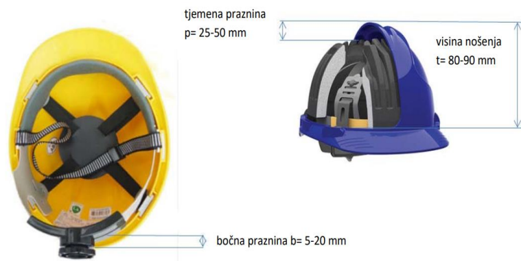
Slika 13. Zaštitna kaciga [21]

Zaštitna kaciga (slika 13) se koristi za zaštitu od pada predmeta. Zaštitna kaciga mora imati postavljenu kolijevku koja ima sposobnost podešavanja veličine s razmakom od kacige minimalno 2 do 4 cm [20].