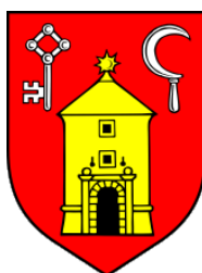
Slika 1. Grb Grada Ozlja