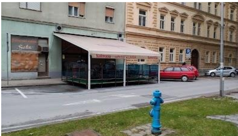
Slika br.3 Caffee bar Lavsa