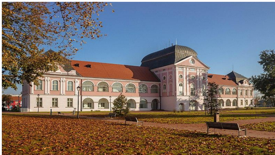
Slika 17 Dvorac Pejačević u Virovitici

Grad Virovitica je 2016. godine prijavio Integrirani razvojni program obnove Dvorac Pejačević i revitalizacije Gradskog parka na natječaj za obnovu kulturne baštine u funkciji turizma, a cijeli projekt obnove je uspješno priveden kraju 2019. godine. U sklopu projekta obnovljen je Dvorac Pejačević. Unutar dvorca nalazi se Gradski muzej, čiji je novi stalni postav posebno zanimljiv posjetiteljima. Nosi naziv Drveno doba i prikazuje drvo kroz nekoliko aspekata povijesnog razvoja samog grada, kao i starosjedilaca Virovitice, Mikeša. U zapadnom krilu Dvorca prikazano je drvo u životu građana; od sobe Šuma u kojoj se mogu čuti zvukovi šuštanja lišća i osjetiti mirisi šume, preko soba koje prikazuju drvo u svakodnevnom životu kroz sukob seljačke obitelji i građanske obitelji, do sobe Ženski svijet kao najintimnije prostorije u svakom domu. U istočnom krilu je, uz salon obitelji Pejačević s velikim drvenim klavirom, prikazano drvo kao sredstvo privređivanja kroz prikaz starih virovitičkih obrta, cehova do TVIN-a, tvornice namještaja, koja je izgradila Viroviticu. U potkrovlju Dvorca prikazano je drvo u društvenom, duhovnom i sakralnom životu Virovitičana kroz prikaz starih drvenih instrumenata. 67