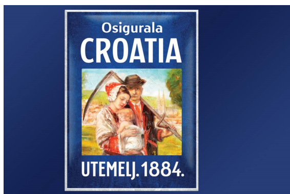
Slika 1: Croatia osiguranje 1884.

To je bila inovacija koja je obilježila osigurateljnu djelatnost i danas predstavlja temeljnu filozofiju osigurateljnog posla. 3 Edward Loyd je 1690. godine u svojoj kavani smještenoj u Tower Streetu privlačio trgovce i brodovlasnike nudeći im važne informacije iz njihova područja djelovanja i uz to osigurateljno pokriće, posebice pomorsko osiguranje. Danas je Loyd vodeći svjetski osiguravatelj i reosiguravatelj i pokriva golemo tržište od preko 200 zemalja svijeta. Osiguranje u Republici Hrvatskoj započelo je osnutkom osiguravajuće zadruge Croatia u Zagrebu 1884. godine za koju je temeljni kapital položilo zagrebačko gradsko poglavarstvo u sklopu borbe protiv ekonomske ovisnosti o strancima. U početku se zadruga bavila samo osiguranjem rizika od požara za grad Zagreb, a kasnije je proširila svoje poslovanje i na druge vrste osiguranja. 4