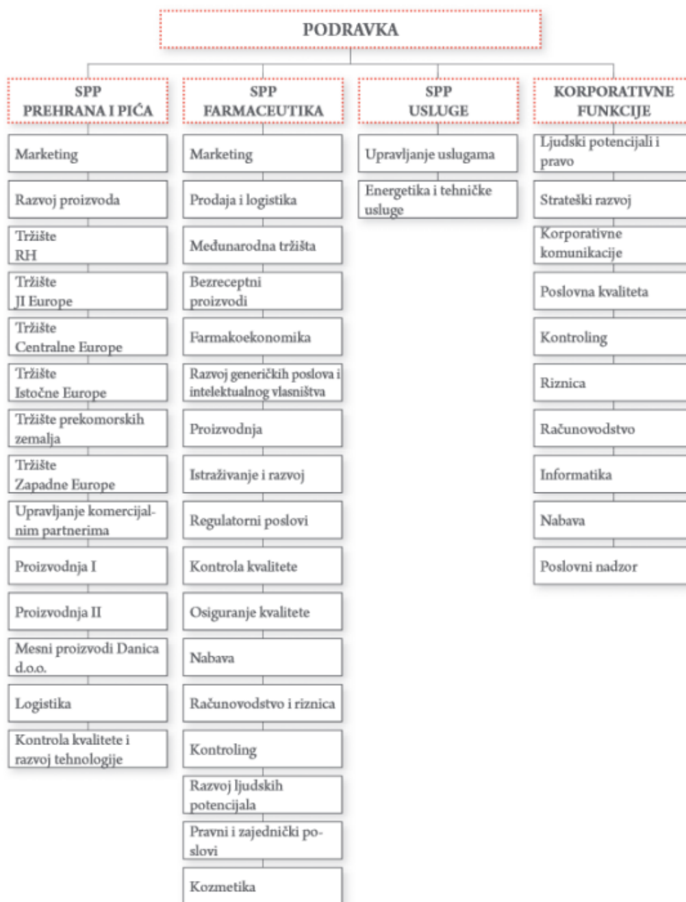
Slika 4: Grafički prikaz organizacijske strukture Podravka d.d.