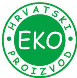
Slika 2: Oznaka ekoloških proizvoda u Hrvatskoj