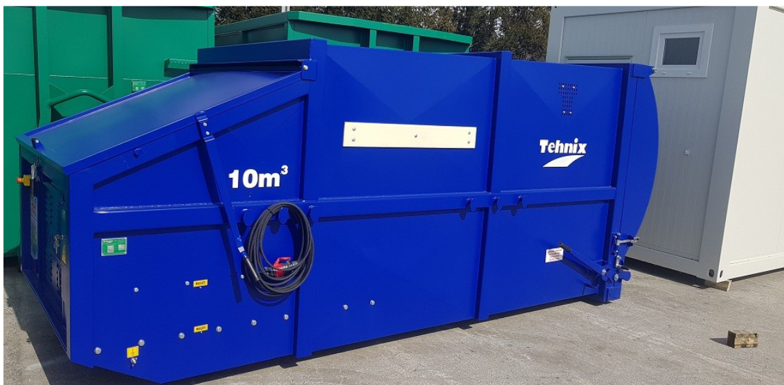
Slika 7: Preskotejner