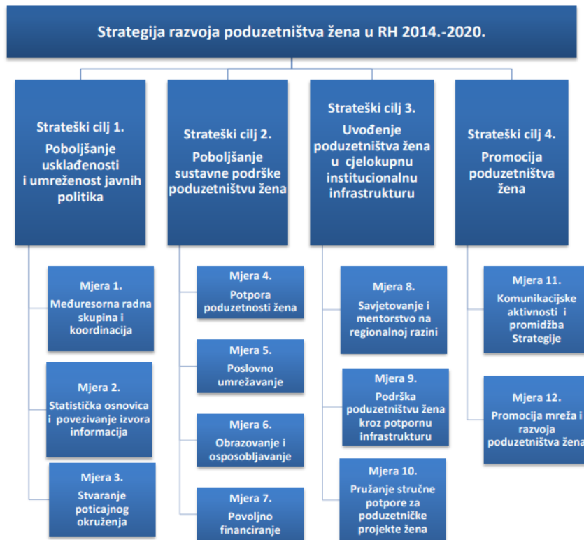
Slika 2:Strateški ciljevi Strategije razvoja poduzetništva