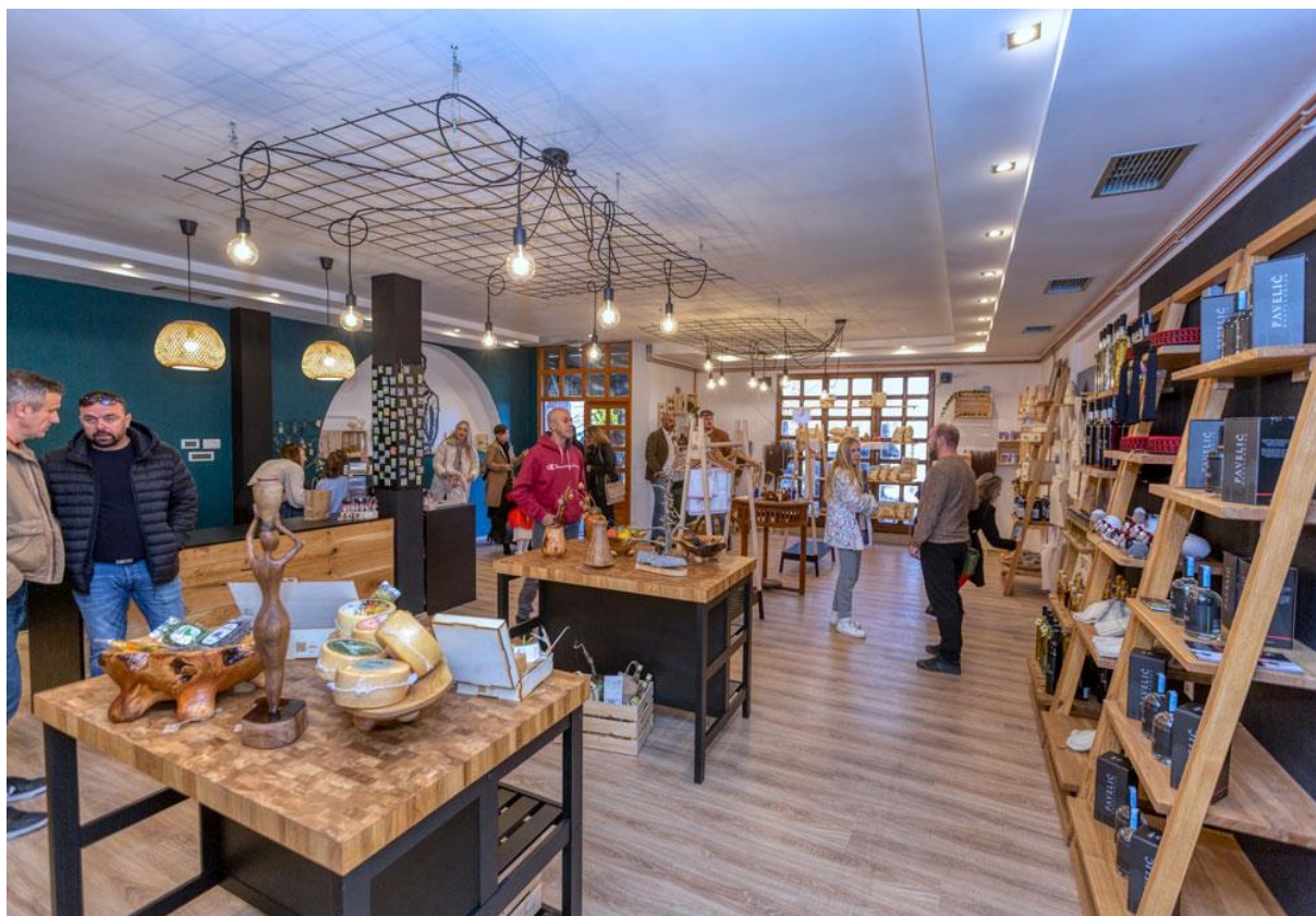
Slika 4: Izgled suvenirnice ZERA