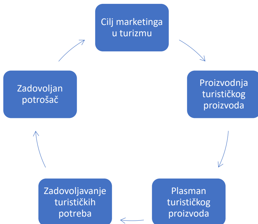
Grafički prikaz 1. Ciljevi marketinga u turizmu