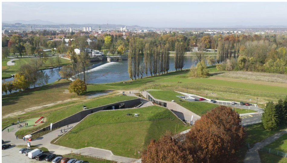
Slika 2. Prikaz Aquatike – Slatkovodnog akvarija Karlovac iz zraka