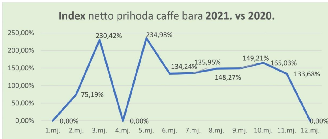
Grafikon 3. Indeks netto prihoda caffe bara 2021. vs. 2020.