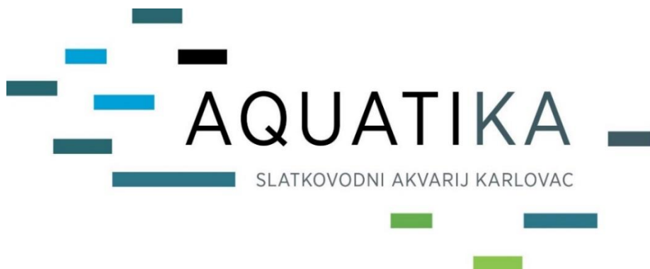
Slika 9. Logo Aquatike – Slatkovodnog akvarija Karlovac