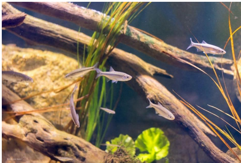
Slika 3. Ribe u Aquatici - Slatkovodnom akvariju Karlovac