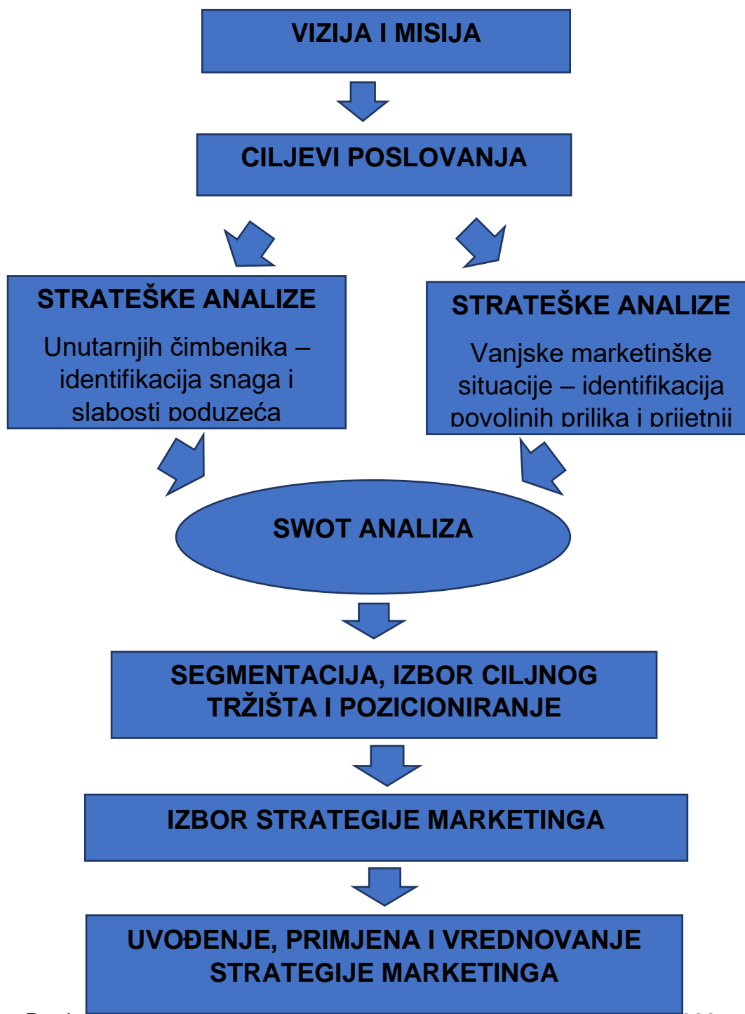
Grafički prikaz 2. Osnovne faze strateškog marketinškog plana

Izvor: Renko, N.; Strategije marketinga, Naklada Ljevak d.o.o., Zagreb, 2009., str. 76.