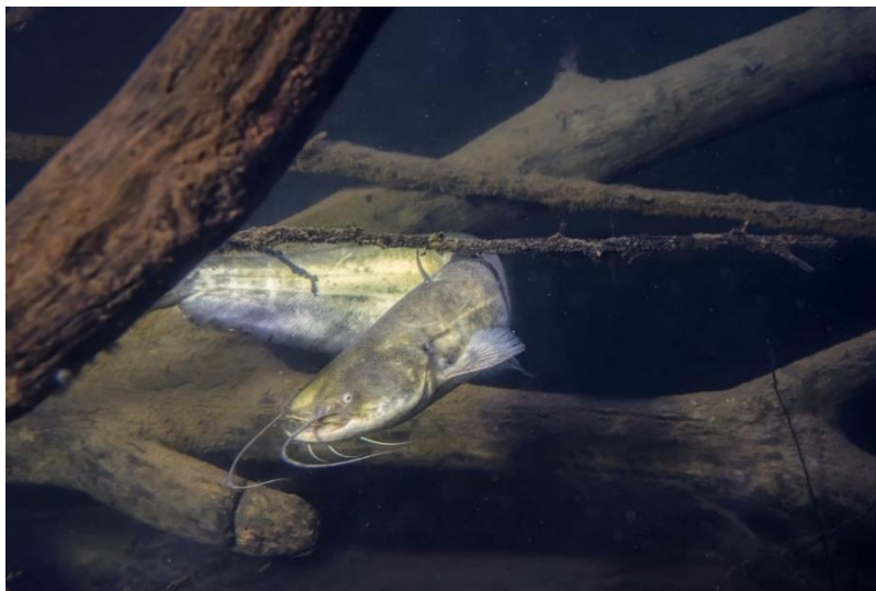
Slika 4. Som u Aquatici – Slatkovodnom akvariju Karlovac