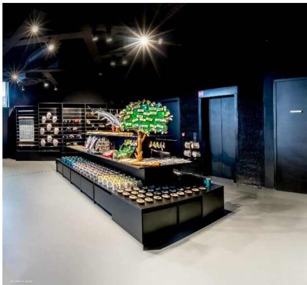
Slika 10. Suvenirnica Aquatike - Slatkovodnog akvarija Karlovac