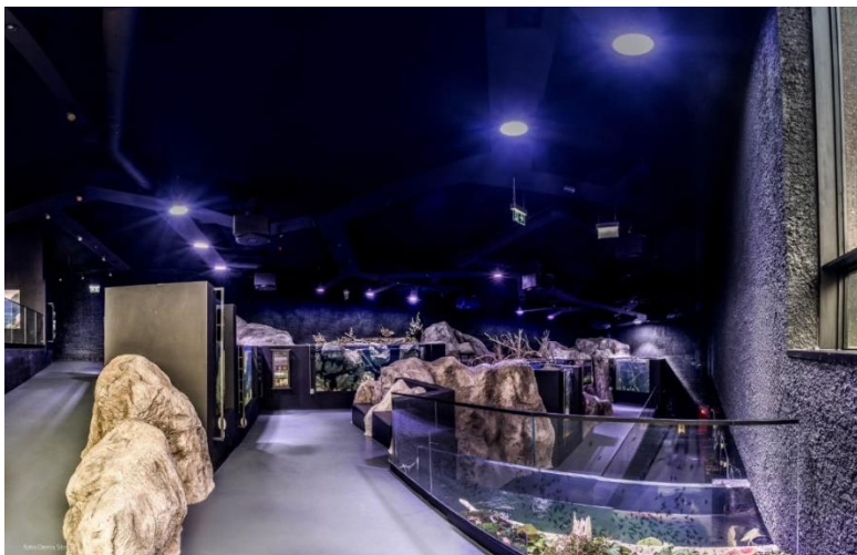
Slika 6. Prikaz ulaza u Aquatiku – Slatkovodni akvarij Karlovac