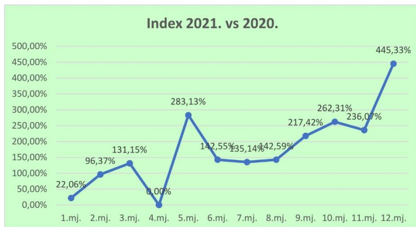
Grafikon 2. Indeks 2021. vs 2020.