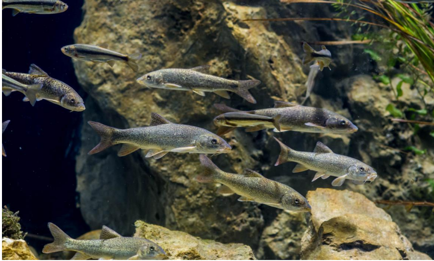
Slika 8. Ribe u Aquatici – Slatkovodnom akvariju Karlovac