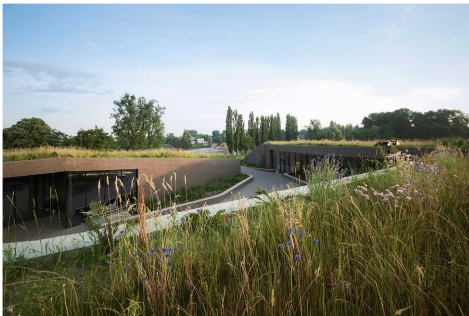
Slika 1. Aquatika – Slatkovodni akvarij Karlovac