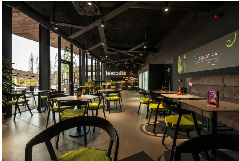
Slika 11. Caffe bar Aquatika – Slatkovodni akvarij Karlovac