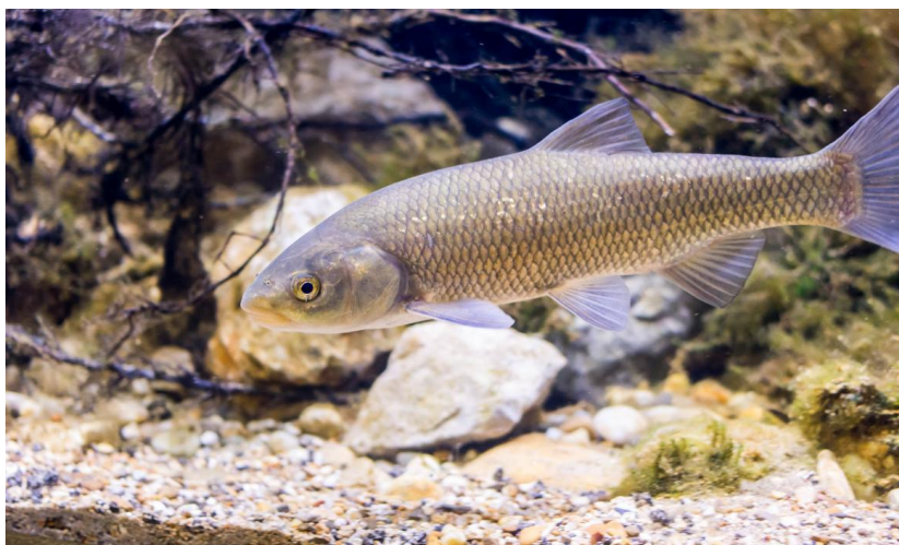
Slika 7. Štuka u Aquatici – Slatkovodnom akvariju Karlovac

Izvor: Profil Klett; https://www.profil-klett.hr/zavirite-u-predivan-rijecni-svijet-posjetite-aquatiku-slatkovodni-akvarij-karlovac , (04.05.2022.)