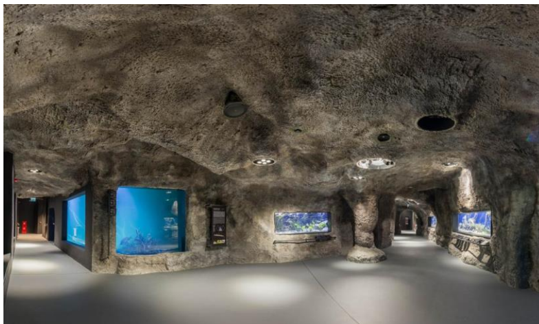
Slika 5. Unutrašnjost Aquatike – Slatkovodnog akvarija Karlovac