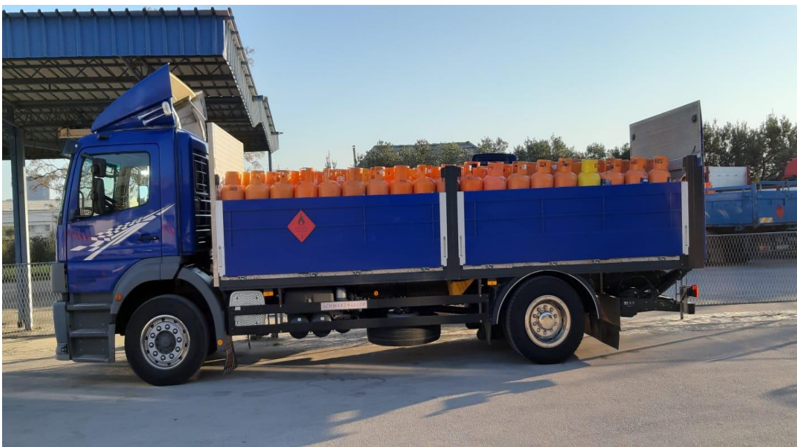
Slika 21. Prijevoz plinskih boca [31]