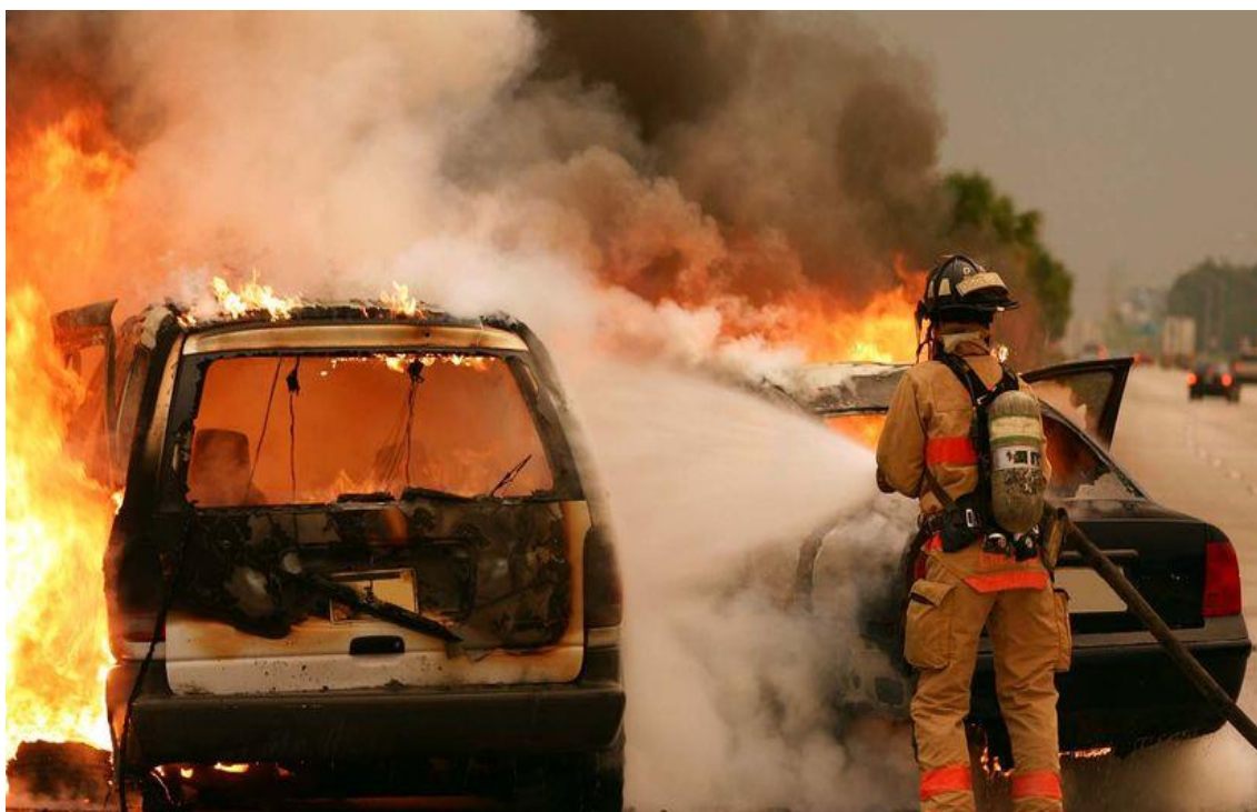
Slika 15. Požar automobila izazvan sudarom vozila [21]

Ovisno gdje je došlo do mjesta udara, sudar automobila može izazvati požar automobila (slika 15.). Većina zona gužvanja vozila su dosta dobro dizajnirane, tako da metalni listovi apsorbiraju snagu udarca i štite unutrašnja, opasna mjesta poput motora, akumulatora, pa čak i spremnika za plin. Ako je vozilo teško oštećeno vjerojatno će uzrokovati tragove curenja tekućine i izlivanje, kao i toplinu i dim, a visoka toplina i prolivene tekućine stvaraju savršene uvjete za požar. Putnicima u slupanom vozilu teško je vidjeti kolika je šteta dok su još unutra, opasnost od požara možda neće biti odmah vidljiva, zato je najbolje što prije pobjeći od oštećenog automobila. Podaci iz SAD-a pokazali su da je samo 4% požara automobila na cestama uzrokovano sudarima, ali oni su obično ozbiljni - dvije trećine smrtnih slučajeva povezanih s požarima automobila dogodilo se nakon sudara [26].