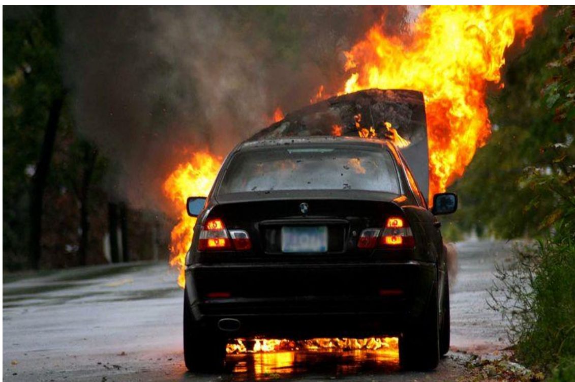
Slika 11. Požar nastao curenjem goriva [21]

Na slici 11. prikazan je najčešći i najopasniji uzrok koji može rezultirati požarom, odnosno samozapaljenjem vozila, a to je curenje goriva. Do curenja goriva može dovesti i prometna nesreća. Tekućine u automobilima imaju korozivna, otrovna i zapaljiva svojstva, među kojima je benzin najopasniji. Benzin se na temperaturi od 7,2°C ili više brzo zapali od jednostavne iskre, što se i događa u automobilskom pogonu, ali ga obuzdava motor. Ako dođe do kvara na sustavu za dovod goriva (npr. oštećenje na cjevovodu, kvar na brtvi pumpe za gorivo i sl.), gorivo tijekom rada motora počinje istjecati u motorni prostor [20]. Curenje goriva na metalne i plastične dijelove može uzrokovati požar koji se brzo širi. Kako bi se spriječio katastrofalan požar ili eksplozija potrebno je pravilno održavanje automobila.