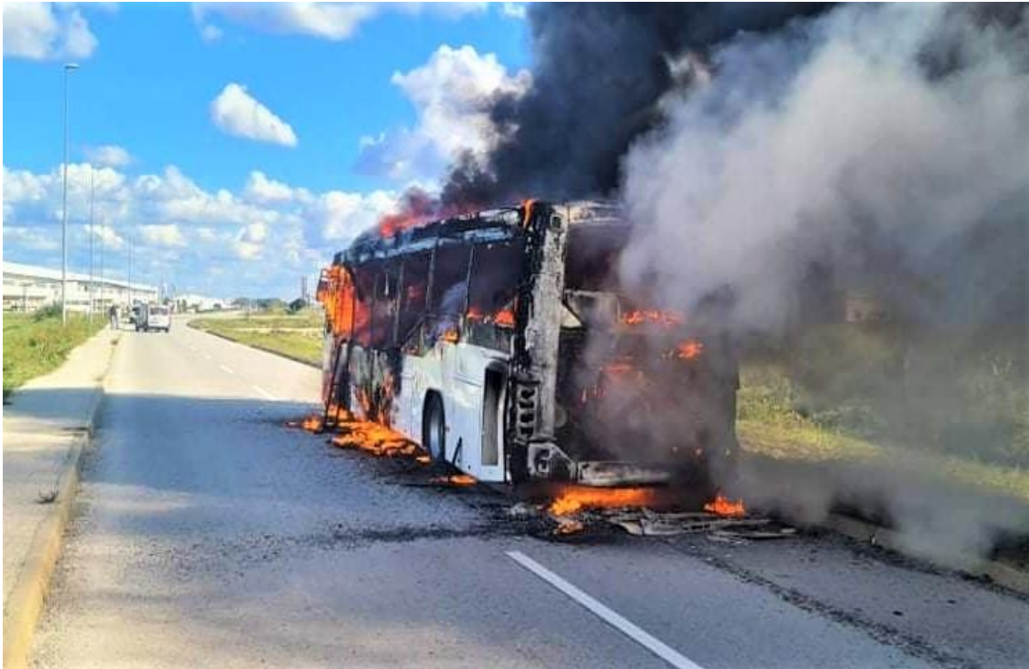
Slika 2. Požar autobusa [6]