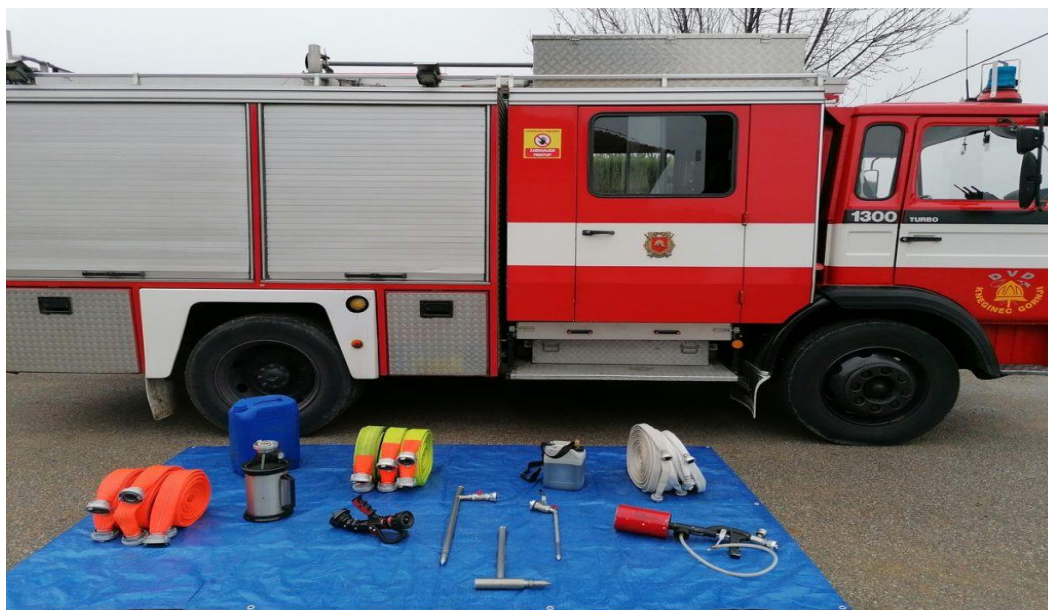
Slika 7. Vatrogasno vozilo za gašenje požara motornih vozila [14]

Na slici 7. prikazano je vatrogasno vozilo koje se koristi u slučaju požara motornih vozila dok je u tablici 1. navedena oprema koja se koristi prilikom gašenja požara motornih vozila.