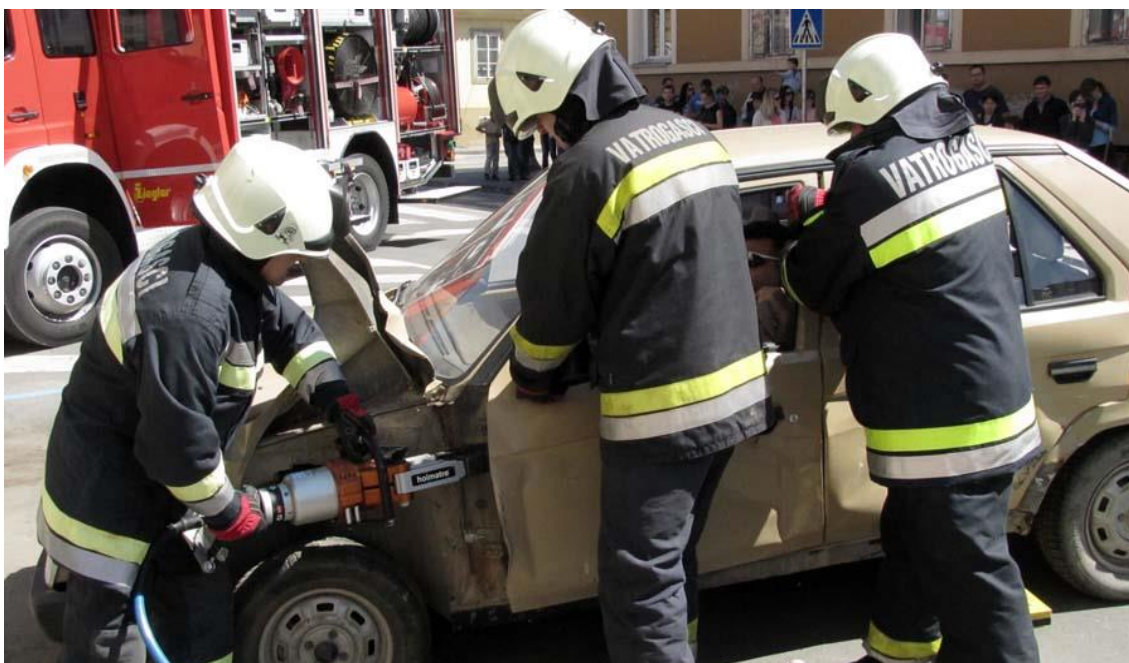
Slika 6. Izvlačenje vozača iz zapaljenog vozila [12]

Vatrogasna intervencija je skup mjera, radnji i postupaka koje provode vatrogasne snage u vremenu od zaprimljene dojave do povratka u vatrogasnu postaju, na temelju zaprimljene dojave ili zapovjedi nadležnog vatrogasnog zapovjednika, zbog nastalog izvanrednog događaja [11]. Vatrogasci će na mjesto događaja pristupiti gašenju požara na vozilu po definiranim pravilima, pri čemu im je glavni cilj u što kraćem vremenu ugasiti požar, spašavanje ljudi, te onemogućavanje širenja požara. Kod nekih slučajeva vatrogasci moraju uništiti vozilo kako bi oslobodili unesrećene koji su ostali zarobljeni, slika 6. Pod uništavanjem vozila podrazumijevamo razbijanje stakla, deformacije na karoseriji radi otvaranja vrata i motornoga prostora. U samom procesu gašenja može doći do pomicanja nekih dijelova vozila, pogotovo otpalih, radi čega neke vatrogasne jedinice dolaze na intervenciju sa snimateljem koji kamerom snima zatečeni požar i tijek spašavanja i gašenja.