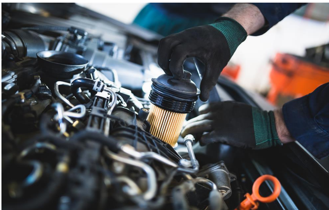
Slika 18. Servisiranje vozila [25]

Vlasnici automobila koji zaboravljaju ili zanemaruju brigu o svom vozilu riskiraju mehanički kvar koji može pridonijeti požaru automobila. Propuštanje vidljivih tragova oštećenja poput polomljenih dijelova, propusne brtve ili neispravne žice koje u konačnici mogu dovesti do opasnog požara dopuštajući curenje zapaljivih tekućina na vruće ispušne kolektore. Kako bi spriječili kvarove i opasnost od požara potrebno je redovno održavanje i servisiranje vozila (slika 18.).