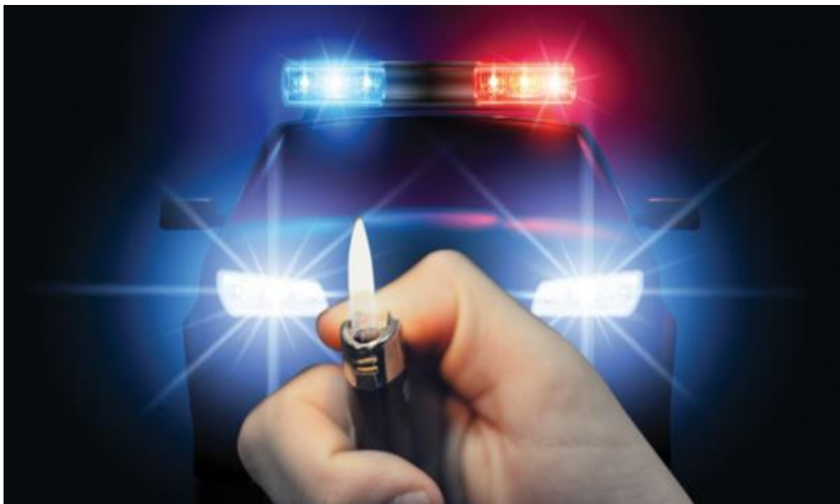
Slika 9. Upaljač [18]

- kako bi se pronašli mogući tragovi koji su ili su bili sastavni dio vozila, a pomažu u samoj rekonstrukciji događaja, i/ili pronalazak tragova koji ukazuju na palež kao što su krpa natopljena lakozapaljivom tekućinom, odbačen čep, kanister, upaljač (slika 9.) i dr.