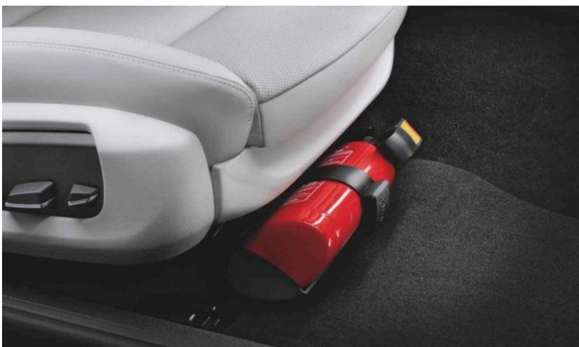
Slika 8. Aparat pričvršćen za sjedalo [17]

Trgovine dodatnom opremom u ponudi imaju razne modele aparata za gašenje požara za automobile. Najbolji aparati za gašenje su od dva kilograma, koji se mogu lako i dobro smjestiti u prtljažnik ili na primjer u nožni prostor iza sjedala, a pritom biste trebali apsolutno slijediti upute proizvođača za instalaciju [16]. Aparat mora biti sigurno pričvršćen na mjesto gdje je brzo dostupan u nuždi, kao što je prostoru za noge na suvozačevoj strani ili na sjedalima, slika 8.