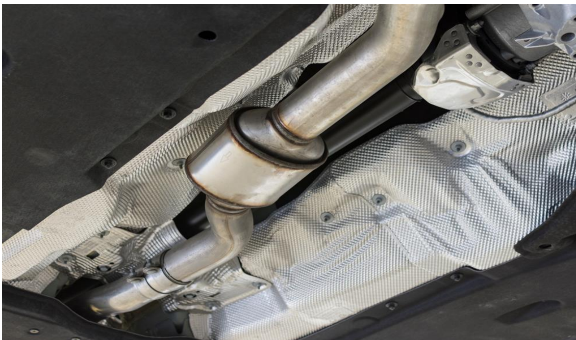
Slika 14. Katalizator [25]

Ispušni sustav je jedan od najtoplijih dijelova vozila i proteže se cijelom dužinom vozila. Primarna zadaća ispušnog sustava je uklanjanje prljavštine bilo koje vrste, koja nastaje prilikom sagorijevanja goriva, dok je sekundarna zadaća njihovo neutraliziranje, kako bi bili što manje štetni po naše zdravlje [24]. Ta zadaća se odnosi na katalizator (slika 14.), koji previše radi da bi sagorio više zagađivača ispušnih plinova nego što su dizajnirani za obradu. Odnosno ako motor automobila ne radi učinkovito (zbog istrošenih svjećica ili bilo kojeg broja drugih nepovoljnih uvjeta), on ne sagorijeva gorivo kako treba. Bilo kakva lakozapaljiva tvar u izravnom dodiru s njegovom pregrijanom površinom ili na dovoljno maloj udaljenosti od njega može dovesti do pojave požara. Naime, kako razmak između podnica osobnih automobila i tla iznosi prosječno samo 10 do 15 cm (s izuzetkom u terenskih automobila), površina tijela katalizatora zagrijanog na tako visoku temperaturu može uzrokovati zapaljenje lakozapaljive tvari koja se zatekne ispod tijela katalizatora i to nedugo nakon što je vozilo parkirano na mjestu prekrivenom otpacima takvih tvari [9].