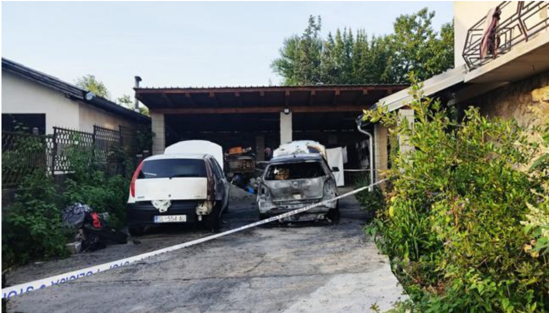
Slika 1. Požar osobnih automobila [5]