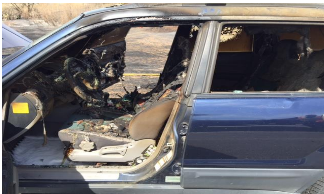
Slika 16. Požar vozila nastao opuškom cigarete [27]

Kako dio vozača i/ili putnika osobnih automobila ima (ne samo za sigurnost upravljanja vozilom) vrlo lošu naviku paliti i pušiti cigarete ili cigare tijekom vožnje, u svim takvim slučajevima se uvijek mora razmotriti i istražno provjeriti mogućnost nastanka požara, s ishodištem u prostoru kabine vozila, pod možebitnim pripaljujućim djelovanjem žara neugašene cigarete (ispale na neku od lakozapaljivih tvari u kabini vozila) ili tinjajućeg izgaranja posve neugašenog opuška u pepeljari punoj opušaka, papirnatih maramica ili komadića papira [9] . Neugašeni opušak izbačen kroz prozor vjetar može vratiti nazad u vozilo , a ako vozač to ne primijeti, može doći do uništenja i požara (slika 16.).