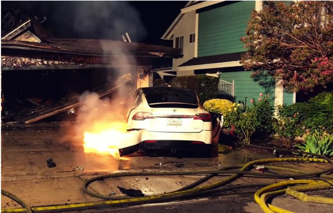
Slika 22. Požar električnog vozila [34]

Pri gašenju požara potrebno je uzeti u obzir: