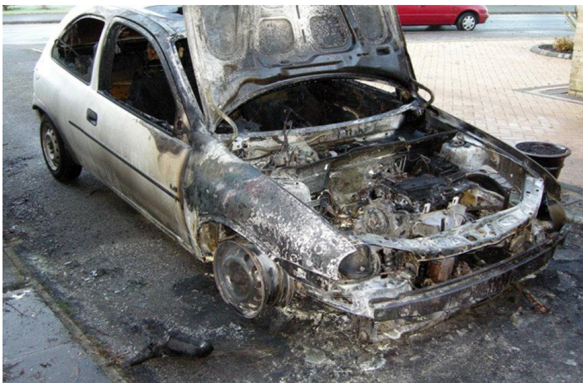
Slika 10. Požar u motornom prostoru vozila izazvan curenjem zapaljive tekućine

Sustavi putničkih vozila ispod haube sadrže kemijske tekućine koje su opasne za ljude i vrlo zapaljive. Benzin ili dizel gorivo, ulje, tekućina za prijenos, tekućina za kočnice, rashladna tekućina hladnjaka i tekućina za servo upravljač. Sve te tekućine cirkuliraju kada je automobil upaljen. Ako crijeva puknu doći će do curenja tekućine koja se sama od sebe ne bi trebala zapaliti ali u kombinaciji s drugim otežavajućim čimbenikom kao što je sudar automobila, može dovesti do požara. Ovakav požar će u većini slučajeva izbiti u motornom prostoru (slika 10.), gdje se nalazi većina opasnih tekućina. Neke od tekućina kao što su benzin ili dizel i kočiona tekućina, kreću se cijelom dužinom vozila, što predstavlja opasnost od požara u cijelom vozilu.