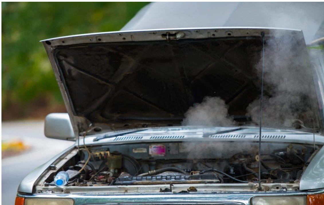
Slika 13. Pregrijavanje motora [23]