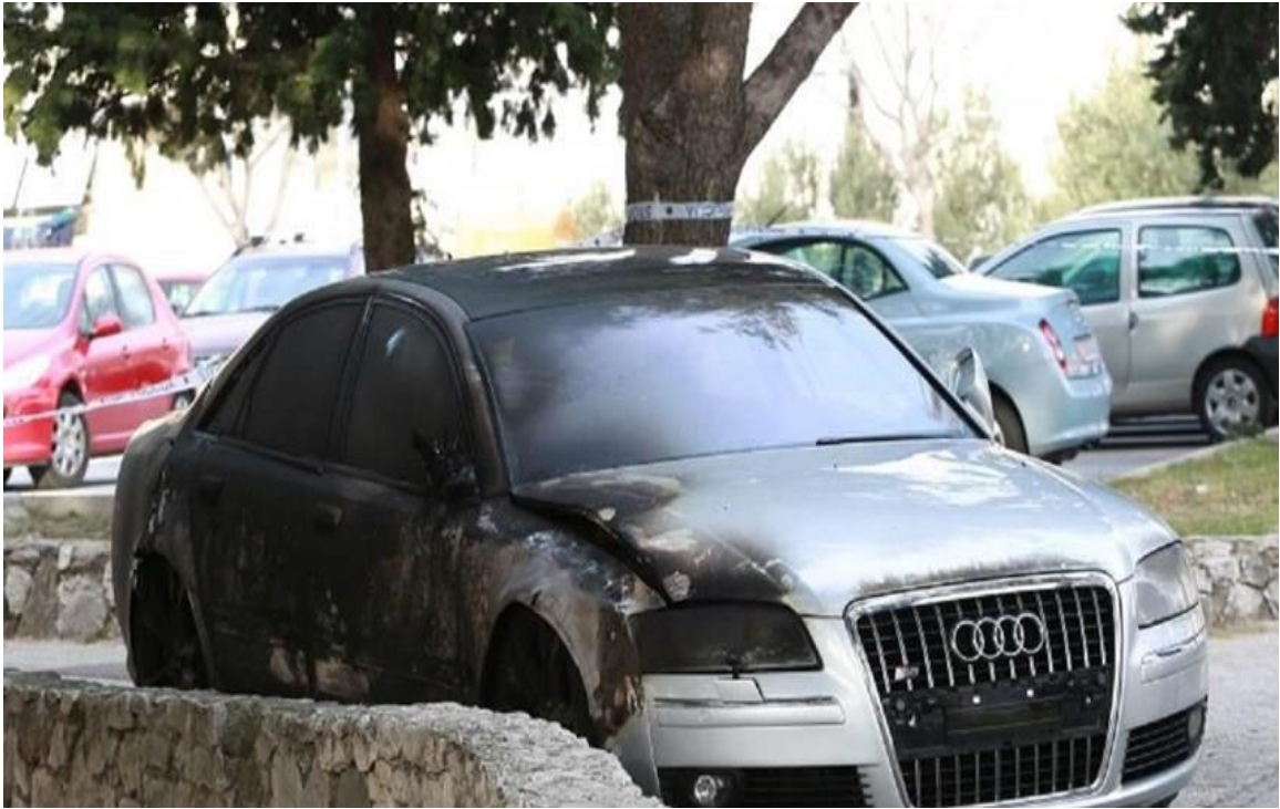
Slika 17. Palež vozila [28]