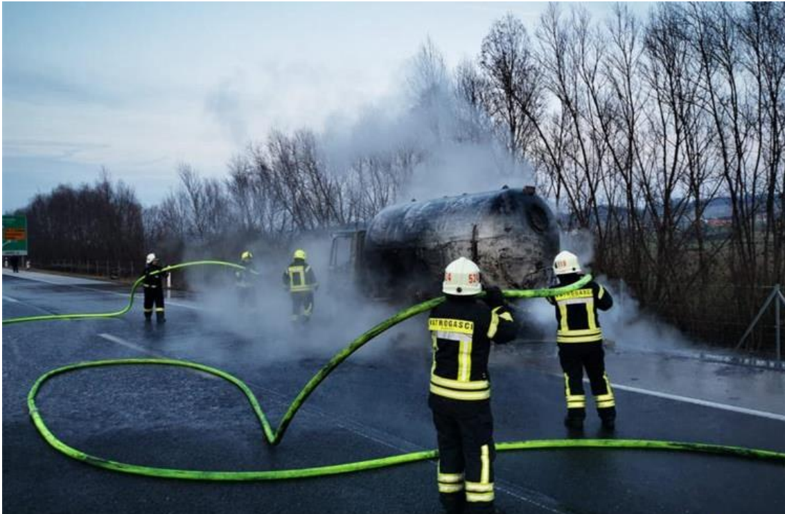
Slika 3. Požar autocisterne [7]