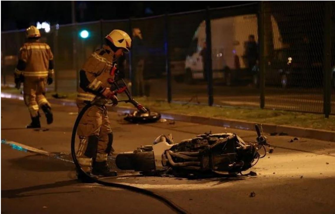
Slika 4. Gašenje zapaljenog motora [8]