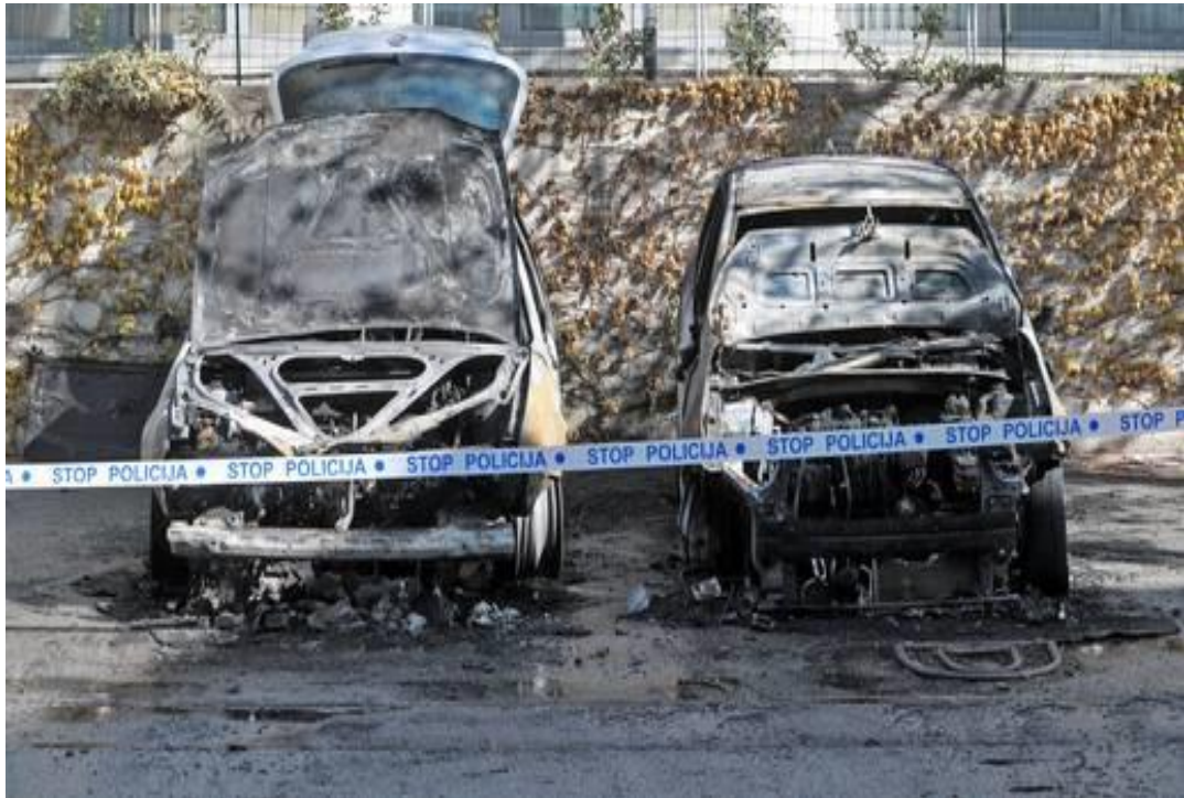
Slika 5. Označavanje mjesta događaja vidljivom trakom [10]

Iako osiguranje mjesta događaja ovisi o objektivnim okolnostima konkretnog slučaja, vrsti i prirodi tragova, lokaciji mjesta, atmosferskim prilikama, postoji ipak nekoliko osnovnih određenih, uvijek važećih pravila koja se primjenjuju općenito za sve slučajeve i uvijek, a to su: