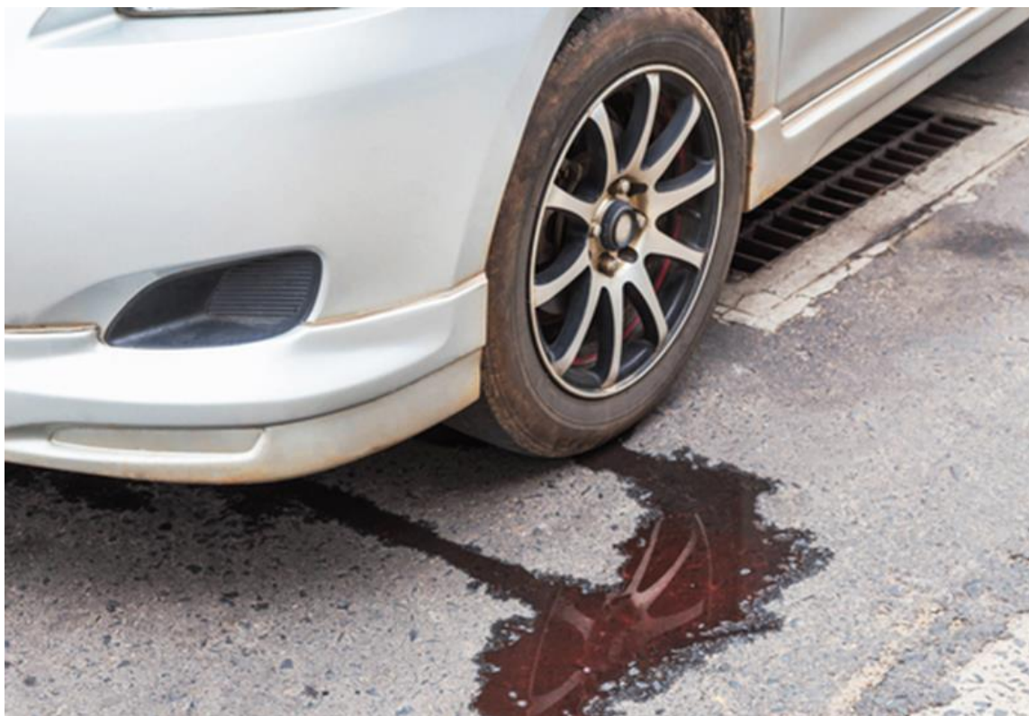
Slika 19. Curenje ulja [29]