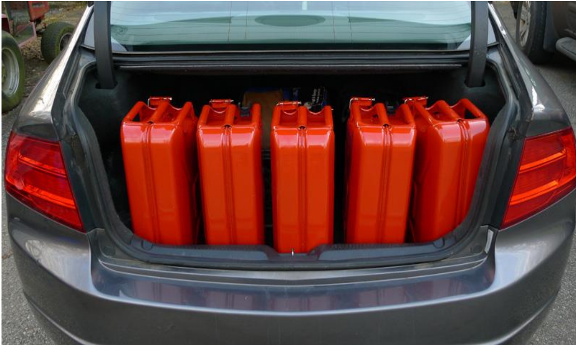
Slika 20. Transport benzina [30]