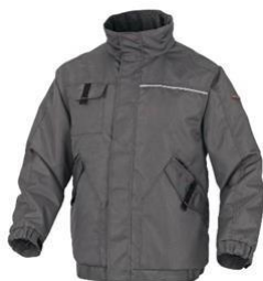
Slika 13. Zimska jakna. [17]