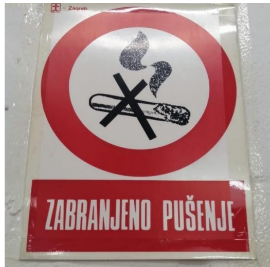
Slika 23. Zabranjeno pušenje. [13]