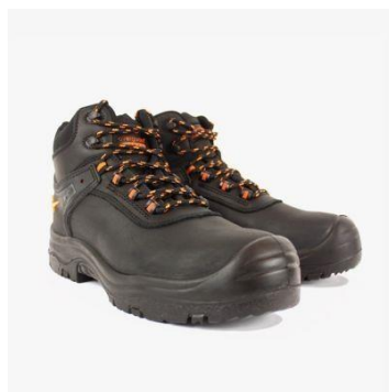
Slika 9. Radne cipele. [18]