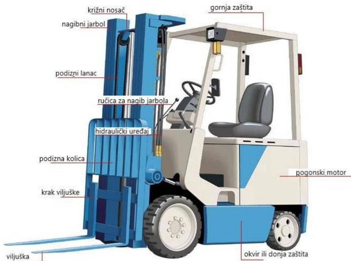
Slika 1. Dijelovi viličara. [3]

Dijelovi viličara (slika 1.) su kao što je navedeno na slici vilice koje služe za utovar, istovar i premještanje robe, krak vilice koji je robusna konstrukcija otporna na uvrtnje, podizna kolica koja se podvezu pod teret i pomoću njih se isti preveze na