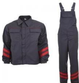
Slika 11. Radno odijelo – farmer. [15]