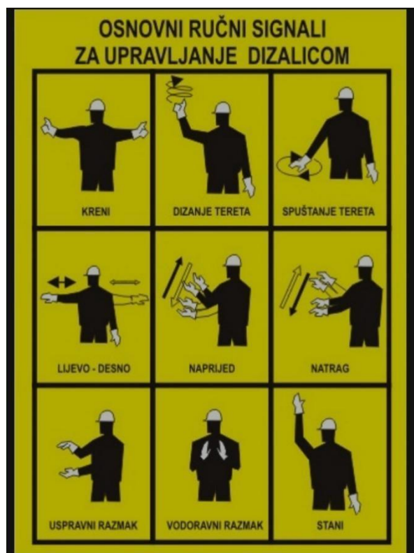
Slika 17. Ugovoreni signali za signalistu kod upravljanja dizalicom. [14]

Prijenos tereta pomoću viličara obavezno se obavlja sa spuštenim vilicama koje su nagnute prema konstrukciji viličara.