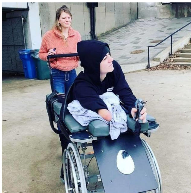
Slika 24. Stradali 19-ogodišnjak. [23]

Nesreća se dogodila u rujnu 2019. godine kada se u Montani popravljao most. Na mostu se našao automobil koji tamo nije trebao biti te je vozač viličara bio primoran naglo skrenuti kako bi ga izbjegao. Došao je preblizu rubu, dio mosta urušio ispred njega te je on pao 15 metara u dubinu. Pokušao je iskočiti van, ali noga mu je bila zapela u sigurnosnom pojasu. Imao je sreće što je tlo na koje je pao bilo mekano jer su radnici na tom mjestu kopali inače bi poginuo. Ovako je ostao bez pola dijela tijela, od struka nadalje. [22]