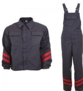
Slika 6. Radno odijelo – farmer. [15]