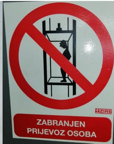
Slika 22. Zabrana osoba. [13]