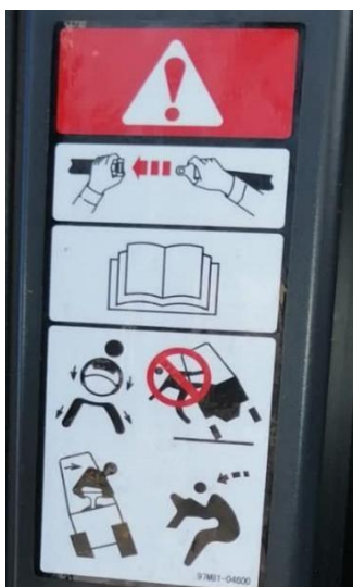
Slika 16. Upozorenje za korištenje sigurnosnog pojasa. [13]

Nažalost, sigurnosni pojas može izazvati neke ozljede. Pri naglom kočenju pojas može zasjeći vozača jer se u tom slučaju tijelo savija u pojasu. Uz to, pojas može izazvati i ozbiljne unutarnje ozljede abdomena ako je prejako pričvršćen.