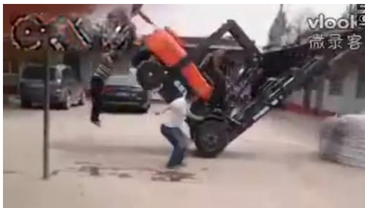
Slika 25. Pad viličara na radnika [25]

Nesreća se dogodila u krugu tvrtke u Vrpolju kod Slavanskog Broda. Do iste je došlo kada je vozač viličara spustio lijevu stranu radnog stroja. U tom trenutku se ispod viličara nalazio drugi radnik. Radnik je nažalost zadobio ozbiljne ozljede od kojih je ubrzo i preminuo na samom mjestu nesreće. Vozaču viličara uzeta je krv i urin kako bi se utvrdile sve okolnosti i uzrok nesreće. [24]