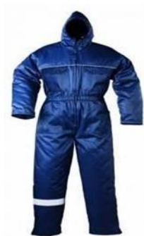
Slika 12. Zimski kombinezon. [16]