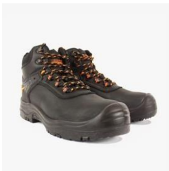
Slika 14. Radne cipele. [18]