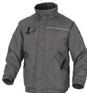
Slika 8. Zimska jakna. [17]