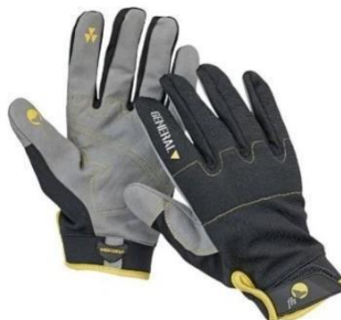
Slika 10. Zaštitne rukavice. [19]