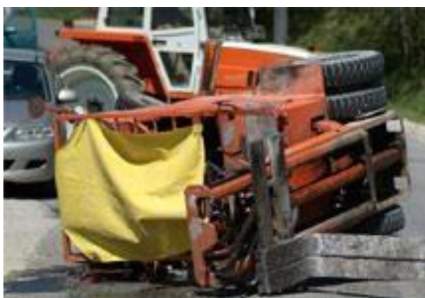
Slika 26. Prevrnuti viličar. [27]

Nesreća se dogodila u mjestu Mala Rakovica kod Samobora. Radnik je vozio viličar prevelikom brzinom koji je k tome bio i neispravan. Prednjim desnim udario je u rubni kamen te se viličar prevrnuo. Radnik je zadobio teške tjelesne ozljede, ali nije bio u životnoj opasnosti. Viličar nije imao ni registarske oznake.[26]