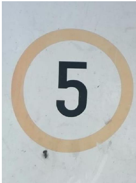
Slika 21. Ograničenje brzine u prijevozapostrojenju. [13]