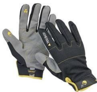
Slika 15. Zaštitne rukavice. [19]