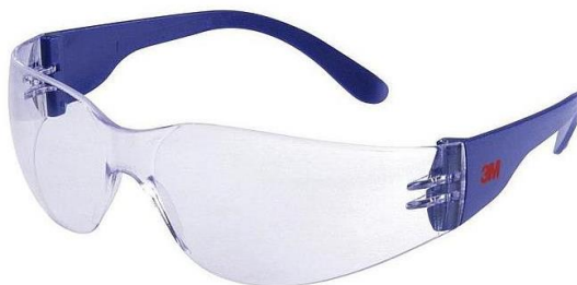
Slika 14. Zaštitne naočale. [26]

temperature) i otpornost na koroziju. Specifikacije ove norme ne primjenjuju se na osobna zaštitna sredstva za zaštitu očiju od laserskog zračenja ili osobna zaštitna sredstva za zavarivanje već su ta sredstva određena posebnim vlastitim normama.