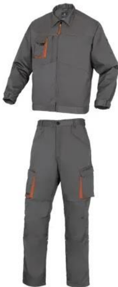
Slika 10. Zaštitno dvodijelno odijelo. [21]

Zaštitno odijelo mora zadovoljavati normi HRN EN 340 koja je danas zamijenjena normom HRN EN ISO 13688:2013.