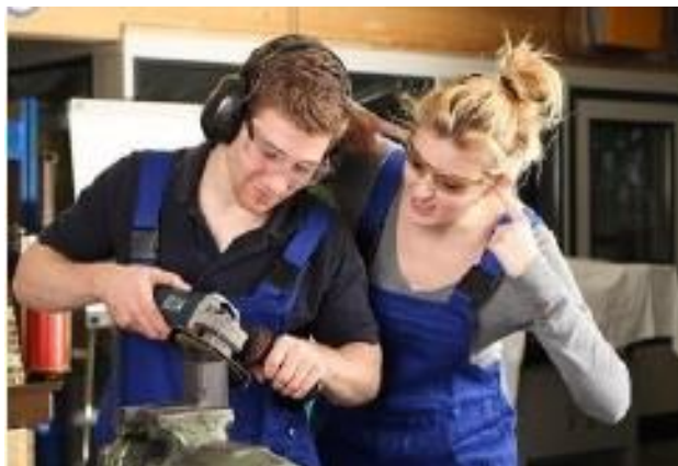
Slika 7. Buka prilikom obrade metala brušenjem. [10]

Slika 7. prikazuje jedan od mnogih mogućih izvora buke prilikom obrade metala, a to je dorada brusilicom.