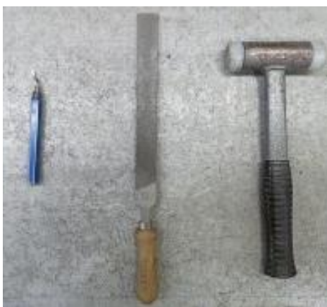
Slika 4. Ručni alat. [5]

Prilikom rukovanja ručnim alatima (slika 4.), zbog njihove rasprostranjenosti i široke primjene, postoji opasnost od velikog broja nezgoda. Posljedice takvih nezgoda mogu biti manja ili veća unesrećenja radnika. CNC operateri na svom poslu koriste ručne alate kao što su odvijači, ključevi, čekići (gumeni ili metalni), strugači (šaberi), nareznice, ureznice i slično. Svaki od tih alata predstavlja potencijalnu opasnost za radnika.