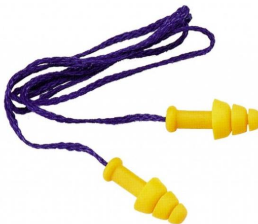
Slika 16. Zaštitni ušni čepići. [28]

Zaštitni ušni čepići moraju zadovoljavati normi HRN EN 352-2:2020.