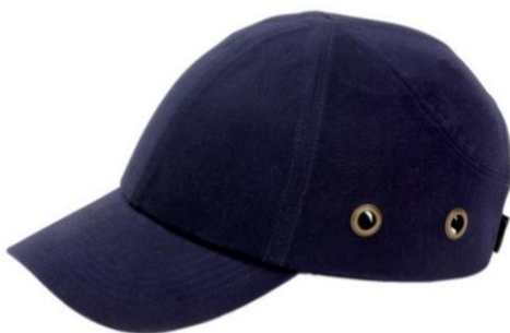
Slika 11. Zaštitna kapa. [23]

Zaštitna kapa mora zadovoljavati normi HRN EN 812:2012. Način testiranja i zahtjevi ove norme slični su onima iz HRN EN 397:2013, ali im je razina smanjena zbog toga što se koriste kod obavljanja poslova gdje stvarni rizici od ozljede glave nisu veliki, a zaštitna kaciga umanjila bi udobnost korisnika. Najčešće se radi o platnenoj kapi koja štiti glavu radnika od ogrebotina i drugih površinskih ozljeda kože prilikom slučajnih udaraca o tvrde predmete, ali ne i od padajućih ili bačenih predmeta te se zbog toga nikako ne smije miješati s kacigom.