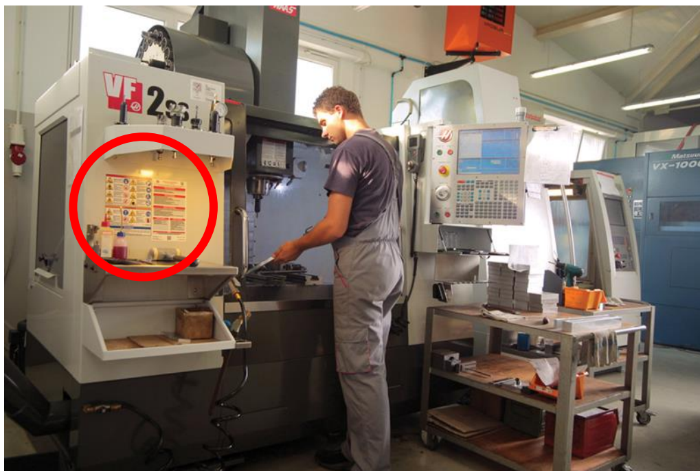
Slika 9. Upute za siguran rad na lako uočljivom mjestu za radnika. [4]