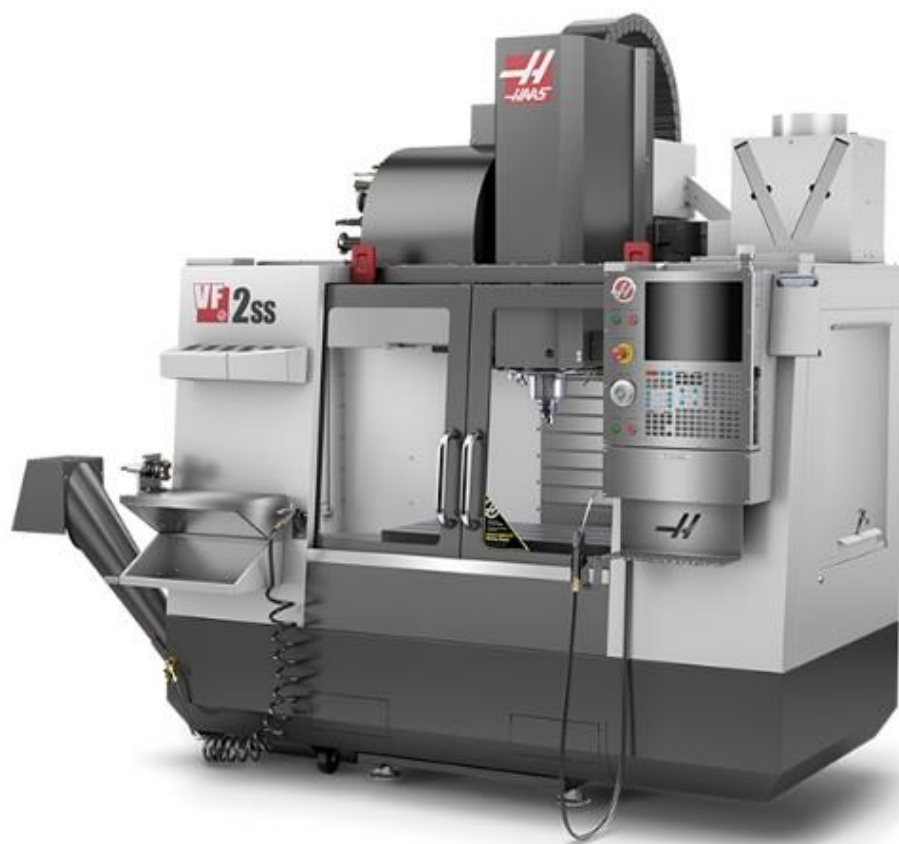
Slika 2. CNC glodalica HAAS VF-2SS. [3]