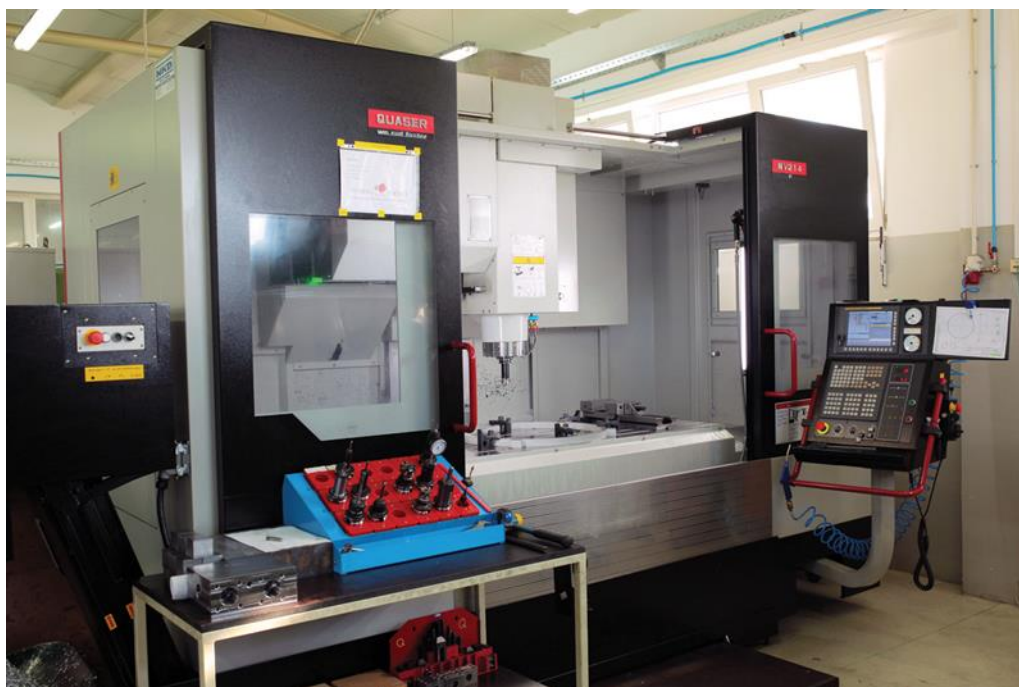
Slika 3. Radno mjesto CNC operatera. [4]

Slika 3. prikazuje prostor ispred stroja u kojem se kreće i radi CNC operater, odnosno njegovo radno mjesto.