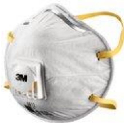
Slika 15. Zaštitna maska. [27]

Zaštitna maska mora zadovoljavati normi HRN EN 132:2004, odnosno mora biti napravljena od filtrirajućeg materijala (gaze, celuloze ili specijalno složenih papira) s ventilima za udah ili bez njih. Norma HRN EN 132:2004 je danas zamijenjena normom HRN EN ISO 16972:2020. Filtarske polumaske ili respiratori su zapravo čestični filtri, kod kojih je filtarski medij najčešće čitavo tijelo respiratora. Ovi respiratori djeluju na temelju podtlaka, jer se protok zraka kroz filter postiže usisavanjem (inhalacijom) vanjskog zagađenog zraka. Pritom štetne čestice zaostaju djelomice na vanjskoj površini, a većinom unutar strukture filtarskog medija. Filtrirani zrak zatim ulazi direktno u nos ili usta korisnika. Ova vrsta respiratora služi za zaštitu od čestica čvrstih i tekućih aerosola (prašine) te bio aerosola. Izdahnuti zrak izlazi kroz filtarski materijal ili ispušni ventil (ako postoji) u vanjsku atmosferu.