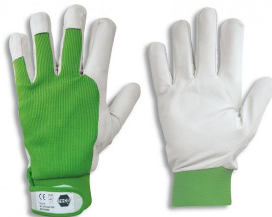
Slika 13. Zaštitne rukavice. [25]

Zaštitne rukavice za zaštitu od mehaničkih rizika moraju zadovoljavati normi HRN EN 388:2019.