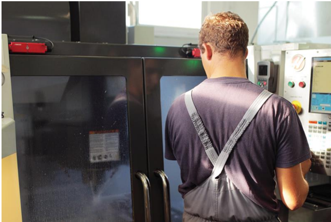
Slika 8. Zatvorena sigurnosna vrata s kaljenim staklom prilikom obrade. [4]