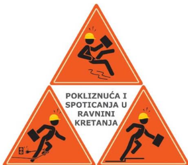
Slika 6. Pokliznuća i spoticanja u ravnini kretanja. [8]

Na slici 6. prikazani su primjeri pokliznuća i spoticanja.