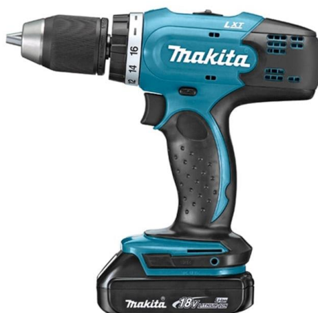
Slika 5. Mehanizirani alat (AKU bušilica-odvijač). [6]

Pod radom s mehaniziranim alatom (slika 5.) smatramo korištenje različitih bušilica i brusilica (danas su većinom baterijske) koje operateru pomažu i olakšavaju prilikom skidanja srhova na većim površinama izratka, pročišćavanju provrta i navoja, štede mu vrijeme izrade, ali predstavljaju veći rizik nego ručni alati.