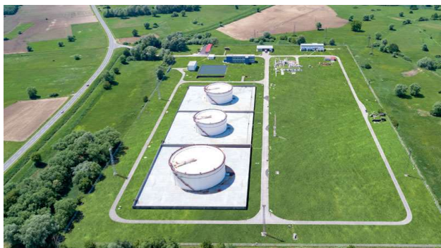
Sl. 5. Terminal Virje [5]

Dionica naftovoda od Terminala Sisak preko Terminala Virje do Szazhalombatte (Mađarska) je reverzibilna, odnosno osigurana je mogućnost transporta nafte u oba smjera, kroz jedan cjevovod naizmjenično.