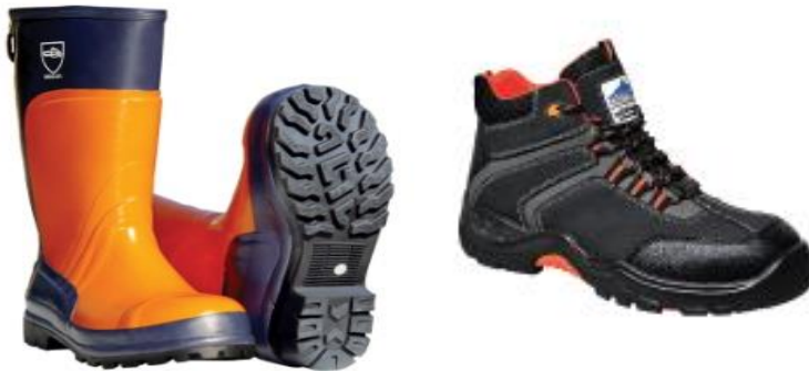
Slika 8. Sredstva za zaštitu nogu