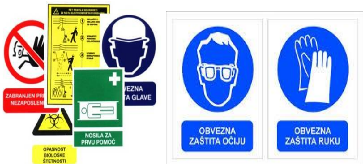
Slika 1. Znakovi sigurnosti

Znakove sigurnosti izrađujemo prema Pravilniku o sigurnosnim znakovima (N.N. 29/05.) te HRN-u 7010.