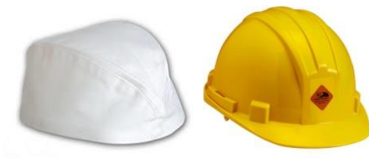
Slika 3. Zaštitne kacige