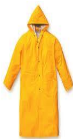
Slika 10. Sredstva za zaštitu od nepovoljnih atmosferskih utjecaja