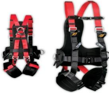
Slika 11. Sredstva za zaštitu od pada s visine