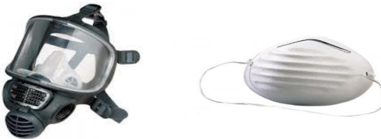
Slika 6. Sredstva za zaštitu dišnih organa