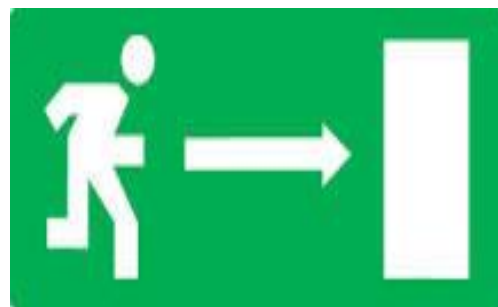
Slika 2. Plan evakuacije i spašavanja