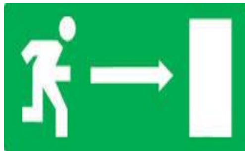
Slika 2. Plan evakuacije i spašavanja