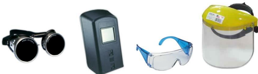
Slika 4. Zaštitne naočale i štitnici