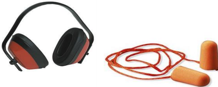
Slika 5. Sredstva za zaštitu sluha