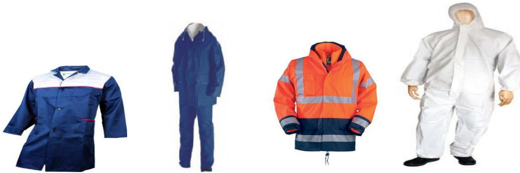
Slika 9. Sredstva za zaštitu tijela