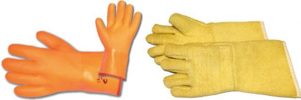
Slika 7. Sredstva za zaštitu ruku