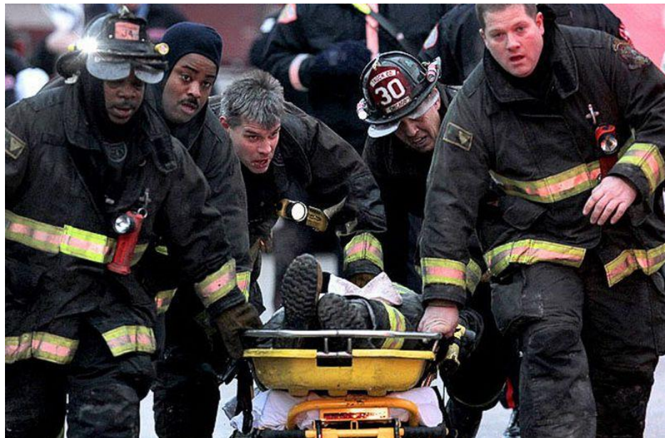
Slika 1. Prikaz spašavanja vatrogasaca