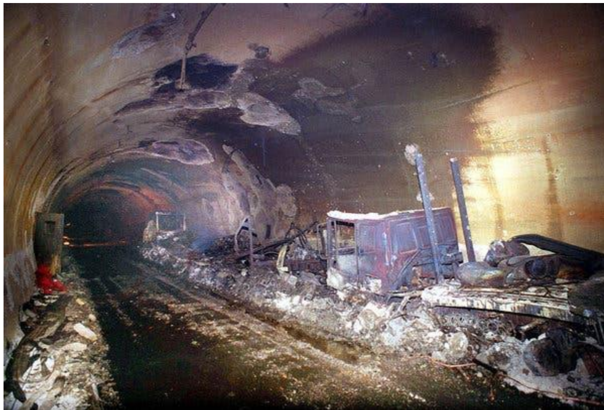
Slika 3. Požar u Mount Blancu