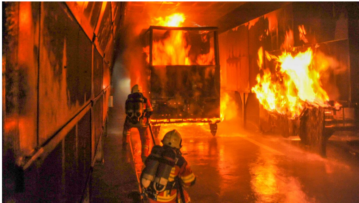
Slika 2. Prikaz intervencije u tunelu