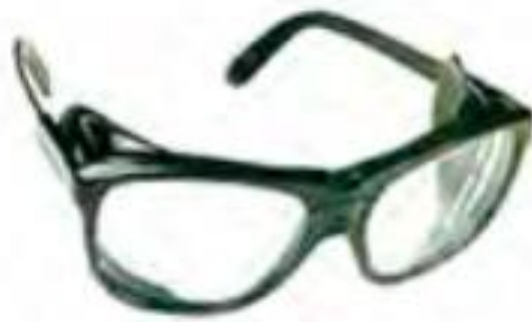
Slika 2. Zaštita očiju i lica - zaštitne naočale s bočnom zaštitom s ciljem zaštite od letećih čestica [5]