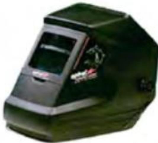
Slika 3. Zaštita očiju i lica štitnikom za elektrovarivače - zaštita od toplinskog i ultraljubičastog zračenja (nekorištenje zaštitne opreme može uzrokovati teško oštećenje vida) [5]