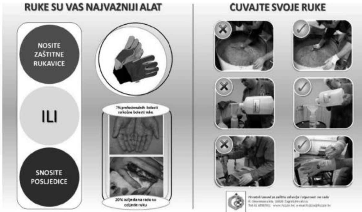
Slika 4. Letak pod nazivom „Ruke su vaš najvažniji alat“ [6]

Osim rukavica, zaštitu ruku čine: naprstak, štitnici za prste, dlan ili nadlakticu, za ručni zglob i druga zaštitna sredstva. S obzirom na način svoje primjene, zaštitne rukavice su oprema koja bi trebala štiti osobu od mogućih mehaničkih, toplinskih, kemijskih i ostalih opasnosti. Takva radna oprema mora zadovoljavati stroge kriterije te norme za pojedine vrste. Europa se zalaže za proizvodnju rukavica za sigurnost ruku od svih mogućih opasnosti. Takva radna oprema mora biti proizvedena u skladu s normom ISO 9002. Tijekom ozljeda na radu, 7% profesionalnih bolesti od ukupnog broja su bolesti ruku. Evidentirajući ukupni broj ozljeda na radu, dolazi se do podatka da je 20% ozljeda ruku. Kako bi to prevenirali, stručnjaci sigurnosti i zaštite preporučuju korištenje zaštitne opreme [6].