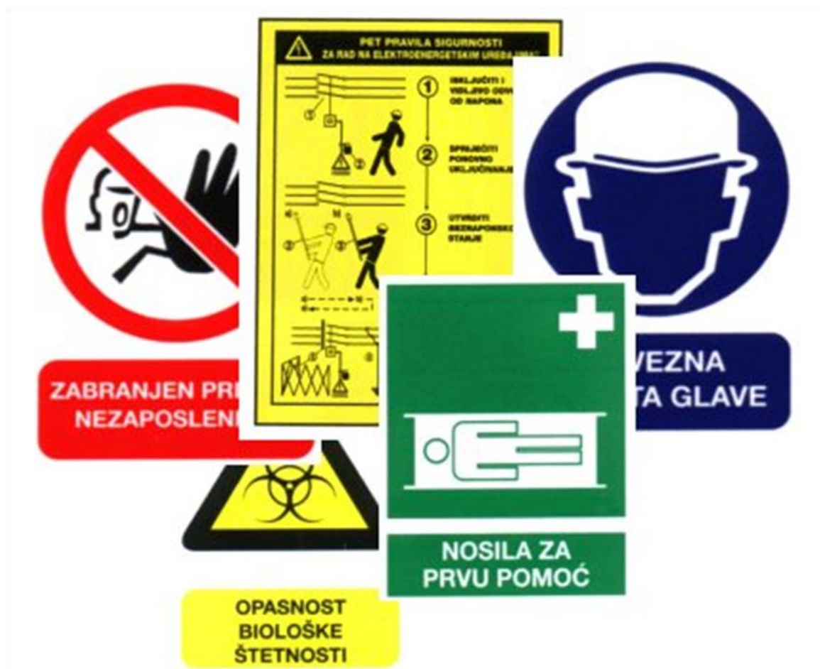
Slika 9. Upozorenja za osobna zaštitna sredstva [5]