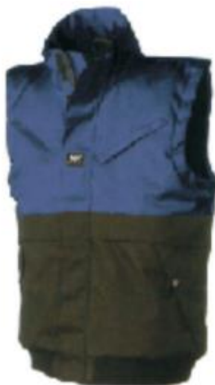
Slika 7. Zimski prsluk [5]