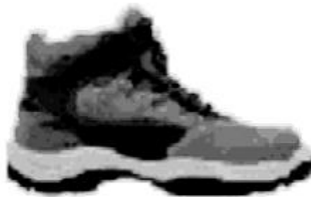
Slika 5. Zaštitna cipela visoka SUOLE DIELETRICHE 02 [5]

Tip zaštitne opreme za noge koja je bila prisutna na izgradnji dvorane: