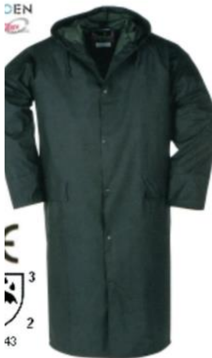
Slika 6. Kišna kabanica [5]

Prilikom izgradnje objekta dvorane, zaštitna odjeća koju su djelatnici koristili su bile kišne kabanice (zbog nepovoljnih uvjeta koji su bili prisutni prije izgradnje krova) te također zimska zaštitna oprema (zimski prsluk, kombinezon).