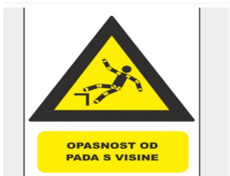
Slika 12. Pad s visine – znak opasnosti [10]