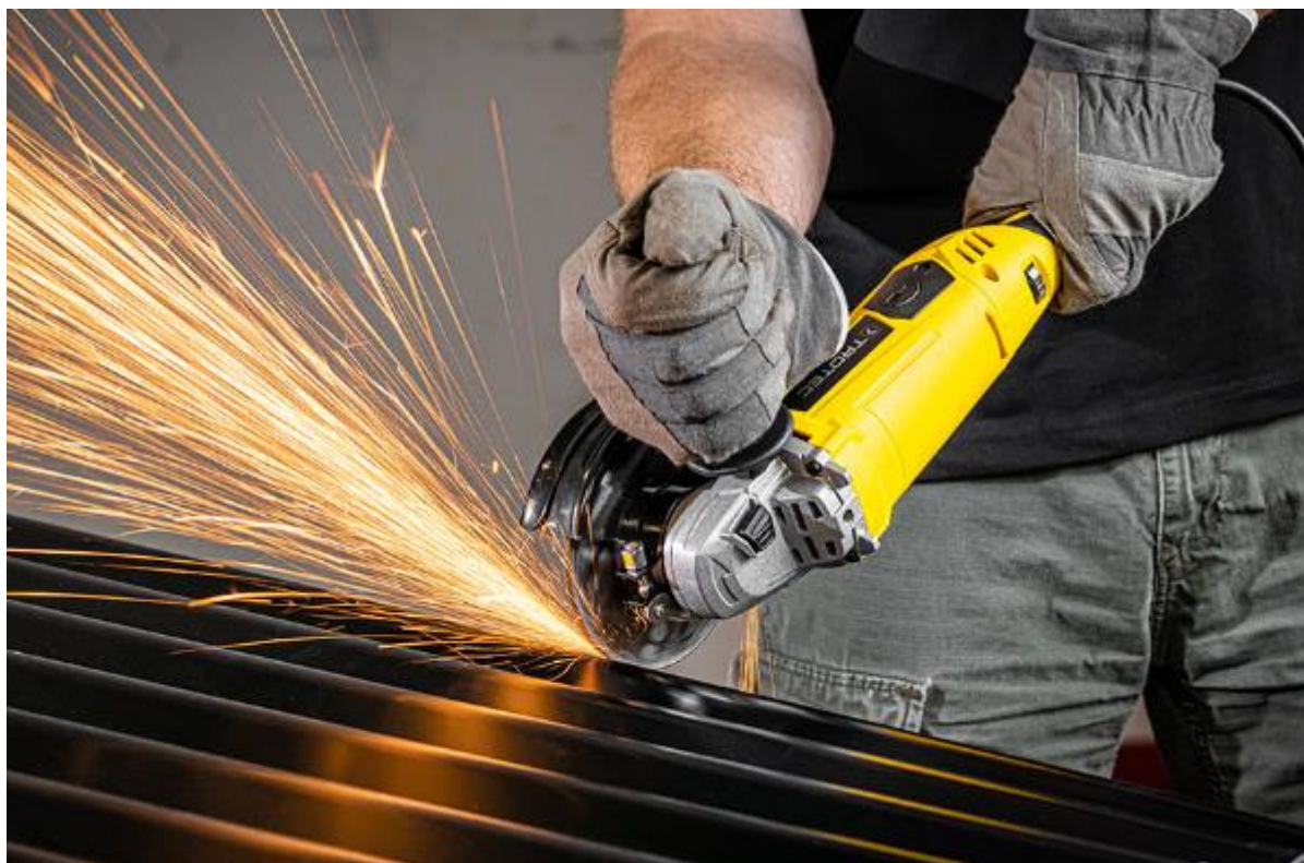
Slika 11. Pravilan način korištenja uređaja kutne brusilice [8]

Rad sa kutnom brusilicom je jako opasan i potrebno je pridržavati se mjera sigurnosti i zaštite na radu te mjera osobnih zaštitnih sredstava. Kutne brusilice omogućuju razdvajanje, brušenje i poliranje najrazličitijih materijala kao što su: beton, keramika, kamen, drvo i metal. Kutne brusilice su uređaji koji načelno rade na istom principu, međutim, te se konstrukcije uređaja razlikuju svojom izvedbom. Mala težina velika je prednost u slučaju dugotrajne uporabe. Ovisno o modelu, uređaj može težiti između 1,5 do 6 kg. Kako bi se djelatnik osigurao, svi modeli kutnih brusilica imaju metalni ili plastični poklopac koji prašinu, strugotinu i iskre odvodi daleko od rukovatelja te tako smanjuje mogućnost ozljeda. Posebno je praktično usisavanje prašine koja sigurno skuplja strugotinu i omogućuje rad s alatom bez ikakve prašine. Tijekom rada s kutnom brusilicom moguće je pregrijavanje motora. Kako bi se spriječilo pregrijavanje, mora se osigurati dovoljna ventilacija (noviji modeli kutnih brusilica imaju električno hlađenje). Ukoliko se kutna brusilica koristi duže vremena, trebala bi biti prisutna zaštita od preopterećenja. Strujanje zraka odnosno hlađenje bi trebalo biti usmjereno prema naprijed kako bi se strugotine i iskre otpuhale od djelatnika [8].