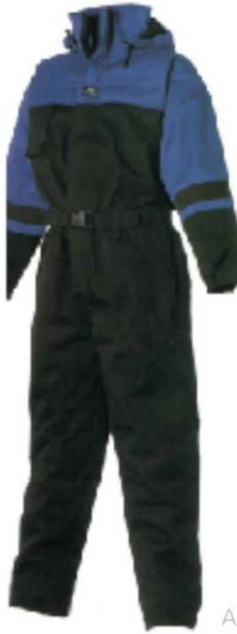
Slika 8. Kombinezon [5]