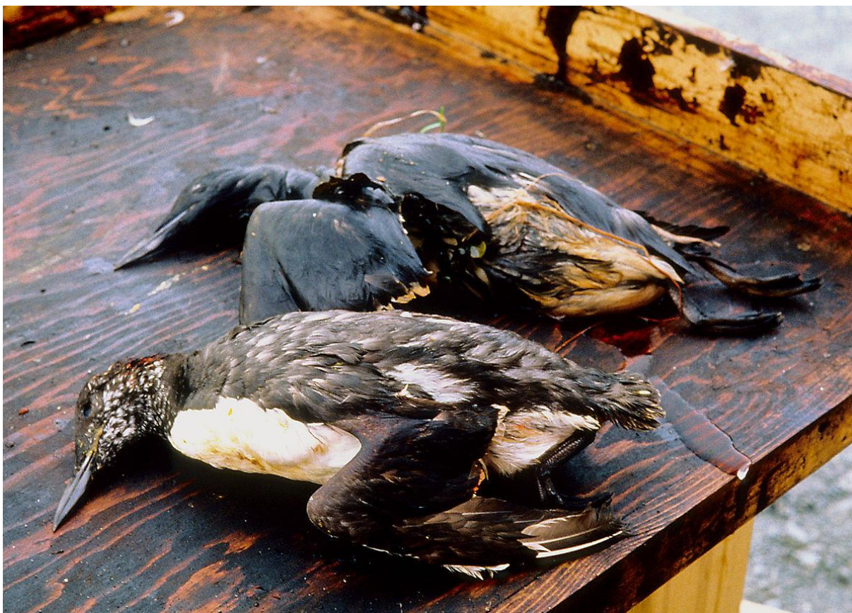
Slika 5. Ptice prekrivene naftom