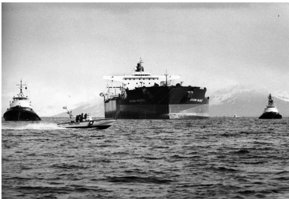
Slika 4. Prikaz Tankera Exxon Valdez iz 1989.godine.