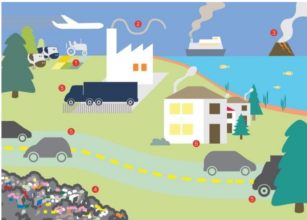
Slika 9. Izvori onečišćenja zraka.

Pod onečišćenjem zraka podrazumijevaju se sve negativne tvari koje su prisutne u njemu. To su plinovi, pare, magle, dimovi i prašine koje u doticaju sa ljudima mogu imati poguban utjecaj na njih. U današnje vrijeme teško je naći područja sa čistim zrakom koji nema u sebi neko onečišćenje iz razloga što na zrak konstantno utječu globalna i lokalna onečišćenja. Veliki utjecaj na zagađenje ima i sam čovjek koji svojim postupcima i ponašanjem šteti sebi i prirodi. Industrijskim parama i plinovima, poljoprivredom, neracionalnim skladištenjem otpada i nedovoljnom brigom u kućanstvu i domaćinstvu. Za primjer utjecaja ljudi na zagađenje oko 90% amonijaka i 80% metana u zraku zaslužni su poljoprivrednici, dok oko 60% sumpornih oksida dolazi iz energetske postrojenja što je prikazano u tablici 2. Izgaranje goriva u motorima automobila glavni je čimbenik i u onečišćenju zraka.