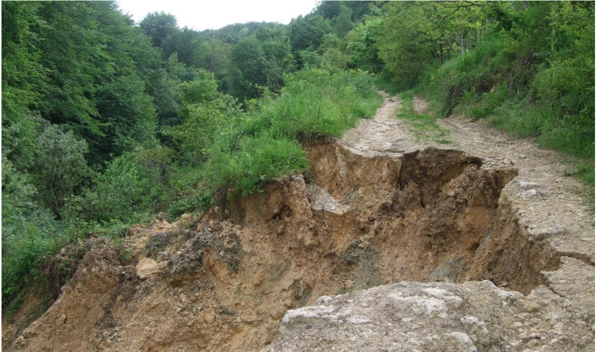
Slika 8. Prikaz djelovanja erozije na tlo.