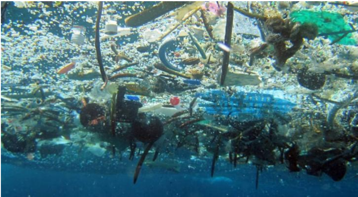
Slika 3. Otpad u moru

Otpad u morima uzrokuje i ekonomske gubitke za njihove zajednice i sektore koji se bave obradom, preradom i lovljenjem morskih organizama. Uveliko šteti i proizvođačima morske opreme i ljudima koji se bave turističkim djelatnostima. Ovi problemi ukazuju na to da se premalo koristi recikliranje i ljudska svijest o ovom problemu [3].