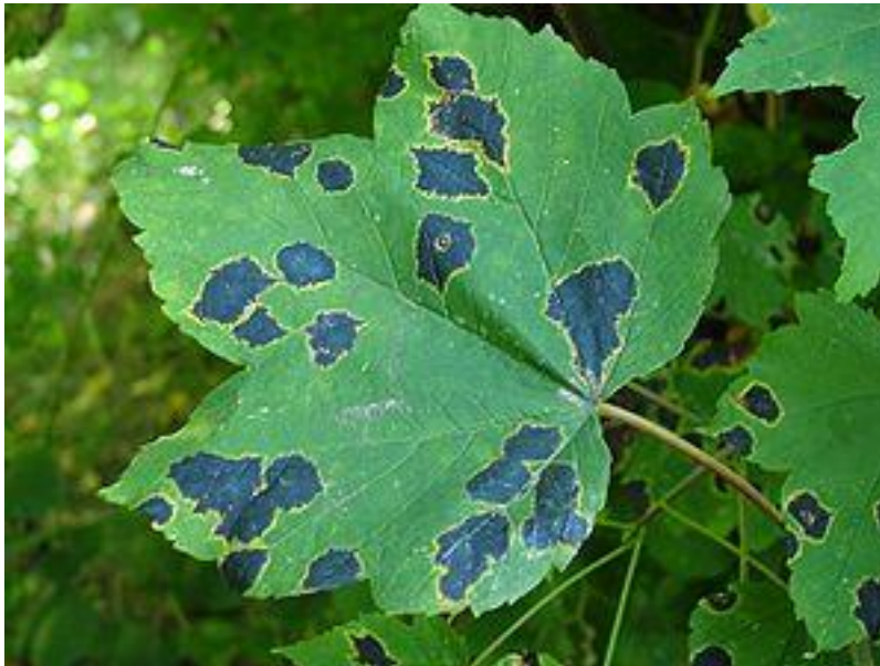
Slika 1. Priroda nakon djelovanja kisele kiše.

Neki od simptoma su oštećenja iglica, pupoljaka i mladih klica, kore i drveta. Usporeni rast i oštećen korijen stabala te su slabije otporne na mraz, infekcije i štetočine. Slika 1 prikazuje list drveta nakon utjecaja kiselih kiša. Uz bolje uvijete moguća je regeneracija i ponovo ozelenjavanje drveća, no ako dođe do izumiranja to će imati za posljedicu promjenu cijelog ekosustava.