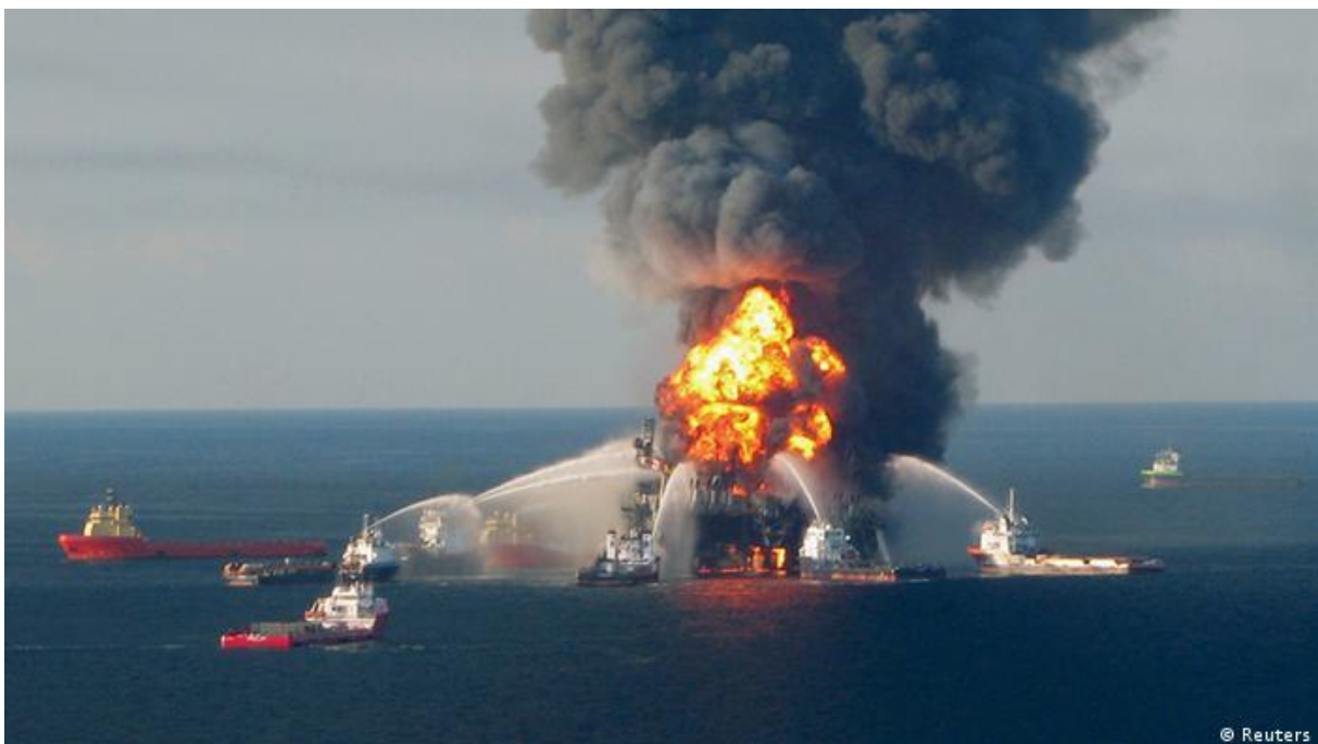
Slika 6. Gašenje požara u Meksičkom Zaljevu

Obalna straža odmah je intervenirala i poslani su helikopteri iz Alabame i Louisiane. Uz njih poslana su i četiri broda kako bi evakuirali posadu i tražili nestale. No ipak, vremenski uvjeti i dim su onemogućili i usporili potragu. Za vrijeme gašenja požara s naftne platforme istjecale su ogromne količine u more i nije bilo naznaka kako ih zaustaviti. U srpnju je istjecanje naftne nekako i zaustavljen. Koristili su kapsulu s ventilom, no kapsula je omogućavala samo privremeno zatvaranje bušotine kada bi bilo nevrjeme. Ipak do rješenja su došli tako što su probušili dvije dodatne bušotine radi smanjivanja tlaka. Nakon zatvaranja krenulo je intenzivno čišćenje obale. Uginuli su obalni koralji i dupini. Plaže Sad-a i Meksika su mjesecima bile prekrivene leševima životinja. Ribari su pronalazili rakove s jednim okom i mekanom ljuskom, a razlog je bio spoj kemikalija koje su prskali po naftnim mrljama kako bi se razložili. One su ušle u hranidbeni lanac kao otrov.