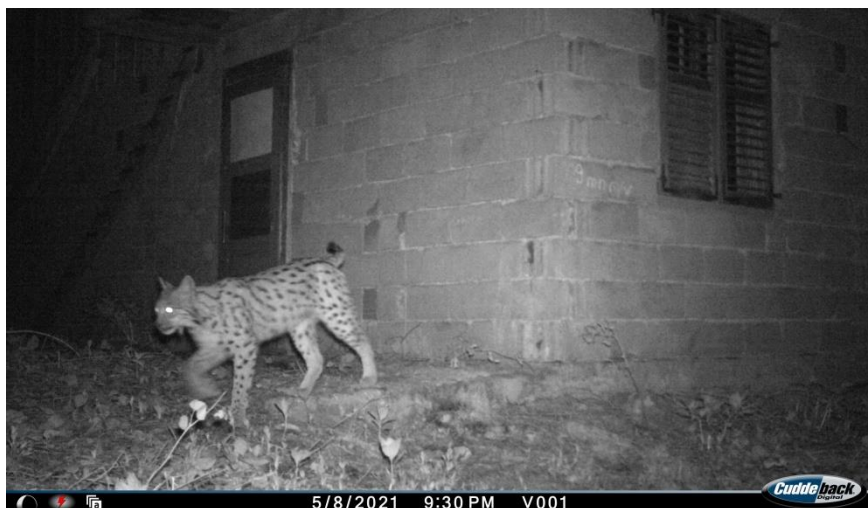
Slika 4: Ris Šiljo snimljen na lokaciji Begova cisterna