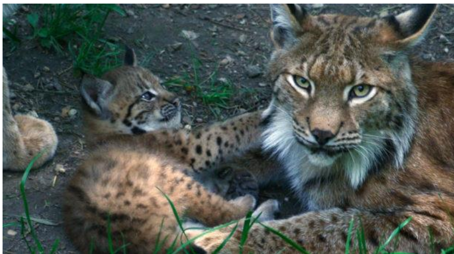
Slika 2. Ženka s mladunčetom

Mladunčad siše do dobi od 6 mjeseci, ali se istovremeno hrani i mesom, počevši već s mjesec dana (LINDEMANN, 1995.). Mladi risovi ostaju s majkom do sljedeće sezone parenja kada ju s napunjenih 10 mjeseci, težine 9-14 kg napuštaju (BREITENMOSER i sur., 2000.) te pronalaze vlastiti životni prostor. Ženke postaju spolno aktivne u dobi nakon 10 do 20 mjeseci, dok mužjaci nešto kasnije, nakon 30 mjeseci. Ženke se mogu pariti u svojoj prvoj reproduktivnoj sezoni, no mlađe jedinice imaju manja legla. Reproductivni uspjeh populacije ovisi o uvjetima okoliša, odnosno o gustoći plijena. Spolno su aktivni do kasne starosti, odnosno od 12 do 13 godina. U prirodi mogu doživjeti do 18 godina (veliki su gubici u prvoj i drugoj godini života), dok u zatočeništvu dožive i do 25 godina (KVAM, 1991.).