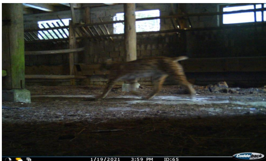
Slika 5: Primjer fotografije koja nije pogodna za identifikaciju