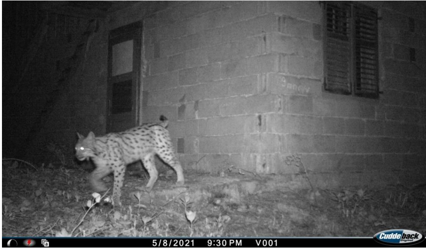
Slika 4: Ris Šiljo snimljen na lokaciji Begova cisterna