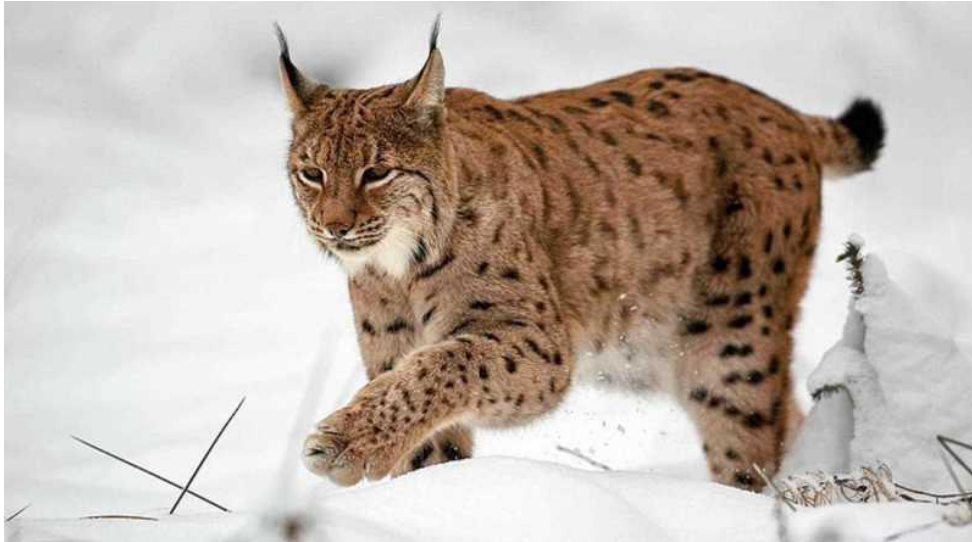
Slika 1. Euroazijski ris

Kao i sve prave mačke ris može uvući pandže u šapu, tako da se iste ne vide u otiscima nogu. Pandže ris koristi u hvatanju i deranju plijena, obilježavanju stabala i penjanju. Ris ima 28 zuba uz zubnu formulu I\ 3 / 3 , C\ 1 / 1 , P\ 2 / 2 , M\ 1 / 1 . Zubalo je građom karakteristično za mesojede (JANICKI i sur., 2007).