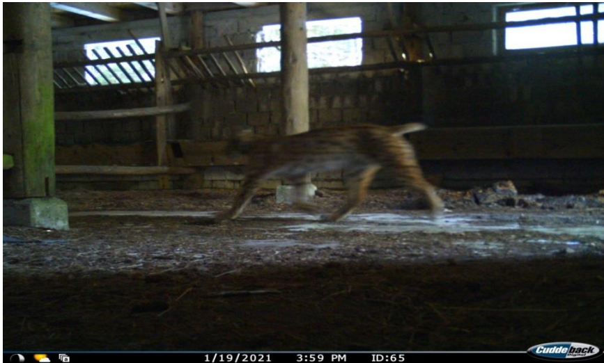
Slika 5: Primjer fotografije koja nije pogodna za identifikaciju