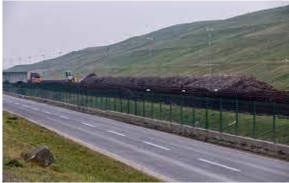
Slika 8 Odlagalište otpada Jakuševac