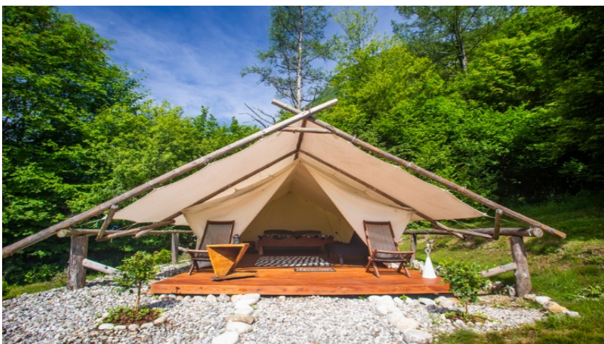
Slika 1: Primjer glamping šatora

Malo je smještajnih objekata koji nude ponudu sa glamping sadržajima, ali pošto potražnja ubrzano raste, mnogi se kampovi okreću k toj ponudi te grade nove smještajne objekte, infrastrukturu te dodatne sadržaje.