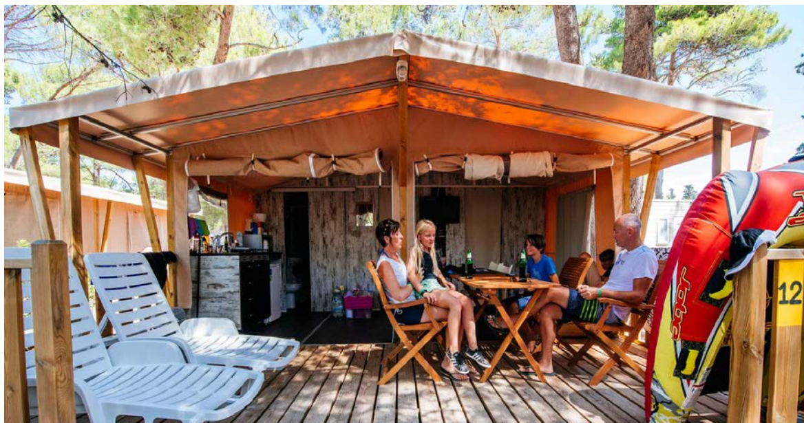
Slika 6: Safari šator u Zaton Glamping resortu