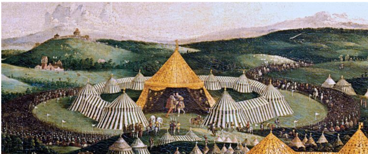
Slika 2: Prikaz turnira „Polje zlatne tkanine“ i velikih šatora

Raskošni šatori se nisu samo koristili u Turskoj već i u Europi. U Francuskoj je održan turnir pod nazivom „Polje zlatne tkanine“ upravo zbog luksuznih tkanina od kojih su sastavljeni šatori. Turnir je održan u počast prijateljstva engleskog kralja Henryja VIII i francuskog kralja Franje I., gdje su smjestili oko 2800 šatora i nadstrešnica okruženih fontanama iz kojih je teklo crno vino. 30