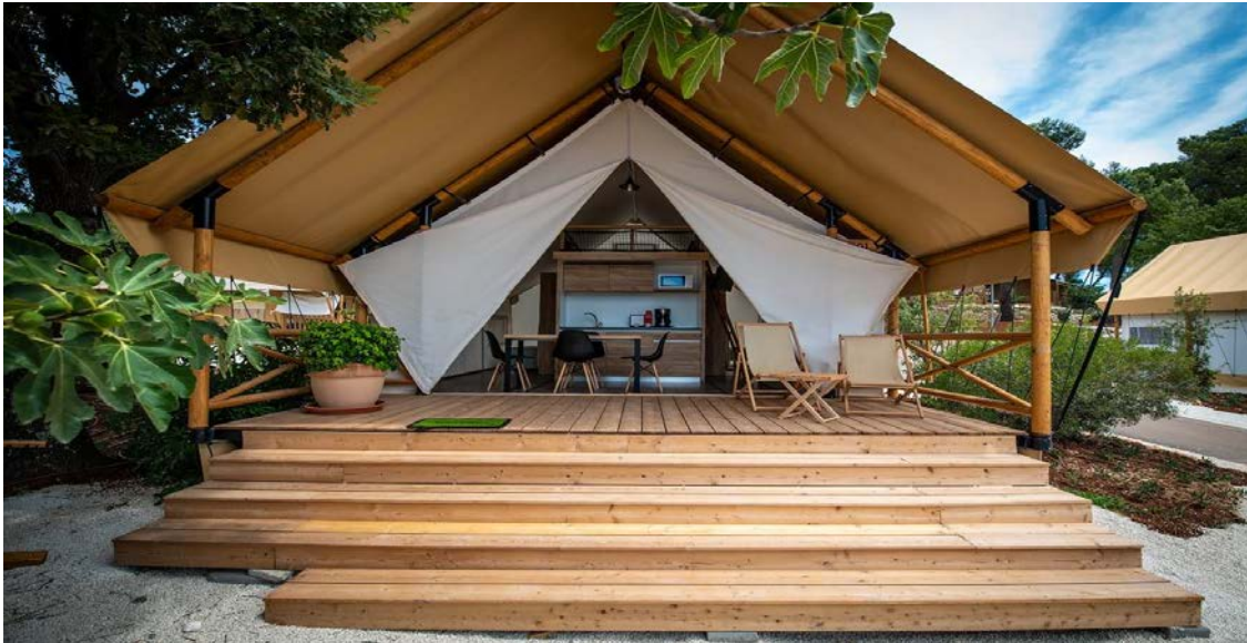
Slika 4: Premium safari šator, Arena One 99 Glamping

jednu dvokrevetnu sobu, jednu sobu s odvojenim krevetima u prizemlju, te jednu dvokrevetnu sobu u galeriji . Od uređaja ima klimu, besplatni WIFI, sušilo za kosu, flat screen TV, sef za čuvanje vrijednih stvari gostiju, opremljenju kuhinju sa mikrovalnom, hladnjakom, indukcijskom pločom za kuhanje te aparatom za kavu. Također su dozvoljeni i kućni ljubimci uz nadoplatu, te nude najam električnih autiju.