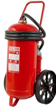
Slika 16. Prijevozni aparat za gašenje