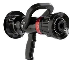
(Slika 7. Specijalna mlaznica)