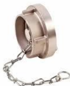
(Slika 2. slijepa spojnica)