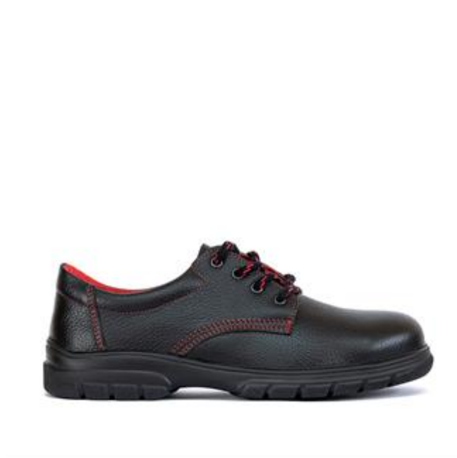
Sl. 6 Zaštitna cipela, niska [19]

Osobna zaštitna oprema za zaštitu nogu i stopala služe za zaštitu od hladnoće, uboda, sklizanja, kemikalija te padova teških predmeta.