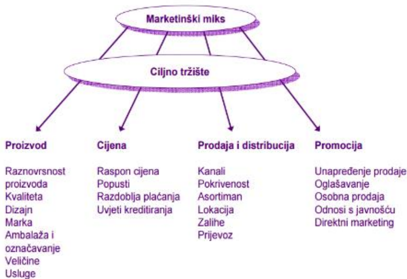
Slika 1: Koncept marketinškog miksa

Izvor: prema Kotler P., „Upravljanjem marketingom“, Mate d.o.o., Zagreb, 2001.