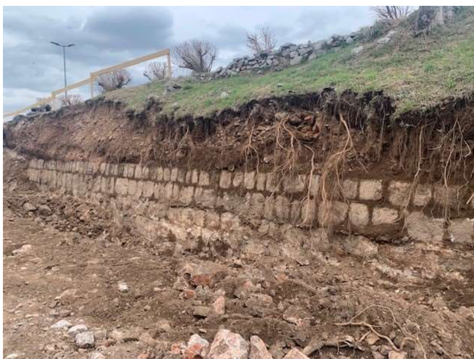
Sl.6. Fragmenti sanacije starog odvoda bujice u Senju

[ https://www.lika-online.com/sanira-se-stari-odvod-bujica-u-senju/ ]