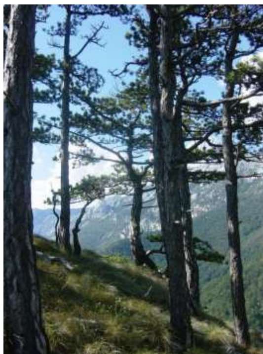
Sl.1. Primjeri zaštitnih šuma – sastojina bukve na Dinari (gore), sastojina crnog bora na Velebitu (dolje) [Šumskogospodarska osnova 2016-2025; 704,705]