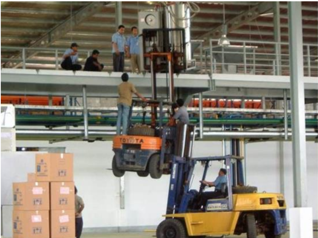
Slika 1. Primjer nepravilnog izvođenja radne operacije

nove radne oprema ili kod uvođenja nove tehnologije ponovno stavljati pod nadzor osposobljenog radnika, ili je dovoljno radniku dati nove informacije i upute te provesti odgovarajući postupak provjere znanja kako bi bili sigurni da je radnik dodatne informacije i upute razumio. Upitno je treba li radnik ponovno prolaziti i ocjenu praktične osposobljenosti te tko će tu ocjenu obaviti u slučajevima kad je uvedena nova radna oprema ili tehnologija koja je nova i neposrednim rukovoditeljima i ovlaštenicima poslodavca. 3