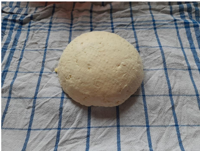
Slika 13. Slani sušeni sir