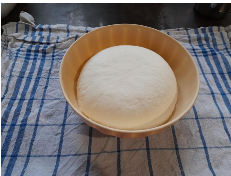
Slika 14. Svježi sir iz „krpe“

Slani sušeni sir je zapravo svježi sir koji se u potpunosti ocijedi od sirutke te se dobro posoli i zatim stavi na sušenje oko 10 dana.