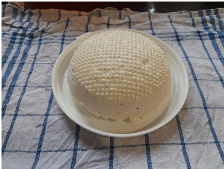
Slika 10. Svježi sir

Suhi sir se proizvodi prosječno od oko 5 litara mlijeka kao i suhi sir sa vlascem. Razlika je u tome što u običan suhi sir ne ide začim vlasac, već ostaje samo blago posoljen.