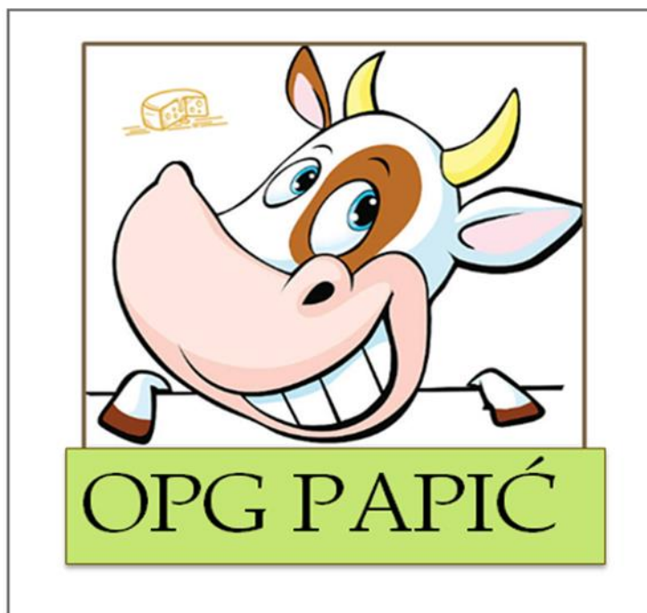
Slika 16. Logo OPG-a Papić

PAPIĆ“ koji je ispunjen zelenom bojom, a upravo zelena boja je simbol ekološke proizvodnje domaćih proizvoda.