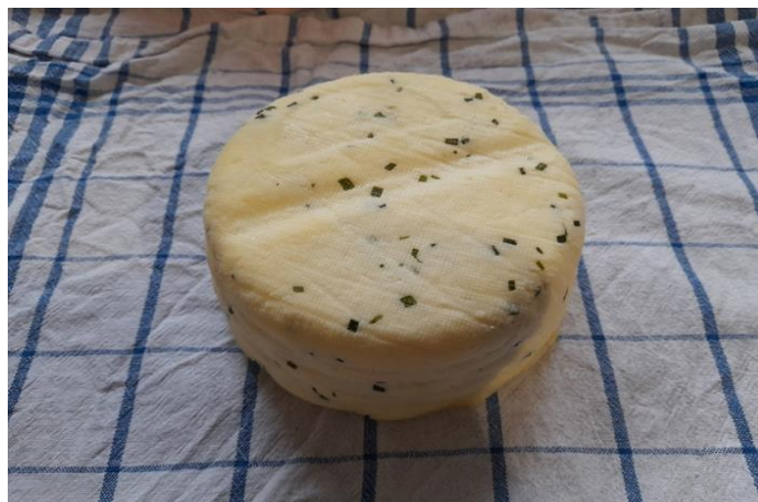
Slika 8. Suhi sir s vlascem

U nastavku ovo završnog rada opisani su i prikazani svi proizvodi OPG-a Papić.