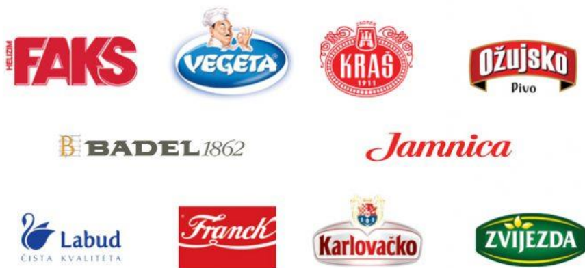
Slika 6. Poznati domaći brendovi