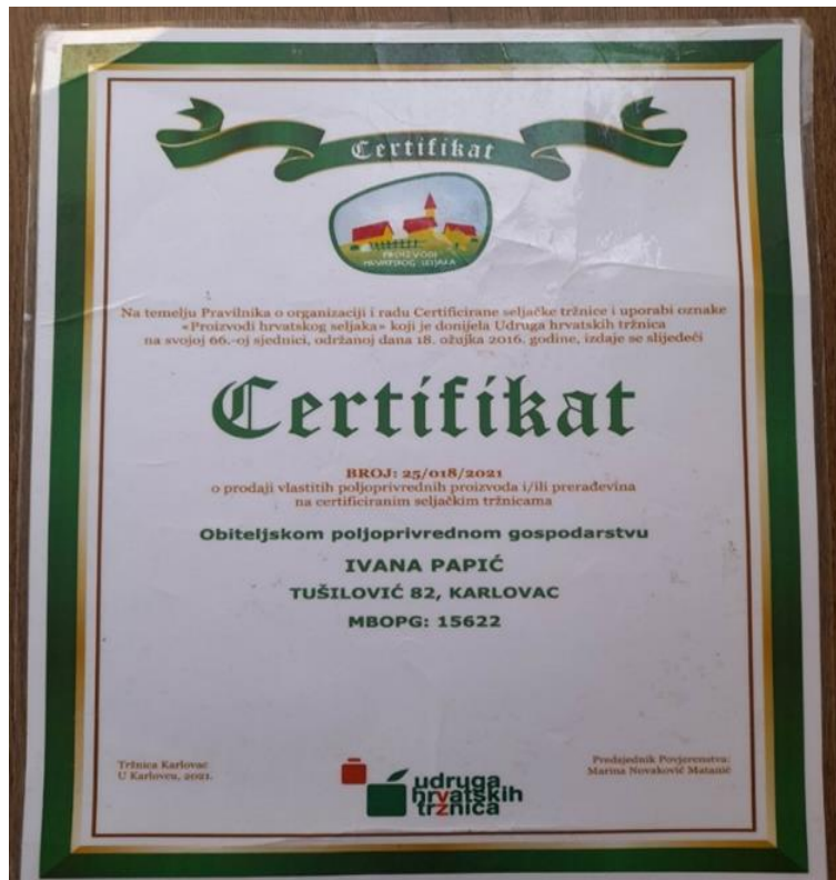
Slika 7. Certifikat