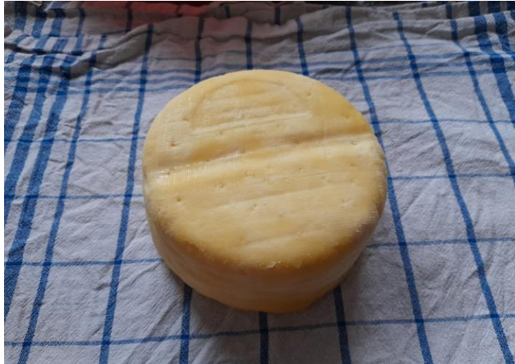
Slika 9. Suhi sir

Suhi sir s vlascem proizvodi se prosječno od oko 5 litara mlijeka. Mlijeko se obradi na poseban način te mu se doda žlica vlasca i zatim je potrebno da odstoji u kalupu 24 sata.