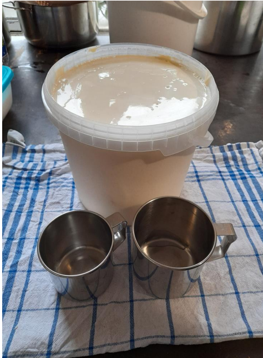
Slika 12. Vrhnje