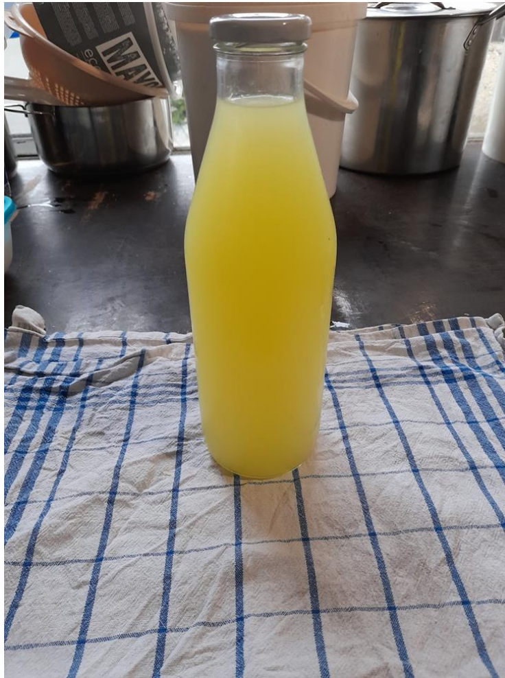
Slika 11. Sirutka

Za izradu svježeg sira potrebno je ostaviti mlijeko da se samo od sebe ukiseli. Moguće je proces ubrzati postepenim zagrijavanjem. Zatim se raspodijeli u kalupe kako bi se sir odvojio od sirutke. Od 12 litara mlijeka može se dobiti prosječno 5 manjih sireva. Sve ovisi o stupnju masnoće mlijeka.