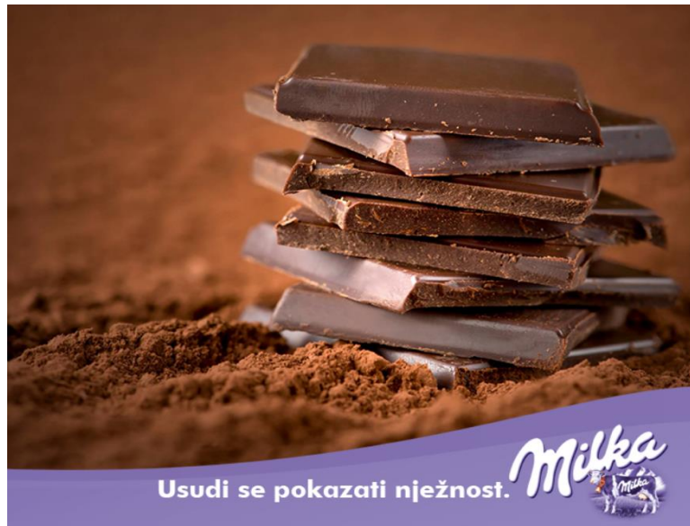
Slika 3. Slogan Milka čokolade