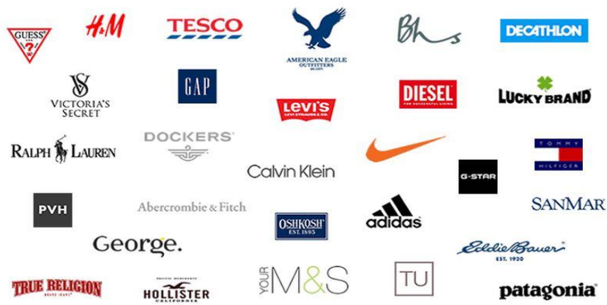
Slika 5. Poznate tekstilne marke