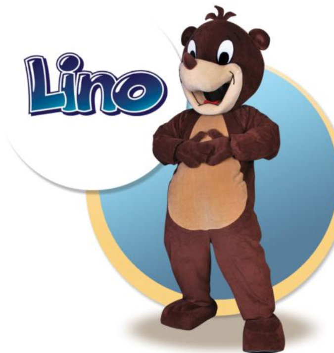
Slika 4. Maskota Lino