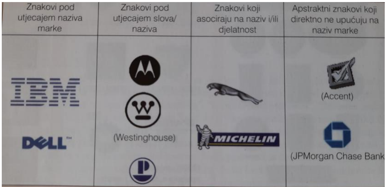
Slika 2. Prostor znak/logo marke