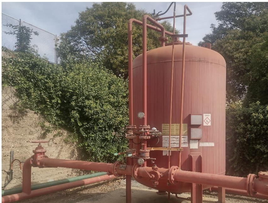
Sl. 6. Spremnik za pjenilo i mješač vode i pjenila

Spremnik za pjenilo i mješač vode i pjenila – u spremniku se nalazi pjenilo a mješač stvara mješavinu vode i pjenila u određenom omjeru. Miješanje može biti podtlačno ili pretlačno. Kod pretlačnog mješača koristi se pumpa za pjenilo dok kod podtlačnog mješača, mješač dozira pjenilo stvaranjem podtlaka u mješaču.