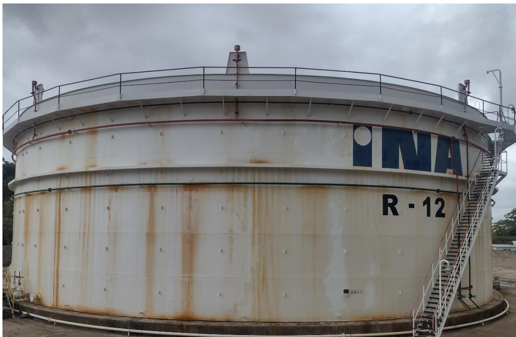
Sl. 4. Spremnik s plivajućim krovom

U spremnicima s plivajućim krovom skladište se lako hlapivi mediji( nafta, benzin, alkoholi). Kod takvih spremnika krov pliva na površini uskladištenog medija. Prostor između oboda plivajućeg krova i plašta potrebno je brtviti jer se ostavlja razmak od nekoliko stotina milimetara zbog nemogućnosti točne izrade spremnika. Oborinske vode odvođe se s krova pomoću posebnih cijevi na plašt spremnika i ispuštaju u bazen oko njega. 12