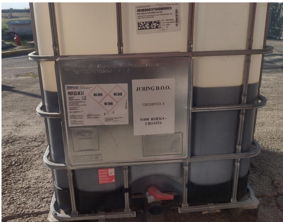
Sl. 11. Spremnik Fluorproteinskog pjenila koje stvara vodeni film FFFP

Alkoholno otporna ili univerzalna pjenila (oznaka AR ispred oznake osnovnog pjenila), namijenjena su za gašenje polarnih i nepolarnih tekućina. Osnova za njihovo dobivanje može biti proteinska i sintetska.