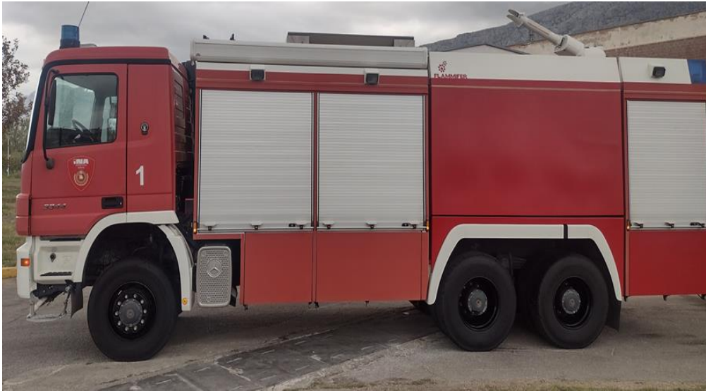
Sl. 16. Posebno vatrogasno vozilo za gašenje vodom i pjenom