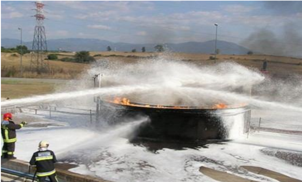
Sl. 12. Gašenje požara pjenom