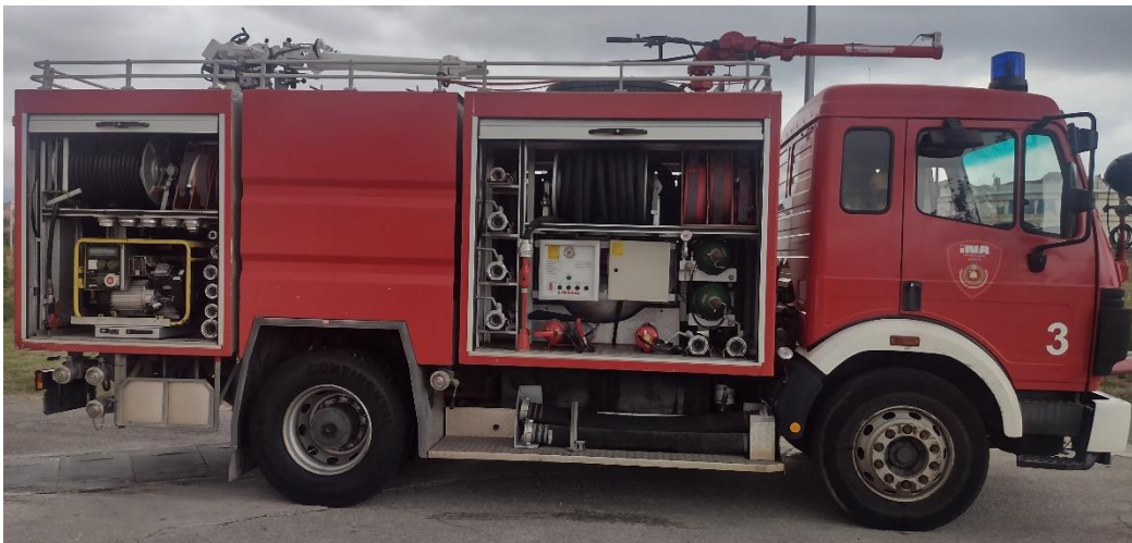
Sl. 17. Posebno vatrogasno vozilo kombinirano (Pjena/ Prah)