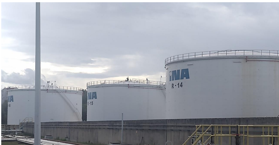
Sl. 3. Spremnici s čvrstim krovom

U Spremnike s čvrstim krovom skladište se teže hlapive zapaljive tekućine kao što su plinska ulja, loživa ulja itd. i oni rade pod atmosferskim tlakom. Većinom se ne rade veći od 30000m 3 . Krov može biti samonosiv s profilnom ili rešetkastom konstrukcijom oslonjenom u kutni profil na vrhu plašta spremnika ili s jednim ili više nosivih stupova. Zavareni spoj krova i plašta izvodi se kao najslabija točka, u slučaju povećanja tlaka u spremniku na tom mjestu došlo do pucanja i tako spriječi izlijevanje zapaljive tekućine. 11