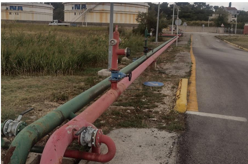
Sl. 7. Sistem cjevovoda

Sistem cjevovoda – služi da sredstvo za gašenje dovedemo od izvora preko mlaznica do požara.