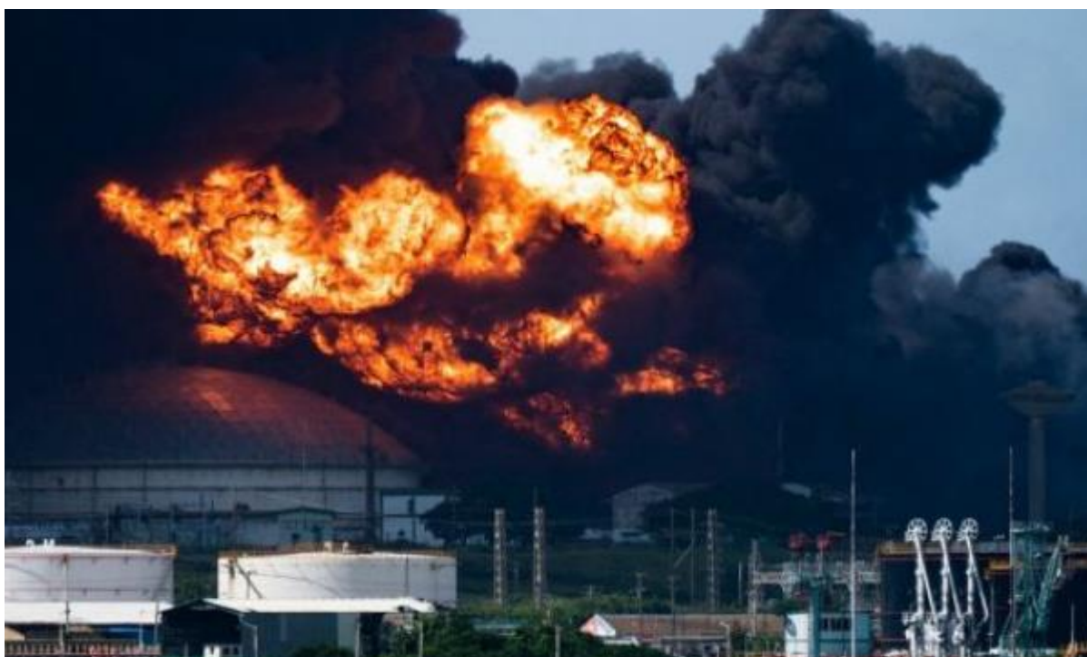
Sl. 10. Požar spremnika u skladištu nafte

Kod požara u okolini spremnika potrebno je hladiti sve metalne dijelove izložene plamenu. Ako je do požara došlo uslijed istjecanja zapaljivih tekućina potrebno je zatvoriti dotok tekućine zatvaranjem ventila da bi lakše ugasili požar. Ako se radi o požaru naftne tekućine koja se prolila po tlu za gašenje možemo koristiti pjenu ili prah. Pjenu koristimo za gašenje požara oko spremnika i u prihvatnim bazenima, važno je znati da ovakve požare treba stavljati pod kontrolu prije početka gašenja spremnika.