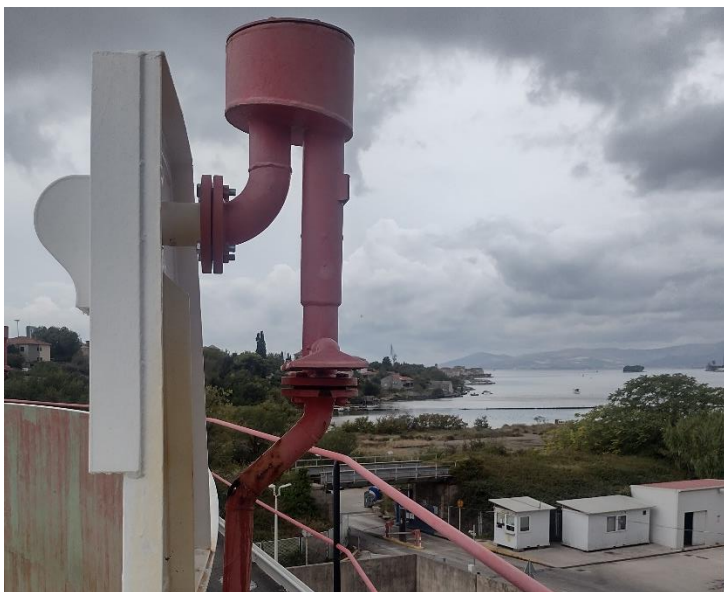
Sl. 9. Mlaznica za zračnu pjenu na spremniku s plivajućim krovom

Mlaznice za zračnu pjenu – mlaznice podtlakom dodaju zrak u mješavinu i tako se stvara pjena koja gasi nastali požar.