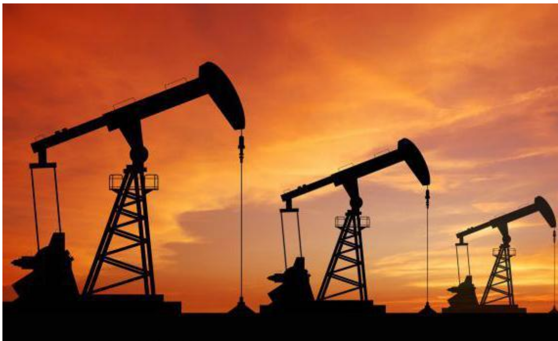
Sl. 1. Naftne bušotine

Planovima zaštite od požara mogu se donositi i druge mjere, ako se pojave neke opasnosti koje mogu dovesti do izbijanja požara ili eksplozija. Operativni planovi zaštite od požara donose se zasebno za svaku proizvodnu jedinicu odvojeno. U njima su sadržane sve protupožarne mjere i postupci kojima bi se spriječile opasnosti koje mogu dovesti do požara, a ako do njega i dođe da bi se moglo učinkovito gasiti. U svakom takvom planu posebno treba obuhvatiti: