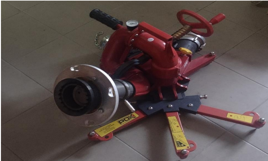
Sl. 15. Prijenosni bacač za gašenje vodom i pjenom

-vertikalno kretanje-značajke pjene: -postotak miješanja, stupanj opjenjenja, polovinsko vrijeme raspadanja