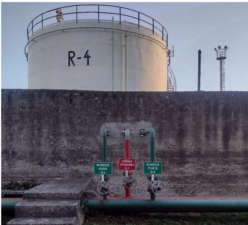
Sl. 8. Razdjelni ventili

Razdjelni ventili – služe da mješavinu vode i pjenila usmjerimo prema određenom spremniku.