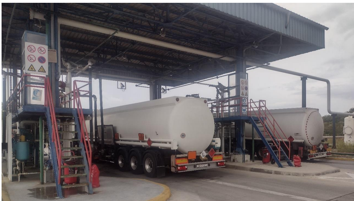
Sl. 5. Auto pretakalište zapaljivih tekućina [Vlastita fotografija]

Opasnost od požara tijekom pretakanja. Sam prostor oko pretakališta zapaljivih tekućina podijeljen je u više zona. Zona II. koja obuhvaća armature i elemente koji su dio cjeline za pretakanje i prostor oko uređaja za punjenje ili otvor kroz koji se puni cisterna polumjera 5m i visine 1m iznad gornjeg otvora kroz koji se puni, mjereno od tla. U Zona III. ubrajamo prostor iznad okolnog terena širine 15m od zone II. Mjereno horizontalno i visine 1m iznad gornjeg otvora kroz koji se puni, mjereno od tla.