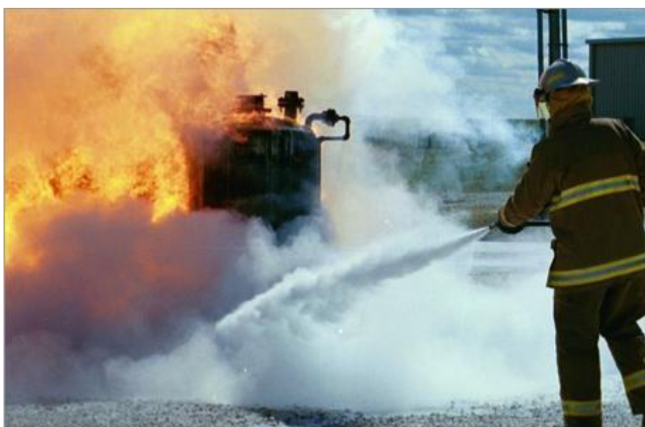
Sl. 13. Gašenje požara prahom

Količine praha koje se koriste za gašenje na otvorenom prostoru približno iznose 4 – 10 kg/m 2 , a za zatvoreni prostor od 1 – 4 kg/m 3 . Kod gašenja prahom, vatri treba prići tako da se iznad same goruće površine stvori dovoljna koncentracija oblaka praha koji će je ugušiti. Vrlo je pogodna kombinacija prah – pjena za gašenje požara, pogotovo ako su kompatibilni.