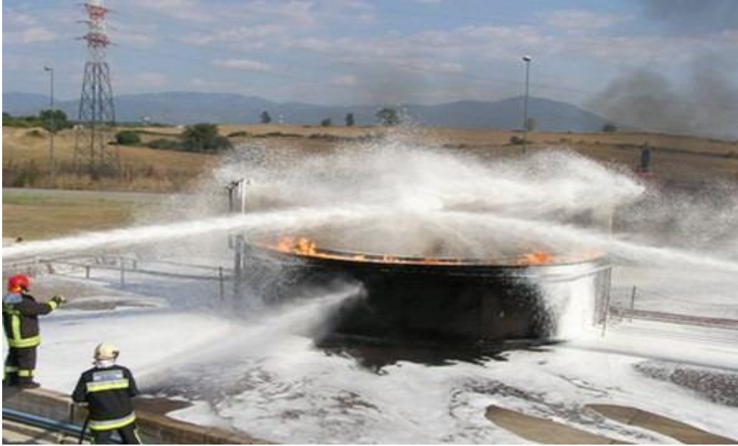
Sl. 12. Gašenje požara pjenom